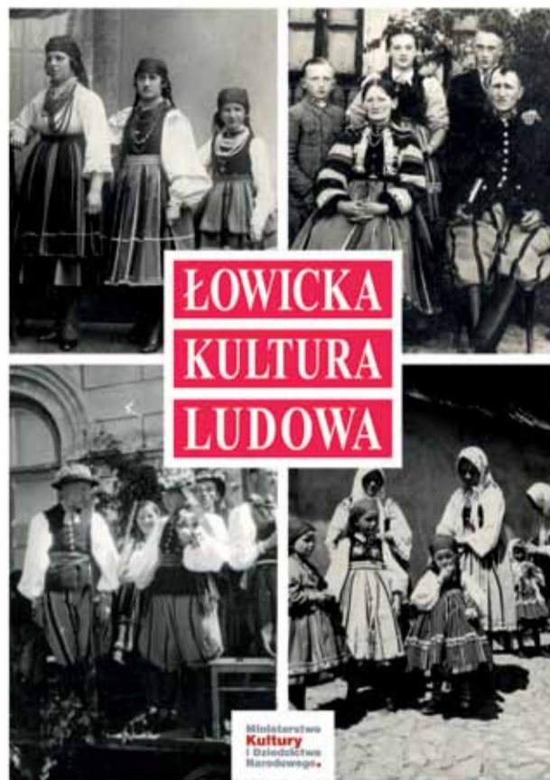
Plakat promujący nadchodzący projekt.