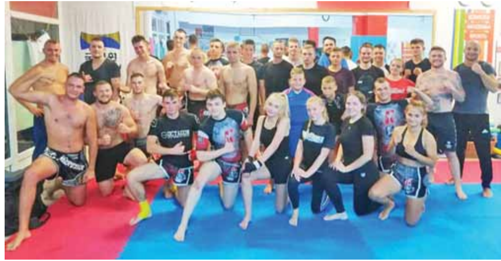
Mocna sekcja wojowników z Khroo-Gym czeka na koniec kwarantanny.

Dyscyplina ta zmieniała się przez setki lat. Ważnym krokiem w historii Muaythai było pojawienie się formuły amatorskiej. W ten sposób tak piękny sport, pozwalający na tak szeroką gamę dozwolonych technik podczas walki stał się bardzo bezpieczny, a co za tym idzie uprawiany na jeszcze większą skalę. Wprowadzono w tej formule obowiązkowe ochraniacze na głowę, klatkę piersiową, łokcie, krocze, golenie, szczękę i rękawice. Niezależnie od zmian historycznych, Muaythai nie straciło egzotycznego uroku i tajemniczości. Muaythai było, jest i będzie sprawdzianem ducha walki. To