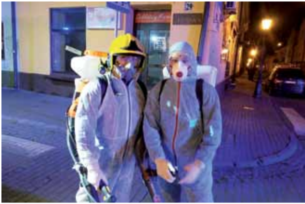
Strażacy OSP Łowicz podczas dezynfekcji miejsc publicznych w mieście 9 kwietnia.

Wyjazdy związane ściśle z zapobieganiem epidemii SARS CoV2 są normalnymi wyjazdami na akcje, w strażackich statystykach figurują przeważnie jako „miejscowe zagrożenia sanitarno-epidemiologiczne”. Polegają na przykład na rozwożeniu maseczek i rękawiczek oraz bezpośrednim