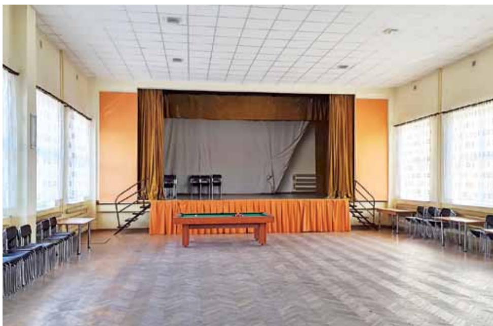
W pierwszej kolejności będzie remont sali widowiskowej. Włodarze myślą też nad przeniesieniem biblioteki do pomieszczenia po dawnej aptece.