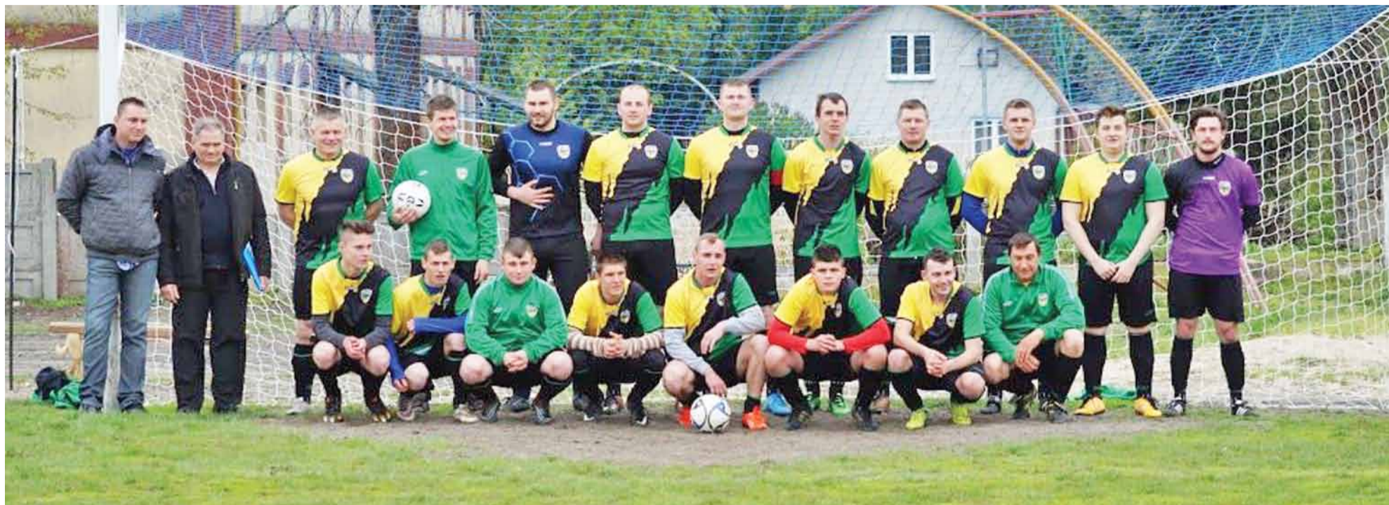
Drużyna piłkarska Olimpia Oporów zakończyła rozgrywki rundy jesiennej na bardzo dobrej - trzeciej pozycji w klasyfikacji łódzkiej B Klasy Grupy III.