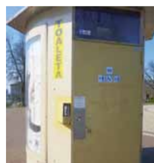
Miejscowej toalety na placu koło fontanny w Żychlinie.

Decyzja o zamknięciu toalety nie podobała się wielu mieszkańcom. – Byłem świadkiem, gdy na pogrzeb przyjechała rodzina z Polski. Szukali toalety i był problem, WC było zamknięte – mówi mieszkaniec osiedla Łąkowa. – To skandal, aby jedyne WC w Żychlinie było nieczynne. W innych miastach toalety funkcjonują, tylko w Żychlinie się je zamyka na kilka miesięcy. Skoro