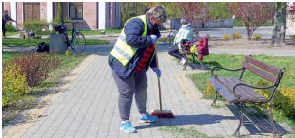
Park za kościołem został we wtorek wysprzątnięty, trawa przycięta. Wiosennymi kolorami wita mieszkańców.

Wzrost zachorowalności to sygnał dla mieszkańców powiatu kutnowskiego, aby w miarę możliwości nadal pozostawali w domach i zachowywali wszelkie środki ostrożności oraz dbali w sposób szczególny o higienę osobistą. dag