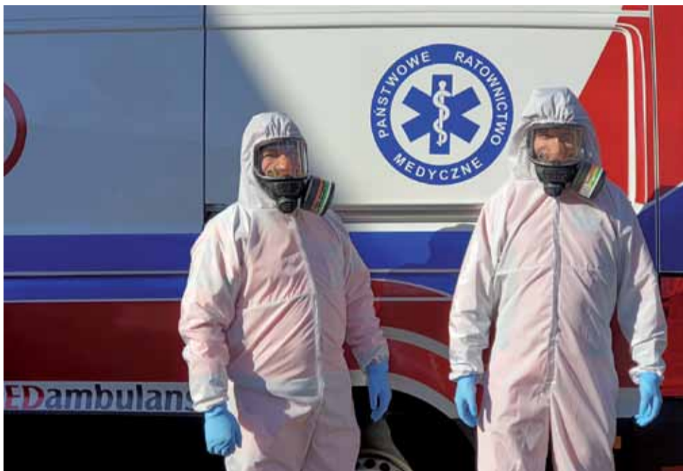
Na pierwszej linii walki z koronawirusem są pracownicy Pogotowia Ratunkowego, którzy jako pierwsi docierają do chorych pacjentów

Zdecydowanemu pogorszeniu uległa za to sytuacja w powiecie kutnowskim. Od początku pandemii w powiecie kutnowskim stwierdzono 30 zakażeń korona-