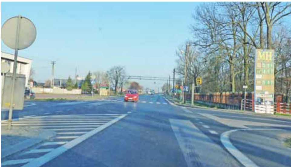
Jest szansa, że na skrzyżowaniu w Bedlnie powstanie sygnalizacja świetlna. Wniosek urzędu przeszedł pierwszy etap i uzyskał rekomendację wojewody łódzkiego. Teraz decyzja należy do ministerstwa

O budowę sygnalizacji świetlnej na skrzyżowaniu w Bedlnie mieszkańcy i samorządowcy za-