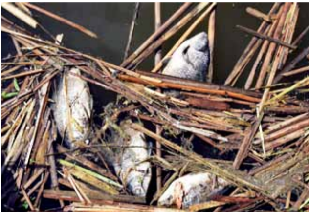
Śnięte ryby przy przepuście były częstym widokiem przez około 2-3 tygodnie.

Możliwe przyczyny to na przykład wadliwa partia zakupionych do zarybienia ryb, nieodpowied-