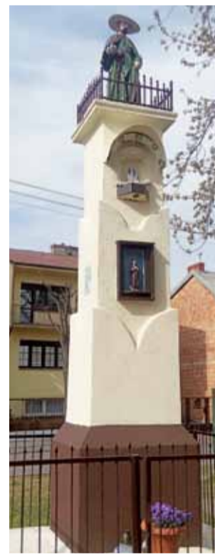
Kapliczka św. Rocha z 1852 r.