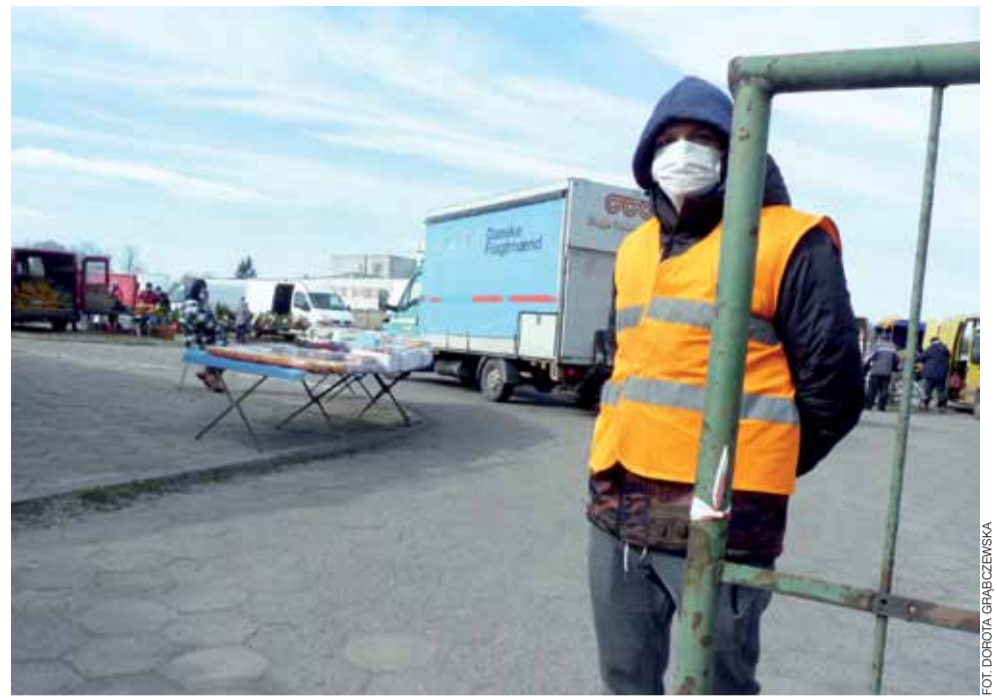
Przed wejściami stali pracownicy komunalnej spółki Mig-Ma zarządzającej targowiskiem, którzy kontrolowali sprzedających i kupujących.