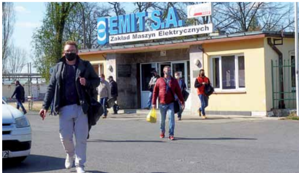
W Emicie na razie nie ma zwolnień, a prezes podkreśla, że chce uchronić załogę przed zwolnieniami.

– Dzięki temu, że działalność firmy jest na różnych płaszczyznach, jakoś dajemy sobie radę. Na razie nie planuję żadnych zwolnień. Powiem więcej, teraz pracownicy w obawie utraty pracy pracują jeszcze lepiej – mówi