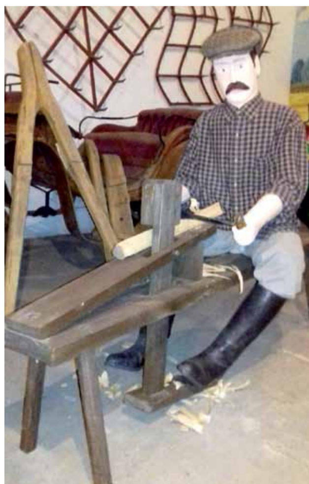
Stelmach z Muzeum Ludowego w Sromowie na ławce kobylicy – to nowa rzeźba przygotowana w tym sezonie.