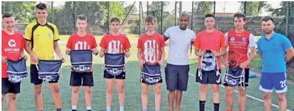
Piłkarze juniorów GKS Bedno w rozegranym wewnętrznym turnieju podzielili się na trzy ekipy. Najlepszym okazał się zespół pod nazwą Gmina Bedno.

Wszyscy zawodnicy zostali podzieleni ze względu na miejsce zamieszkania na trzy reprezentacje: Gmina Bedno, Gmina Żychlin oraz „Reszta Świata”, w skład której tworzyli zawodnicy z gmin: Krzyżanów, Oporów oraz Strzelce. W zawodach poza konkursem wystąpiła też drużyna seniorów, która odniosła dwa zwycięstwa i raz zremisowała.