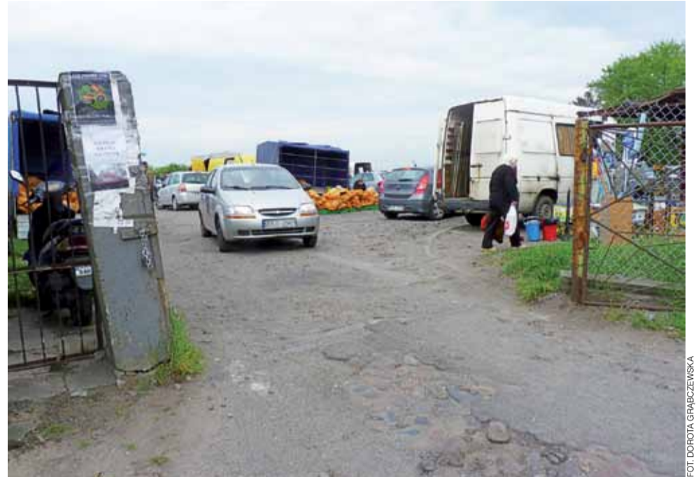
Wjazd i wyjazd z targowiska jest tak wąski, że może przejechać tylko jeden samochód, co zakłóca płynność ruchu.

Na przeszkodzie zastosowania tego rozwiązania stanął protest okolicznych mieszkańców i OSP oraz względy techniczne, brak kanalizacji deszczowej, któ-