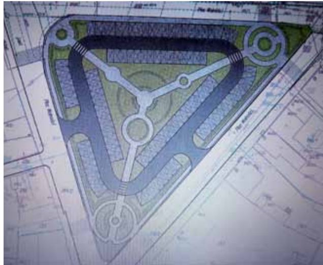
Tak wyglądała koncepcja zagospodarowania Placu Wolności w 2013 roku.

W 1998 roku przygotowano koncepcję zagospodarowania komunikacyjnego, poczynając od wjazdu na teren zakładu Union Chocolate, aż do skrzyżowania przed budynkiem OSP, jak również wyznaczenie nowego wjazdu i wyjazdu z targowiska – odpowiada burmistrz. – Prowadzone