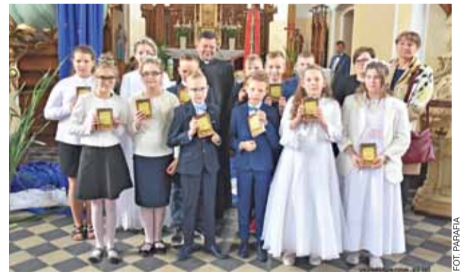
W uroczystości rocznicy I komunii świętej 30 maja uczestniczyło 12 uczniów z SP Pacyna.

– Odżyły radosne wspomnienia, które towarzyszyły nam przed rokiem – mówi ks. Zbigniew Ciechowski, proboszcz z Pacyny. – Pierwszy sakrament pokuty i pierwsze przyjęcie Komunii Świętej, Biały Tydzień, wielki entuzjazm i przeżycia towarzyszące tym chwilom. Stojąc jeszcze raz wspólnie w bliskości ołtarza, ubrane w odświętne stroje, idące w uroczystej procesji po Najświętszy Sakrament – dzieci przeżywały raz jeszcze te radosne chwile, przypominając, że Jezus żyje i jest obecny w Eucharystii. Na koniec uroczystości każde dzie-