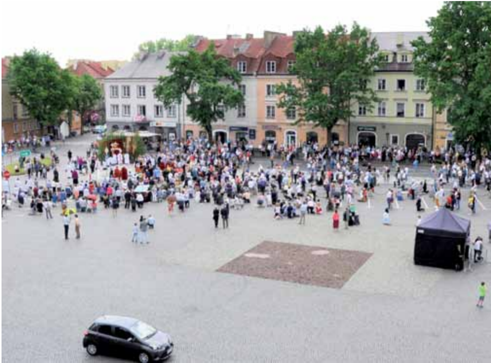
Stary Rynek w czasie procesji, która zatrzymała się przy drugim ołtarzu – widać, jak mało było jej uczestników i turystów – 1/4 tego, co w ubiegłych latach.