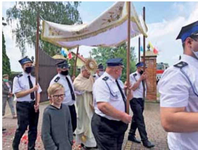
Baldachim nieśli strażacy. W tym roku procesja była wokół kościoła.

W Pleckiej Dąbrowie uroczystości Bożego Ciała były w tym roku, ze względu na pandemię, skromniejsze. Wiernych też było mniej niż zwykle. Procesja poszła trzy razy wokół kościoła. Zdecydowana większość wiernych była w maseczkach. Zgodnie z prośbą proboszcza teren wokół świątyni wyłożono tatarakiem i brzoźkami. Baldachim nieśli strażacy z OSP Plecka Dąbrowa, wszyscy w maseczkach. Dag