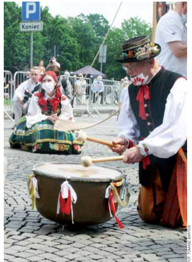
Tradycyjnie w czasie procesji Bożego Ciała nie zabrakło dźwięku bębna.