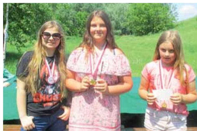
Medalistki najpiękniejszej kategorii szachowej w sobotnim turnieju na Błoniach.

Po rozgrywkach w grupach przyszedł czas na walkę o najważniejsze trofeum w zawodach, który został rozegrany systemem rosyjskim czyli do dwóch przegranych pojedynków. Oczywiście było, że najpierw odpadną słabsi