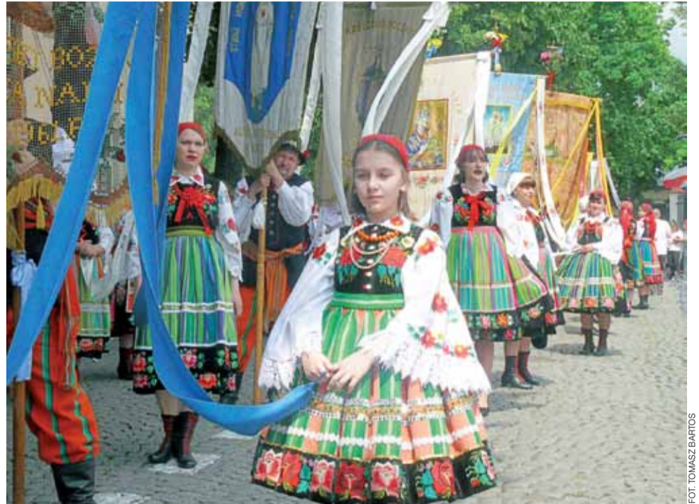
Przy chorągwiach, jak co roku, pięknie prezentowały się w strojach ludowych Księżta zarówno dziewczęta, jak i dojrzałe panie.