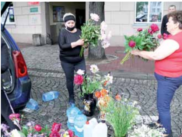
Panie ze Świerzyża II w czasie rozpakowywania bagażnika samochodu z kwiatami, które chwilę później stanęły na przygotowywanym przez tę miejscowość ołtarzu.