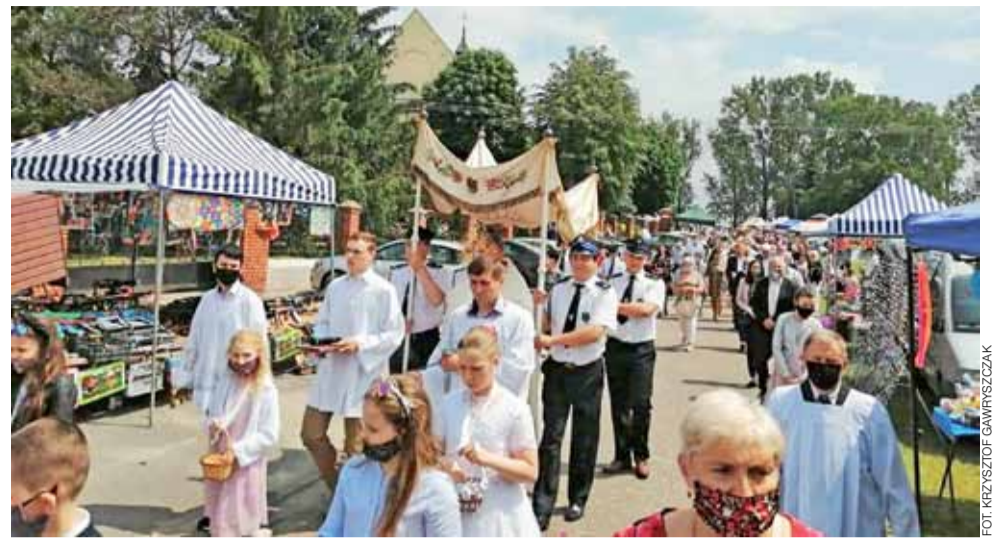
Boże Ciało obchodzone w Orłowie bardzo uroczysto. Przybyło mnóstwo ludzi, były odpustowe kramy.