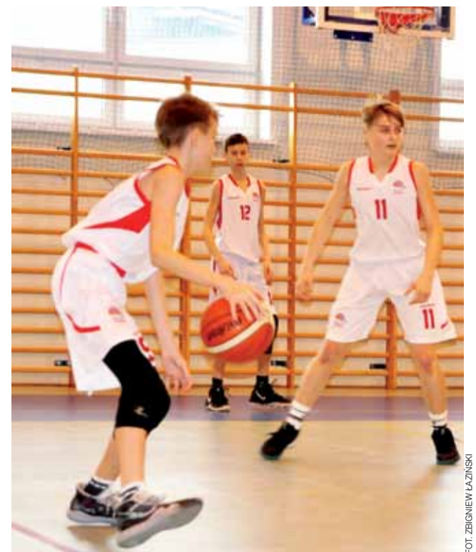
Kadeci Bzury Łowicz (U 16) zakończyli ligowy sezon i już myślą o kolejnym.