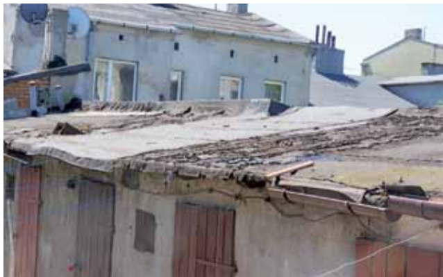
Komórki przy ul. 1 Maja 16 są w fatalnym stanie.