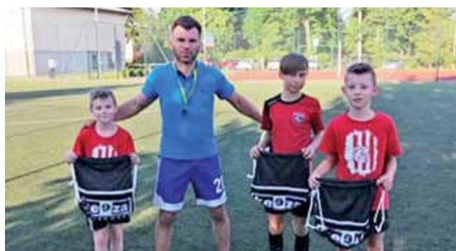
Trzej wyróżniający się zawodnicy w turnieju piłkarskim w Bedlnie w kategorii U9 – U13.

Dla młodzieżowych zespołów GKS Bedno była to bardzo sportowo i przyjemnie spędzona niedziela. Szkoleniowców GKS Bedno cieszy fakt, iż wszystkie dzieci i młodzież bardzo chętnie uczestniczą we wszystkich treningach piłkarskich. Info: GKS Bedno