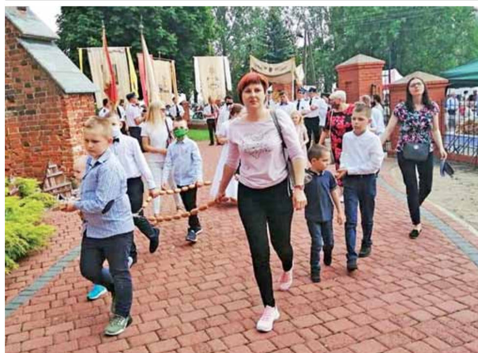
Mimo obaw, bo epidemia jeszcze nie wygaśa, na ulice naszych wsi i miast wyruszyły w Boże Ciało procesje eucharystyczne. Na zdjęciu: procesja w Orłowie w gminie Bedlno. O innych – na str. 2, 3 i 8.