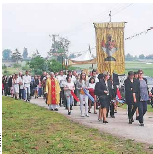
Procesje szły 100 m przed ołtarzem i odprowadzały 100 m za ołtarz.

Oporów | Ołtarze były w czterech stronach gminy