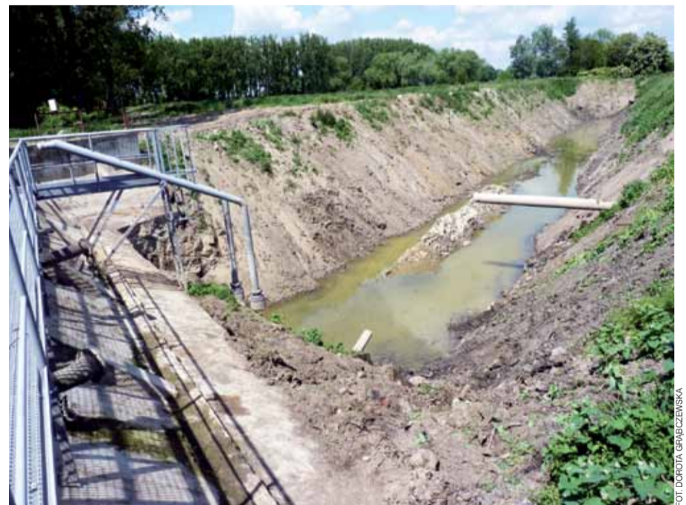
Kilka dni temu Cukrownia Dobrzelin wyczyściła z mułu zbiornik retencyjny, z którego czerpie wodę w czasie kampanii cukrowniczej.

To wszystko jest konieczne, by zminimalizować ryzyko zakażenia koronawirusem, a gdy ono wystąpi, by nie wyłączać całej produkcji wysyłając ludzi na kwarantannę. Nie możemy sobie pozwolić na zatrzymanie produkcji w czasie kampanii cukrowniczej, stąd te środki ostrożności, które wprowadzamy – dodaje dyrektor. dag