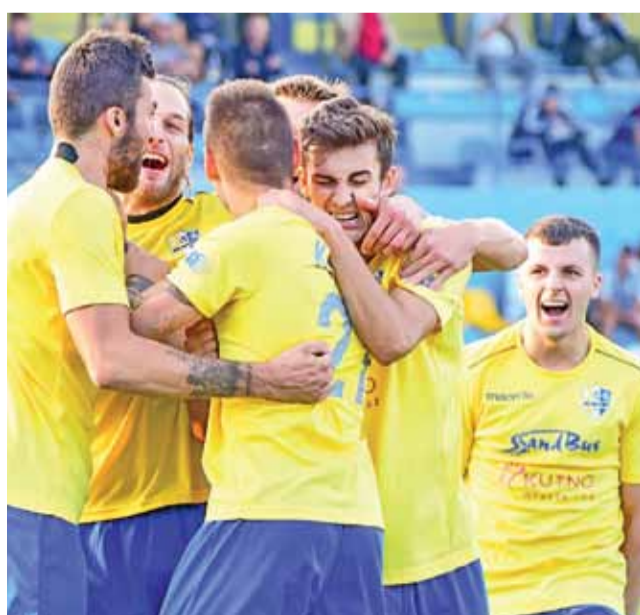
Drużyna KS Kutno wkrótce rozpocznie mecze kontrolne przed rozgrywkami nowego sezonu jako beniaminek w III lidze.