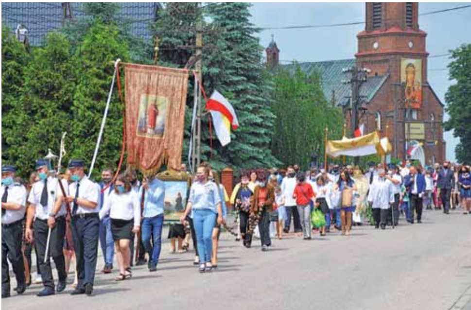
W Pacynie procesja w Boże Ciało poszła tradycyjną trasą. Przybyło bardzo wielu wiernych, większość osób była w maseczkach.

Procesja wędrowała w asyście policyjnego radiowozu. Dziewczynki sypały kwiatkami. W procesji uczestniczyli strażacy, młodzież i mieszkańcy oraz goście, którzy zawitali do gminy Pacyna. dag