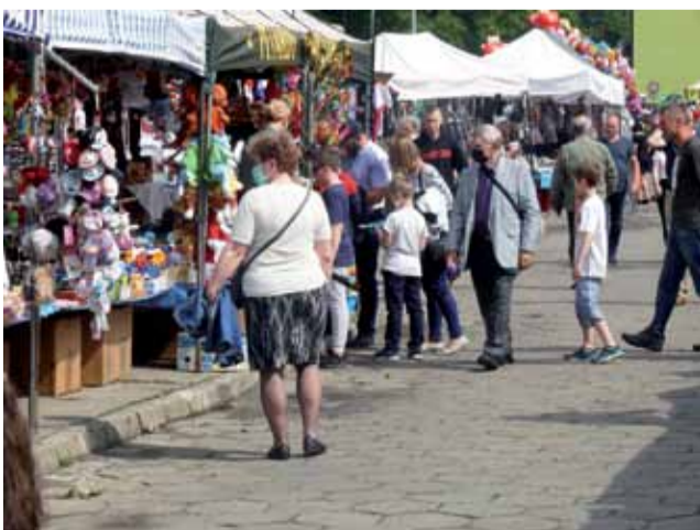
Bobiki w tym roku stanęły na miejskim targowisku. Z powodu pandemii handlujących było mniej niż w latach minionych, to jednak nie zniechęciło wielu osób do ich odwiedzenia jeszcze przed procesją.