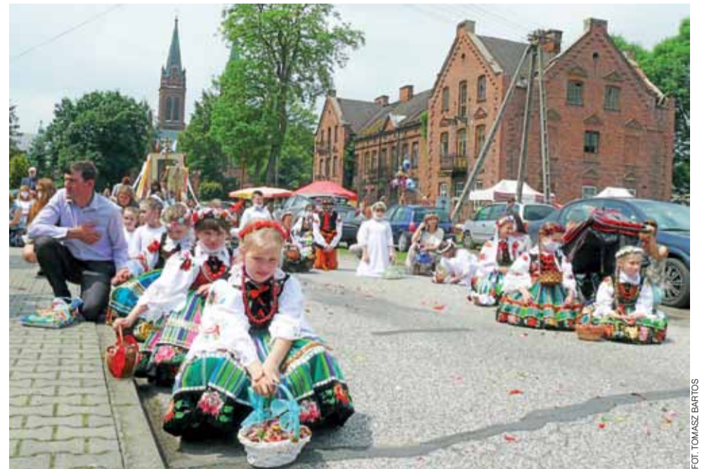
Po procesji Bożego Ciała w Złakowie Kościelnym nie było widać szczególnych ograniczeń związanych z koronawirusem, poza tym, że większość uczestników miała zasłonięte twarze i było ich wyraźnie mniej. Procesja przeszła tradycyjnym szlakiem, który zgodnie z tradycją został wyłożony przez parafian tatarakiem, były też bielanki i dziewczynki w ludowych strojach, syjące płatkami kwiatów. Dziewczęta i mężczyźni niosący chorągwie i feretrony (przenośna figura lub obraz w zdobionych ramach) szli w ludowych strojach, co jest co roku atrakcją przyciągającą turystów z okolicznych miast. Tych w tym roku było mniej, ale jednak byli. tb