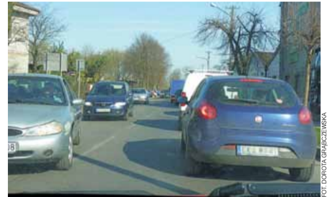
Wielokrotnie w dni targowe na wysokości wjazdu na targowicę tworzą się korki. Ruch utrudnia fakt, że po obu stronach jezdni są zaparkowane samochody, co ogranicza przepustowość ulicy.

Tymczasem niektórzy mieszkańcy Żychlina narzekają nie tylko na brak miejsc parkingowych, ale też na niezrealizowane obietnice burmistrza, że po sprzedaży fragmentu targowicy Union Chocolate, za pieniądze ze sprzedaży