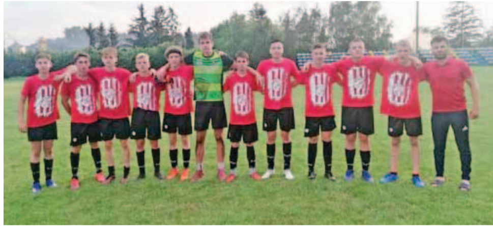
Drużyna juniorów GKS Bedno biorąca udział w obozie przygotowawczym w Choceniu.

Uczestnicy wyjazdu odbyli szereg treningów na siłowni, hali sportowej oraz boisku piłkarskim. Znakomita pogoda sprzyjała pracy dzięki czemu wszystkie zaplanowane zajęcia odbyły się bez przeszkód. W trakcie pobytu zespół rozegrał również dwa mecze sparingowe z drużynami z ligi okręgowej województwa kujawsko – pomorskiego. Oba zakończyły się porażką, jednak ze swoich występów zespół z Bedna może być zadowolony – biorąc pod uwagę trudny trening oraz brak kilku ważnych zawodników.