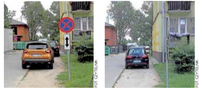
Znak zakazu zatrzymywania widoczny i nie.

Takie obrócenie znaku traktowane jest w prawie tak samo jak zniszczenie go. Jest to wykroczenie zagrożone karą aresztu, ogra-