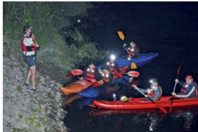
Taki spływ odbywał się dotychczas tylko dla członków Klubu Turystki Kajakowej „Tratwa”, zaś w tym roku będzie otwarty dla wszystkich.

– Do tej pory braliśmy udział w spływach nocnych tylko w ramach naszego klubu i odnieśliśmy bardzo pozytywne wrażenia. Ludzie myślą, że nocą przyroda śpi, a tak na prawdę dolina przeżywa wtedy drugie życie. Chcielibyśmy podzielić się tymi doświadczeniami z ludźmi spoza klubu. – mówi