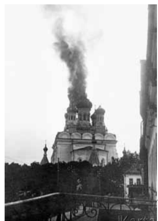
Płonąca cerkiew. Grodno, 1920.

19 lipca wkroczyli bolszewicy do Grodna. [...] Czerezwycząjka przez cały czas funkcjonowała bardzo energicznie. Liczba osób rozstrzelanych dotychczas