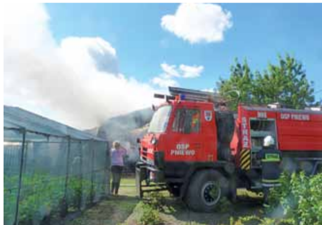
Wczoraj w Grabowie płonął blaszany magazyn gospodarstwa ogrodniczego. W akcji strażacy z OSP Pniewo.

Ze szczytkowych informacji wynikało, że pali się jakiś maga-