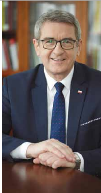
WOJCIECH MURDZEK, MINISTER NAUKI I SZKOLNICTWA WYŻSZEGO

Niezbędnym elementem w osiągnięciu efektów kształcenia są praktyki zawodowe. Dlatego też w Konstytucji dla Nauki wprowadziliśmy zapis o obowiązkowych sześciomiesięcznych praktykach zawodowych na studiach pierwszego stopnia i jednolitych studiach magisterskich. Jednocześnie, dzięki projektowi „Program praktyk zawodowych w PWSZ” uczelnie otrzymały wsparcie we wdrażaniu zapisów ustawy. Celem tego projektu było wypracowanie, testowanie i wdrożenie jednolitego systemu praktyk zawodowych. Opracowano Regulamin i instrukcje pilotażowych praktyk zawodowych w projekcie, który stanowił zbiór wymagań dotyczących programu praktyk. Projekt