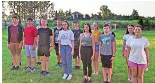
Na pierwsze zajęcia Młodzieżowej Drużyny Pożarniczej w Sleszynie przyszło kilkanaście młodych osób w wieku 12-18 lat.

Oczywiście nie mogło zabraknąć zajęć z musztry, była nauka stopni strażackich OSP i PSP. Młodych adeptów pożarnictwa uczono prawidłowego składania meldunków, wykonywania zwrotów i maszerowania. Na koniec była wspólna zabawa. Członków MDP podzielono na dwie grupy, każda w parach. Para miała zadanie do wykonania. Najpierw jedna osoba z pary miała zawiązać