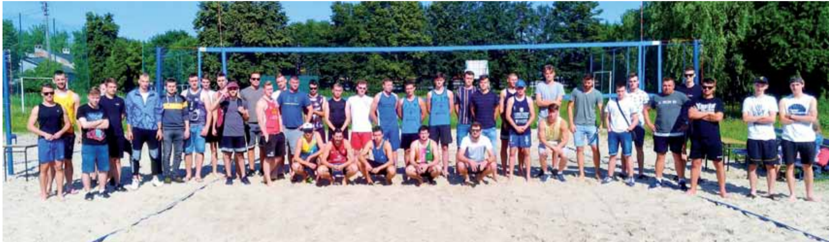
Aż 22 pary zagrały o Puchar Łowicza.

Piłka siatkowa | I Turniej w Siatkówce Plażowej o Puchar Dyrektora OSiR w Łowiczu