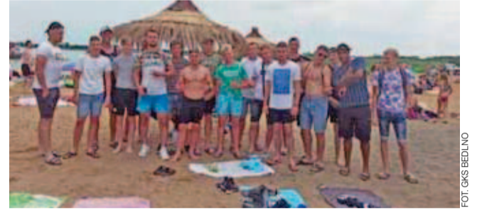
Był również czas na relaks nad pobliskim jeziorem.

Piłka siatkowa | Wakacje z Volley Team Żychlin