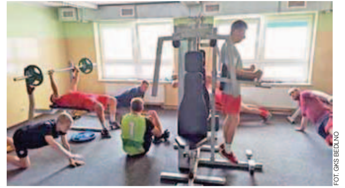
Piłkarze GKS podczas obozu korzystali z siłowni.