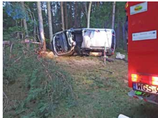
Po zniszczeniach samochodu widać, że kierowca opla jechał bardzo szybko. Teraz w stanie ciężkim jest w szpitalu.

– Dyżurny KPP w Gostyninie został powiadomiony o wypadku o godz. 3.45 w Budach Kaleńskich – mówi mł. asp. Żaneta Kołodziejaska, rzecznik KPP w Gostyninie. – Okazało się, że 23-letni mężczyzna kierujący Oplem jadąc w stronę Gostynina z nieustalonych przyczyn zjechał z drogi uderzając po drodze w trzy drzewa. Policjanci ustalają przyczyny wypadku.