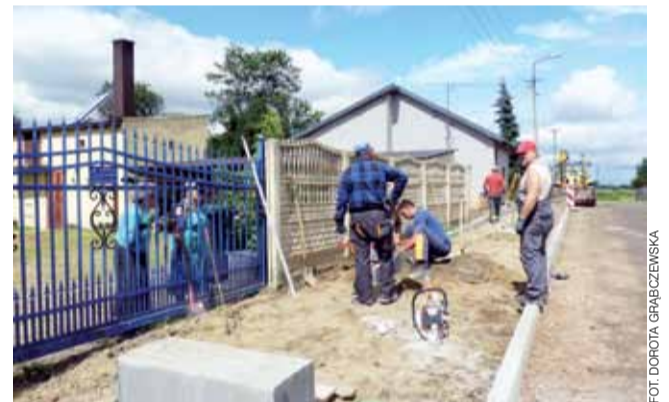
Jedna ekipa z PRD Kutno robi chodnik w ulicy Nowej. Ma być tak pochylony, by woda opadowa nie płynęła na podwórko mieszkańców.

Mieszkańcy od kilku lat czekali i pisali petycje do burmistrza o zrobienie asfaltu w ulicy Dolnej, która znajduje się w terenie miejskim. Najpierw na drodze ułożono rudy tłuczeń, który po deszczu