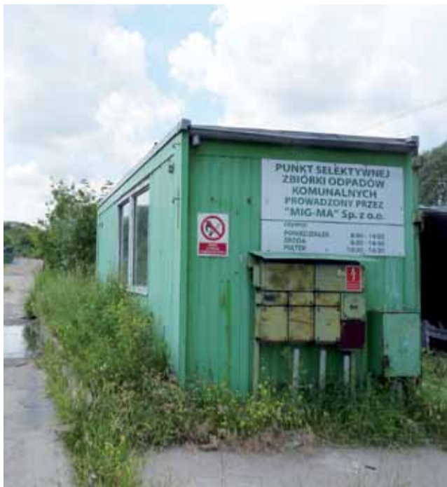
Po dwóch tygodniach, od 15 lipca uruchomiono Punkt Selektywnej Zbiórki w Żychlinie. Niestety, wciąż wisi stara tablica informacyjna, która wprowadza mieszkańców w błąd.