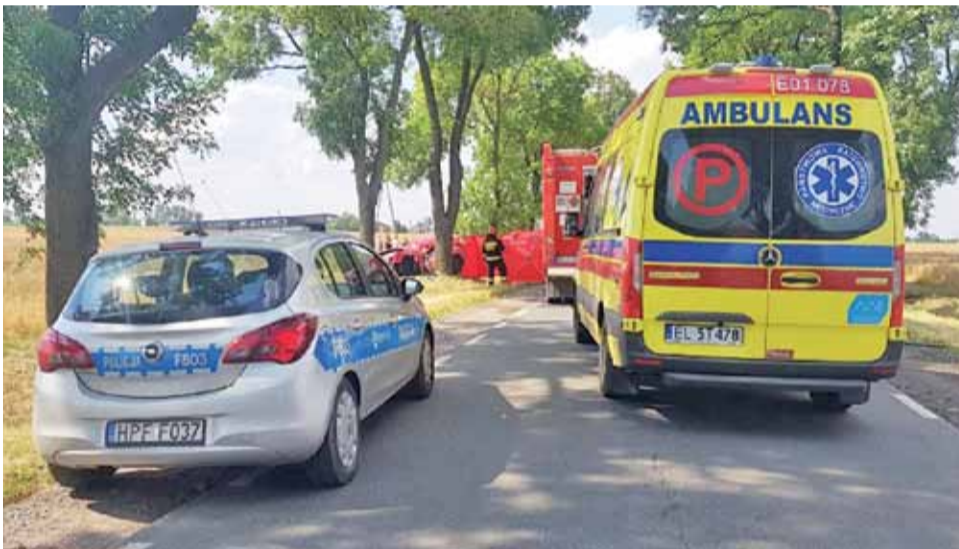
Miejsce tragedii. Nawet na tym zdjęciu widać, jak wąska jest droga i jak niskie pobocze.

Kutnowscy policjanci pod nadzorem Prokuratury Rejonowej w Kutnie wyjaśniają okoliczności zdarzenia.