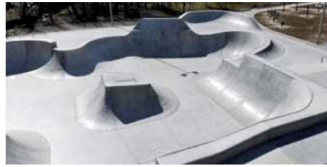
Żychlińska młodzież na facebooku podpisuje petycję skierowaną do władarzy Żychlina o budowę skateparku dla młodych żychlinian.

Wnioskodawcy mają nadzieję, że ich oddolna propozycja będzie skutkować ujęciem inwestycji w budżecie na 2021 rok.