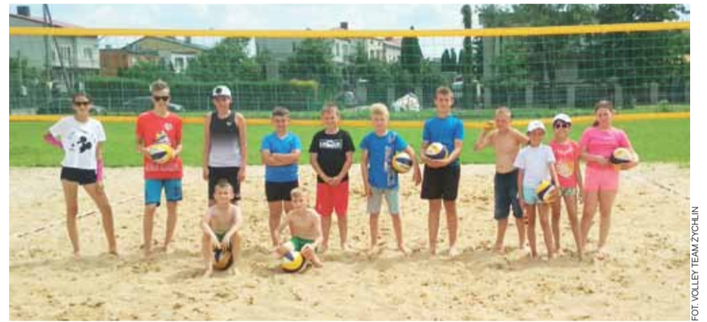
Uczestnicy zajęć rekreacyjno-sportowych „Wakacje z Volley Team Żychlin”.

Żychlin ma zapewnioną dobrą zabawę, w trakcie zajęć organizator zapewnia uczestnikom wodę