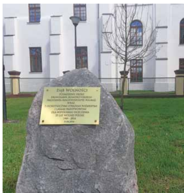
Przed Dębem Wolności znajduje się głaz z okolicznościową tablicą.

19 czerwca 2014 roku przy Zespole Szkół Ponadpodstawowych nr 1 w Łowiczu posadzony został dąb, który miał uczcić 25 lat wolnej Polski po okresie komunizmu – 4 czerwca 1989 roku. Z okazji rocznicy pierwszych niemal wolnych wyborów w powojennej Polsce, do Łowicza przyjechał prezydent Bronisław Komorowski i wraz z pracownikami Lasów Państwowych oraz Ochotniczych Straży Pożarnych posadził dąb, nazwany Dębem Wolności. Ten pierwszy dąb jednak usechł, ten sam los spotkał drugi.