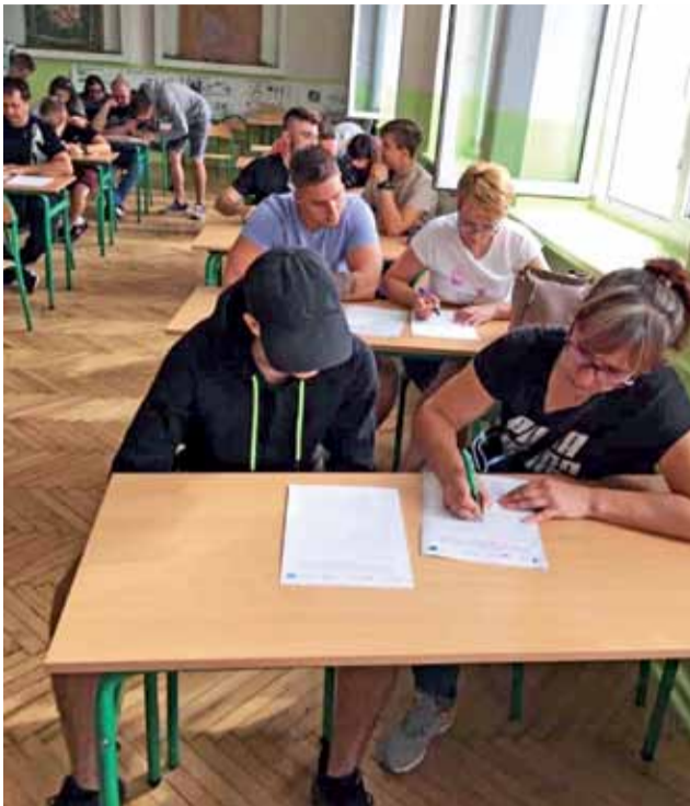
Opiekunowie uczniów, którzy 2 i 8 sierpnia wyjadą na praktyki zagraniczne do Hiszpanii, podpisali w szkole stosowne zgody.

Zmiana terminu wyjazdu stażowego dotyczy natomiast dwóch grup uczniów z ZS, które miały wyjechać na staż w czerwcu. W związku z pandemią wyjazd był wstrzymany. Teraz dwie gru-