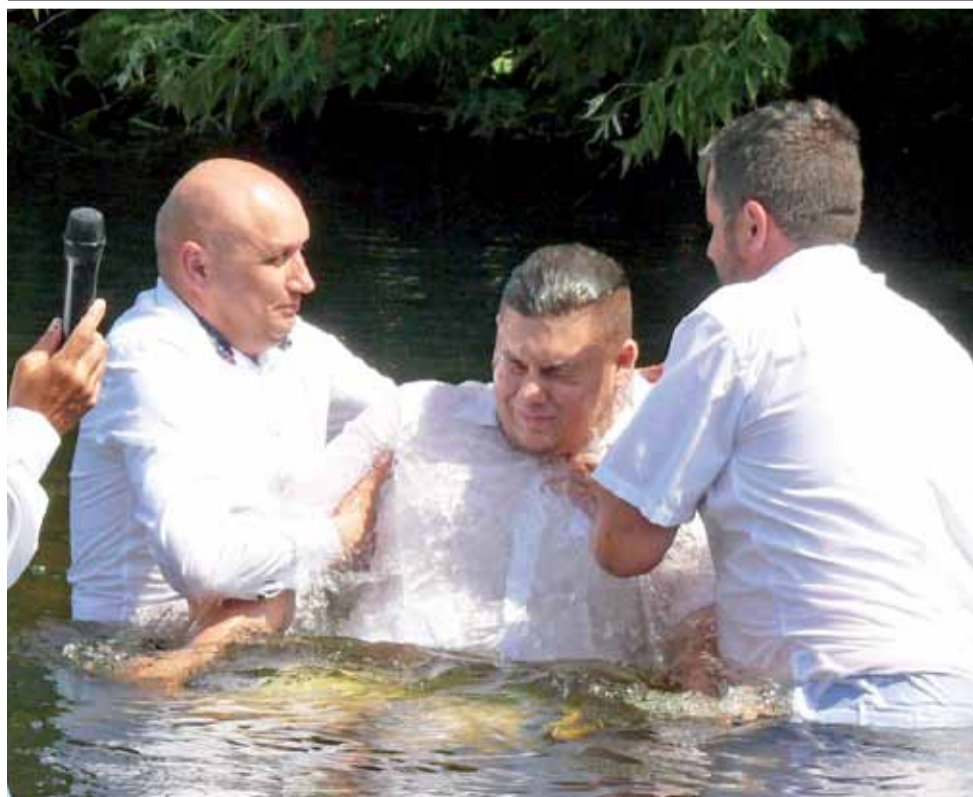
W nurtach Bzury udzielono w minioną niedzielę, 19 lipca, chrztu kilku dorosłym osobom. Dlaczego tam? Kto udzielał? – czytaj na str. 9.