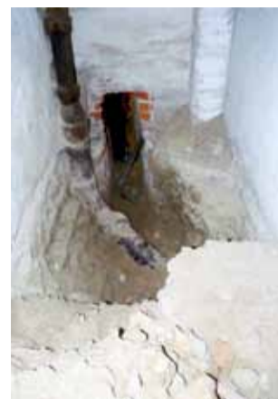
Od 2 tygodni trwa poszukiwanie awarii kanalizacji ściekowej w bloku Narutowicza 85a.

Póki co, pracownicy wykonują trudną pracę. Góry cegieł i betonu wiadrami musieli wynieść na zewnątrz z rozbitej posadzki. Teraz wynoszą ziemię z wykopu na głębokości kilkudziesięciu centymetrów. Warto też sprawdzić drożność ostatniego odcinka kanalizacji ściekowej.