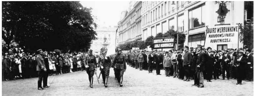
Warszawa, plac Saski, 18 lipca 1920. Ochotnicy przed wyruszeniem na front.

Dzień dzisiejszy poświęcony był Armii Ochotniczej. Pochód jej, złożony przeważnie z młodziutkich chłopców, wywoływał okrzyki entuzjasmu. Wozy sprzedające pożyczkę państwową starały się ten entuzjazm w inny znów sposób zdyskontować. Młodzieńcom zdającym, a cywilnym robiono awanie [znieważano] na ulicach. Podniecenie było ogromne. Kochać można w tej Warszawie ten szczerzy, szeroki, głęboko sięgający prąd narodowy. Ma się wrażenie, że wśród tych ludzi i przy ich pomocy można wszelkie odśrodkowe dążności stłumić i zdusić.