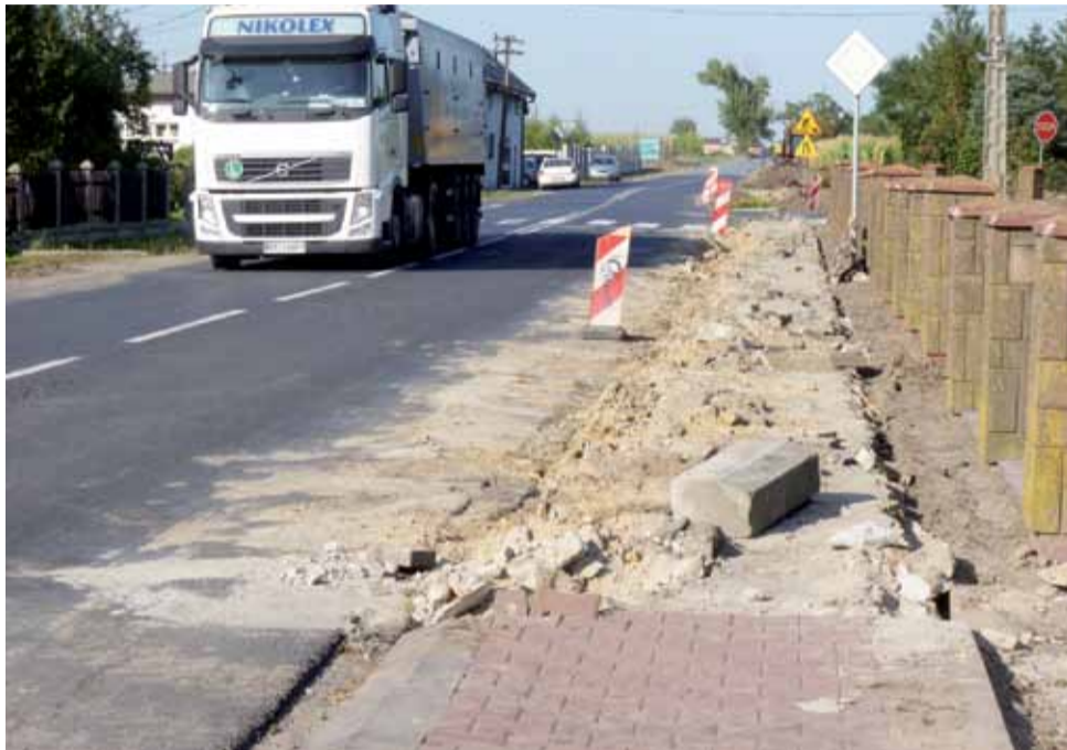
Firma z Warszawy rozpoczęła przebudowę drogi w Pacynie wraz z budową ronda. Na razie zdemontowano część istniejących chodników.

Firma już tydzień wcześniej zwoziła materiały budowlane i ścigała sprzęt potrzebny do budowy. Już wykarczowano kolidujące z inwestycją drzewa, zdemontowano część istniejących chodników. Kostkę ułożono na przyzmy.