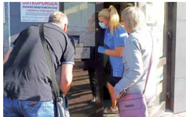
Pacjenci narzekają, że przychodnia Almamed jest zamknięta jak twierdza, a ludzie czekają przed przychodnią w długich kolejkach.

Osobiście też doświadczyliśmy jak działają poradnie specjalistyczne w Kutnowskim Szpitalu Samorządowym. Na wejściu pracownik szpitala mierzy każdemu