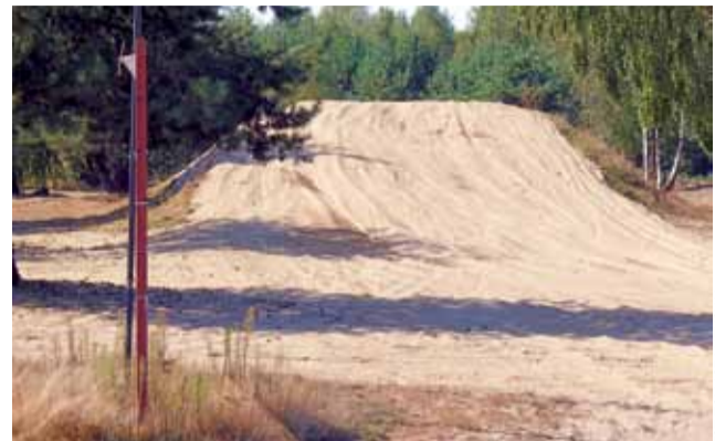
Czy usypanie takiego wzniesienia wymaga pozwolenia na budowę? Okazuje się, że orzeczenia poszczególnych organów mogą być w tej kwestii różne.

Żeby jednak zachować proporcje, musimy nadmienić, że pytaliśmy też o działanie toru przypadkowo spotkanych mieszkańców innych miejscowości w pobliżu toru i zdecydowana większość odpowiadała, że ten im nie przeszkadza. Takie odpowiedzi słyszeliśmy w Polesiu czy w samych Serokach. – To prawda, że ich sly-