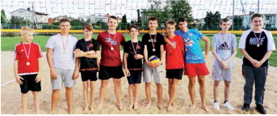
Na boisku do siatkówki plażowej na stadionie miejskim w Żychlinie rozegrano po raz dziewiąty Turniej Siatkówki Plażowej Chłopców klas VI-VIII, którego organizatorem było Stowarzyszenie Przyjaciele Dwójki.

W czwartek 17 września odbył się IX Turniej Siatkówki Plażowej w kategorii chłopców klas VI-VIII. Do zawodów zgłosiło się pięć zespołów chłopców, rozgrywki prowadzone były systemem każdy z każdym do jednego