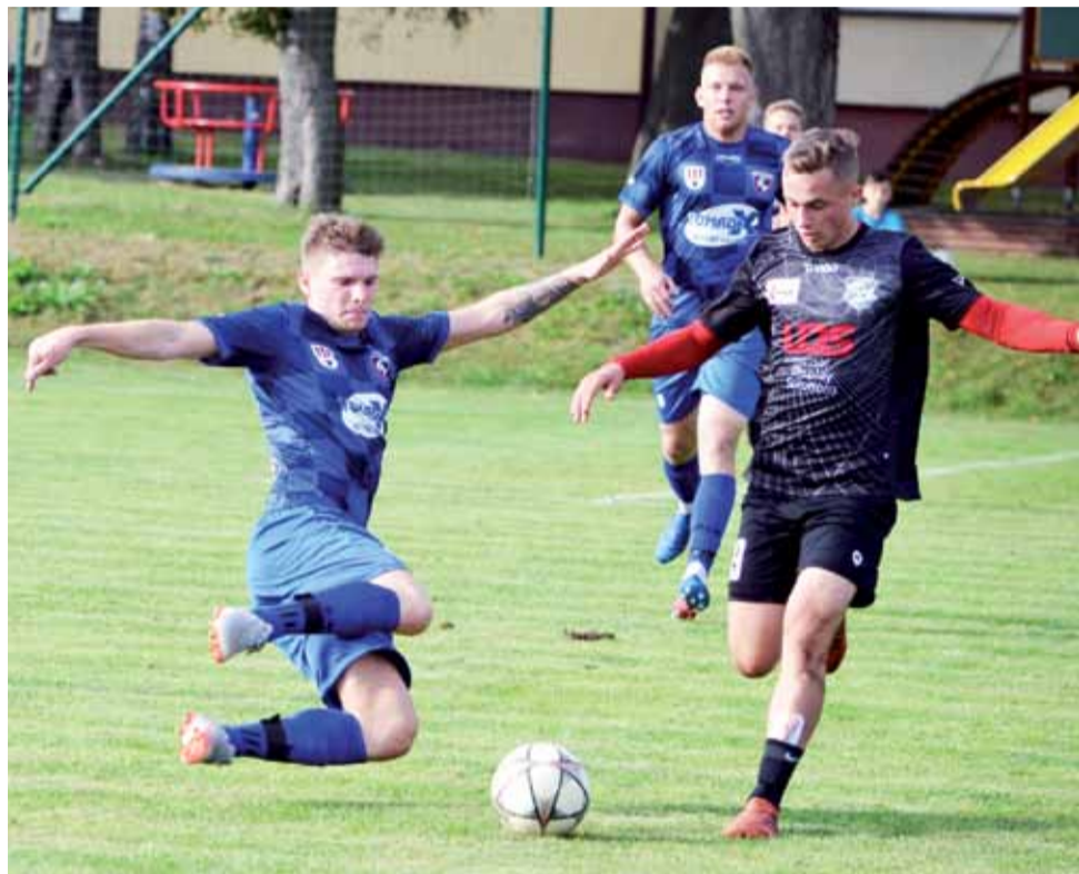
Piłkarze GKS Bedno w meczu 9. kolejki skierniewickiej ligi okręgowej zagrali na wyjeździe przeciwko Manchatan Nowy Kawęczyn. Nie udało się pokonać gospodarzy i GKS Bedno musiał przelknąć rezultat 3:2, nie zachwiało to ich pozycji lidera.

W końcowej części spotkania, w 78. minucie, zespół Manchatan strzelił swoją trzecią bramkę, dając im zwycięstwo w sobotnim