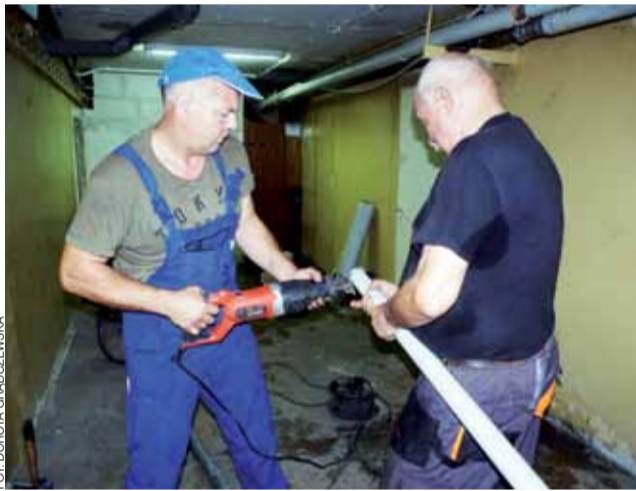
Pracownicy firmy Hydro-Tech z Żychlina szybko uporali się 18 września z awarią wodociągu w piwnicy bloku Konopnickiej 5a. Odcinek starej skorodowanej rury wymieniono na nowy i woda znów popłynęła. Utrudnienia trwały ok. 2 godzin. dag