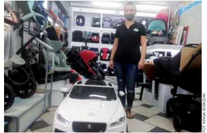
Sklep Peps przy Alejach Henryka Sienkiewicza ma w swojej ofercie sportowe auta dla dzieci

Według innego handlowca, ze Stylu Dziecka, fenomen takiego