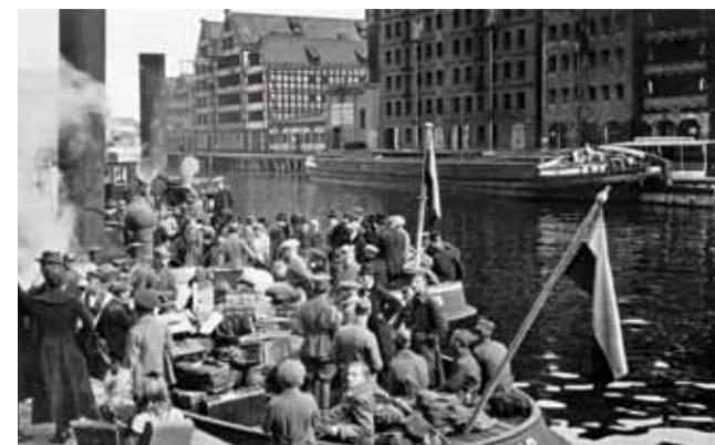
Gdańsk, wrzesień 1920. Delegacja polska wyruszająca na negocjacje pokojowe z bolszewikami.