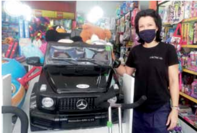
W sklepie Noel w Łowiczu można kupić Mercedesa dla małego rajdowca.

Najczęściej dopuszczalna maksymalna waga dziecka korzystającego z małego pojazdu to 25 – 30 kg, ale zdarzają się też wyjątkowe egzemplarze, np. traktor, którego maksymalne obciążenie to 60 kg. Nie ma więc zasady co do tego, jak duże dzieci powinny jeździć w samochodach. Jak przyznała sprzedawczyni ze sklepu Styl Dziecka w Łowiczu, problemową kwestią dla dzieci w starszym wieku może być ich wzrost. Nie da się ukryć, że jeżdżenie z kolanami ponad kierownicą może być dla malucha niewygodne. Ważne jest jednak to, żeby dziecko