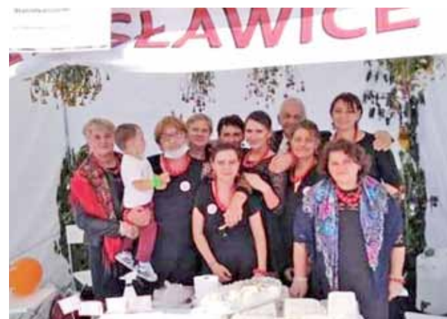
Koło Gospodyń Wiejskich ze Stanisławic prezentowało się podczas Dożynek Wojewódzkich w Uniejowie.

Na przełomie września i października dyrektor Pucek idzie na urlop. Od 13 października GOK nie ma dyrektora, a władze gminy znów mają problem, by znaleźć odpowiednią osobę na to stanowisko. dag