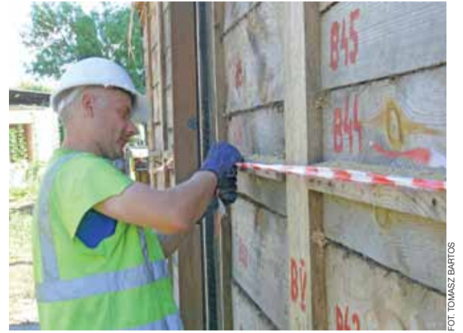
Drewniany budynek przy ul. Bolimowskiej jest w trakcie rozbioru, o niebezpieczeństwie ostrzega białoczerwona taśma.

Budynek przed rozebraniem został poddany inwentaryzacji, elementy konstrukcji parteru zostały ponumerowane i skatalogowane, aby w skansenie odtworzyć go zgodnie z pierwotnym. Muzeum ma konkretne plany związane z budynkiem. – Po odtworzeniu chcielibyśmy, aby mieściła się w nim duża sala edukacyjna – daje on takie możliwości i z tego powodu zdecydowaliśmy się na jego przeniesienie. Ponadto w budynku znalazłoby się ekspozycja związana z rzemiosłem. Z eks-