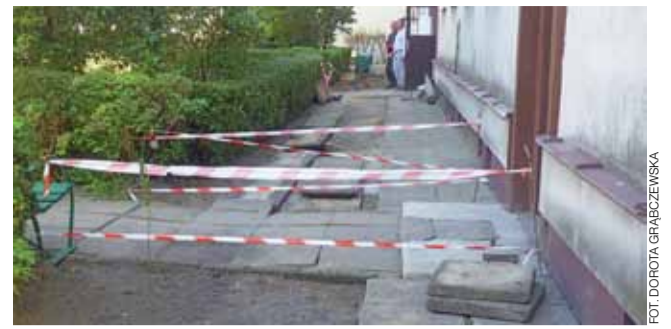
Przebudowa odprowadzenia wody opadowej z dachu bloku Okoniewskiego 3. Czy zastosowane rozwiązanie będzie skuteczne?

Jest zatem szansa, że w tym roku gmina zrobi aż 6 km dróg gminnych. – Do zakończenia inwestycji drogowych zapoczątkowanych w 2012 roku, brakuje nam jeszcze ok. 9 km dróg – przyznaje wójt. – Faktycznie dróg nam przybywa, gdyż okazuje się, że do wykonania są jakieś przyczółki, łączniki. Jestem dobrej myśli, że za rok uda się nam zakończyć drogowe inwestycje – mówi. dag