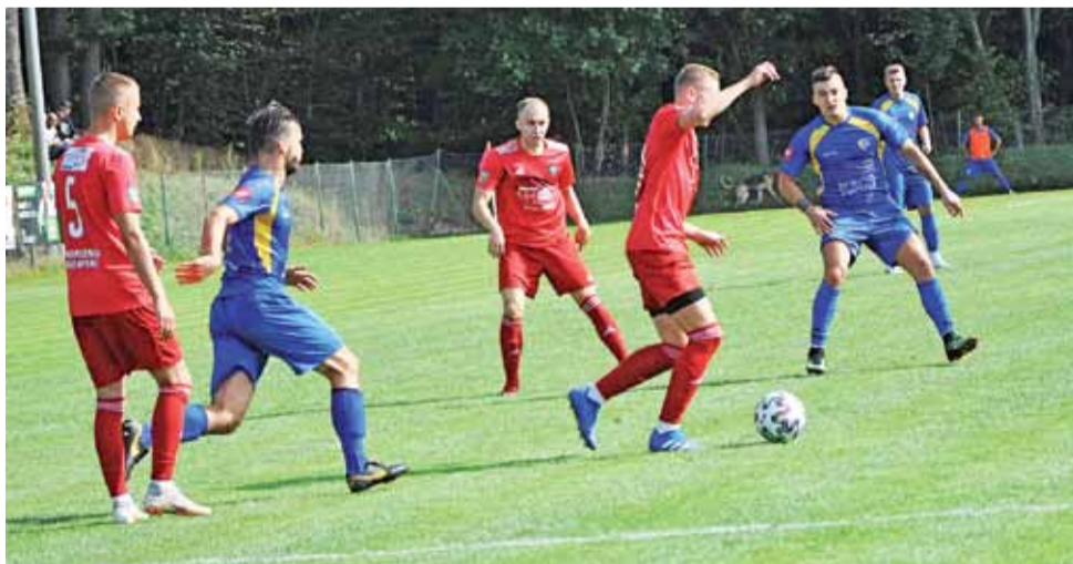
Zespół KS Kutno przegrał 2:0 wyjazdowe sobotnie spotkanie 7. kolejki trzeciej ligi w starciu z GKS Wikielec.