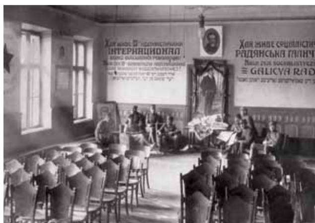
Tarnopol, wrzesień 1920. Polscy żołnierze po zdobyciu miasta w świetlicy wypełnionej sowiecką propagandą.

Możemy się dziś pochwalić zdobyciem Równego, a za godzinę pewnie i Dubna. Dwie twierdze na jeden dzień to dosyć. Niezmodernizowanym pościgiem jazdy, piechoty, samochodów pancernych i lotników zadaliśmy takiego bobu bolszewikom, że na jakiś czas będą mieli chyba na naszym froncie dosyć wojny zaczepnej. Oficer i żołnierz bije się teraz, myśląc, że jednak wyznacza granice państwa polskiego. Bodajby nas ta wiara nie zawiodła i dyplomaci umieli nasze zwycięstwo wykończyć. [...]