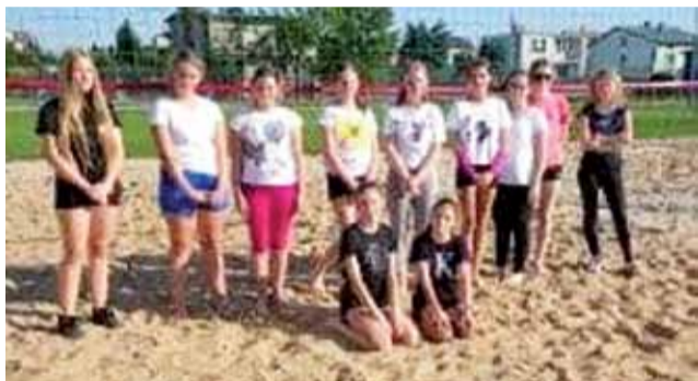
Zespoły dziewcząt biorące udział we wtorkowym Turnieju Siatkówki Plażowej Dziewcząt klas VI-VIII w Żychlinie.