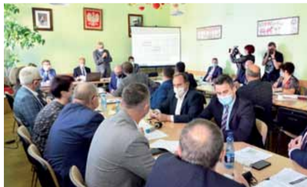
Zgromadzenie ZM Bzura jednogłośnie wycofało się z planów sprzedaży inwestycji w Piaskach Bankowych. Czy uda się ją zrealizować?

Zmianę decyzji spowodowała presja opinii publicznej. Wiele osób wyrażało niezadowolenie, że Zakład Zagospodarowania Odpadów, który miał być samorządowy, miałby zostać sprzedany firmie prywatnej.