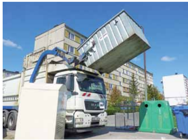
Od 1 października wchodzi w życie wysoka podwyżka opłat za śmieci.

Pisma do spółdzielni Urząd Gminy w Żychlinie przesłał do spółdzielni mieszkaniowych pisma, w których informuje o wzroście opłat śmieciowych, które do kasy miasta wnoszą spółdzielnie. Lokatorzy płać za od-