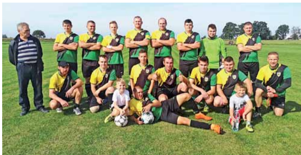
Zespół Olimpii Oporów zanotował wygraną 3:2 w starciu 6. kolejki skierniewickiej B klasy przeciwko drużynie Macovii II Maków.

Następna, 7. kolejka Skierniewickiej Klasy B odbędzie się w niedzielę 27 września. Piłkarze Olimpii Oporów zmierzą się