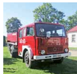
Nowy nabytek jednostki OSP w Sobocie czyli Jelcz 004 GCBA.

Nowo zakupiony wóz strażacy znaleźli w ogłoszeniu zamiesz-