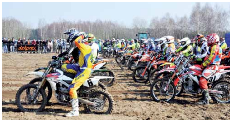
Maszyna przy maszynie – ale taka frekwencja w Serokach jest tylko na oficjalnych zawodach raz do roku. Zdjęcie wykonane w marcu 2018 roku.

Część mieszkańców Parmy (gmina Łowicz) znów zwraca uwagę na powracający problem hałasu dochodzącego do ich domów z toru motocrossowego w pobliskich Serokach (gmina Łyszkowice). Na pewno trudno będzie pogodzić interes tych, którzy lubią wypoczynek w ciszy i tych, którzy chcą poszaleć na torze, choć padają też głosy kompromisowe.