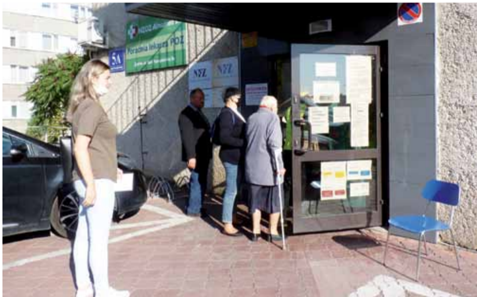
Pacjenci Almamedu narzekają, że przed przychodnią brak nawet ławeczki dla chorych ludzi. To krzeselko wystawiono dopiero na prośbę pacjentki.

Dodzwonienie się do przychodni graniczy z cudem. Dzwoniłem cały dzień, a gdy wreszcie się udało, to usłyszałem, że limit 40 przyjęć został wyczerpany.