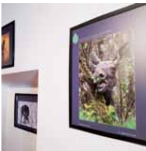
Fotografie autorstwa Magdaleny Sarat, będące częścią wystawy czasowej pt. „Opowieści z lasu”, która w łowickim muzeum gościć będzie do końca listopada.

– Co do autorów, to są to najwyższej klasy zawodowcy – dodał. – „Opowieść o lesie”, to dla fotografa przyrody powinna być