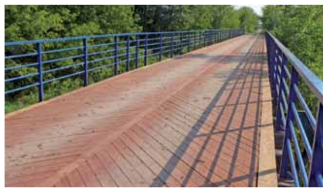
Most w Patokach ma nową drewnianą nawierzchnię.

Można już bez przeszkód jeździć mostem na Bzurze pomiędzy Patokami a Sierzchowem. Firma Danetpil z Głowna na zlecenie Urzędu Gminy Nieborów za 115 tys. zł zakończyła kompleksową wymianę drewnianej poszycia. W czasie prac okazało się, że deski, z którego było ono zbudowane, były w bardzo złym stanie, część rozpadła się w czasie demontażu – choć most został oddany do użytku w 2011 roku, a więc stosunkowo niedawno.