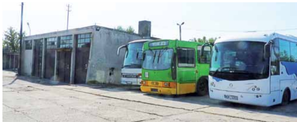
Autobusy mają być wycenione i sprzedane, a magazyny i warsztaty zamienione na magazyn kryzysowy.

Jelcz, który jest zachowany w największym stopniu w oryginalnych częściach z lat 80', powinien znaleźć nabywcę wśród fanów motoryzacji. Być może drugi, po kilku zmianach części, też znajdzie takiego nabywcę.