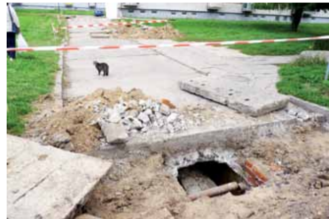
Kompleksowy remont magistrali ciepłowniczej na osiedlu Traugutta zostanie wykonany w 2021 roku. Teraz pracownicy spółdzielni usuwali awarię ciepłociągu.

Prezes spółdzielni nie kryje, że zależy mu, aby wybrać wykonawcę inwestycji w tym roku, z za-