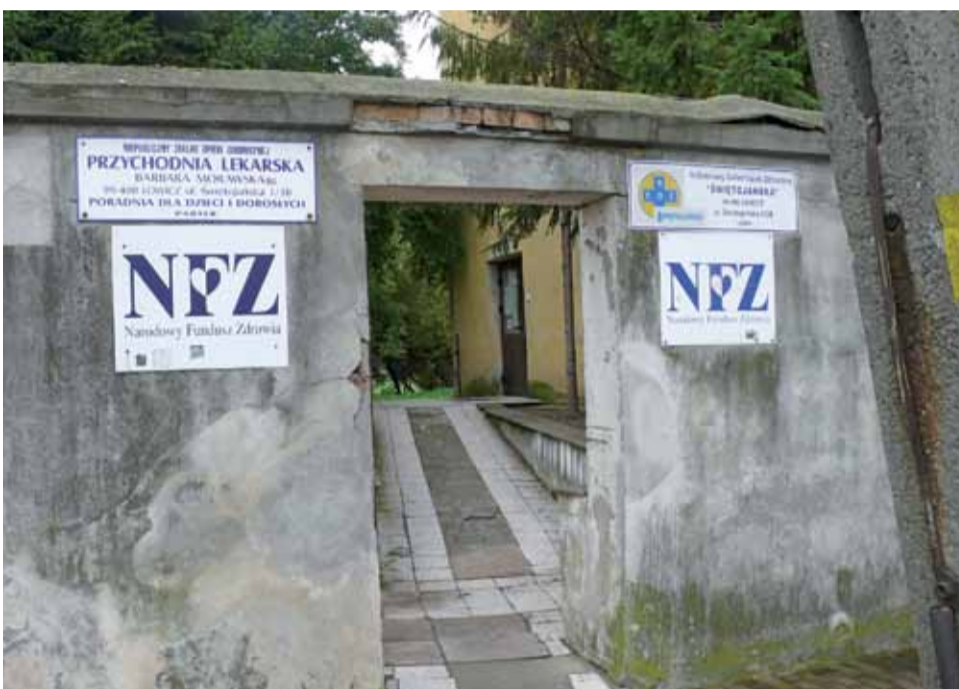
Do lekarzy rodzinnych przyjmujących przy ul. Świętojańskiej nietatwo jest się dodzwonić. Ale nie jest to problem w Łowiczu odosobniony.

Pacjent ma prawo do wizyty osobistej w gabinecie lekarza rodzinnego.