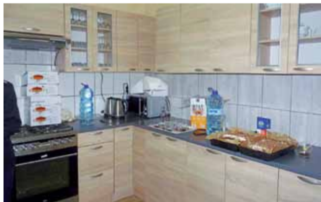
Kuchnia w świetlicy wiejskiej w Wojszycach Parceli wyposażona w meble i niezbędne sprzęty AGD.

2 lata czekała na założenie, ale prace wykonano w 2017 roku. Później zrobiono szambo, do którego odprowadzane są ścieki. Cały budynek docieplono 5 cm warstwą styropianu. Zmieniono miejsce wejścia do świetlicy. Teraz jest ono od strony boiska. Wyburzono jedną ściankę działową, dzięki czemu udało się zrobić połączone dwa pomieszczenia. Wyremontowano kuchnię i sanitariaty. Na podłodze ułożono płytki gresowe przypominające panele.