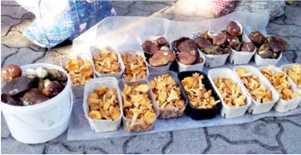
Grzyby na łowickim targowisku można było kupić w ostatnią sobotę od kilkunastu osób. Każdy ze sprzedawców miał ich co najmniej kilka pudełek.

Na dużych targowiskach, gdzie odbywa się na większą skalę niż w Łowiczu handel grzybami, ad-