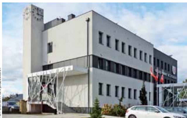
Administracja ZGM od 1 października znajduje się w budynku urzędu miejskiego, w części zajmowanej przez Samorządowy Zakład Budżetowy.

28.10.2020 r. od godz. 8.00 – 15.00 – linia energetyczna wzdłuż drogi DW 583 – II etap