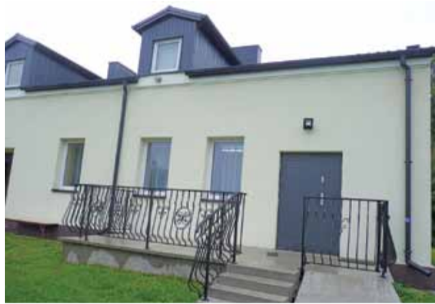
Budynek świetlicy wiejskiej w Wojszycach Parceli jest docieplony. Wejście zrobiono od strony boiska. Jest taras i eleganckie barierki.

Prace zaczęto kilka lat temu, jeszcze za poprzedniego wójta. Rozpoczęto je od naprawy dachu. Wprawdzie blacha zakupiona ze środków funduszu sołectkiego