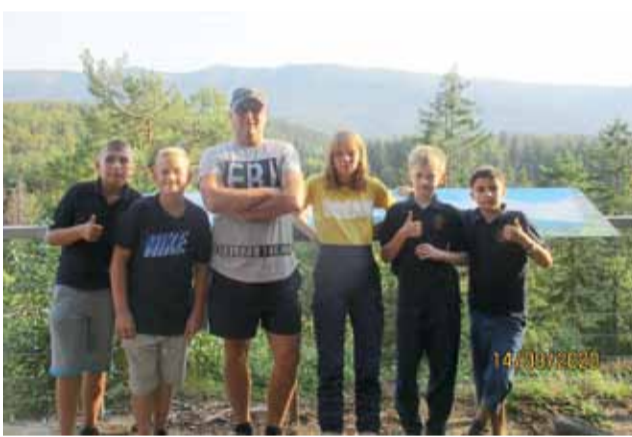
Ekipa Szkoły Pijarskiej podczas wycieczki pieszej w Szklarskiej Porębie.