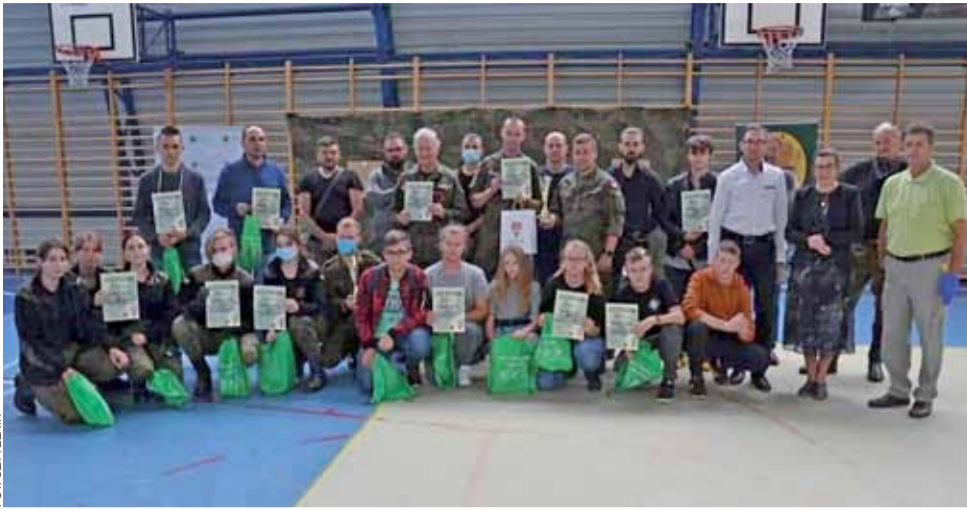
W zawodach strzeleckich w Bedlnie z okazji Bitwy nad Bzurą wzięło udział 30 zawodników i zawodniczek z regionu.