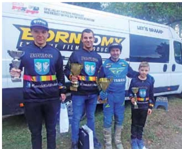
Łowiczanie świetnie zaprezentowali się na zawodach w Kowali.

Ostania runda Mistrzostw Strefy Centralnej zaplanowana jest na niedzielę 11 października na torze w Serokach. Warto przybyć na taką imprezę. Będzie głośno, będzie wiele emocji i ciekawych wyścigów. Wyścigi zaczynają się od godz. 11.00 i będą trwać aż do 16.00.