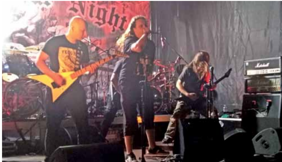
Odi Profanum Vulgus jako wystąpił pierwszy.

Odi Profanum Vulgus, który przyjechał do Łowicza z południowo-wschodniej Polski zagrał jako pierwszy i od razu zaproponował mocną dawkę black / death metalu z progresywnym podej-