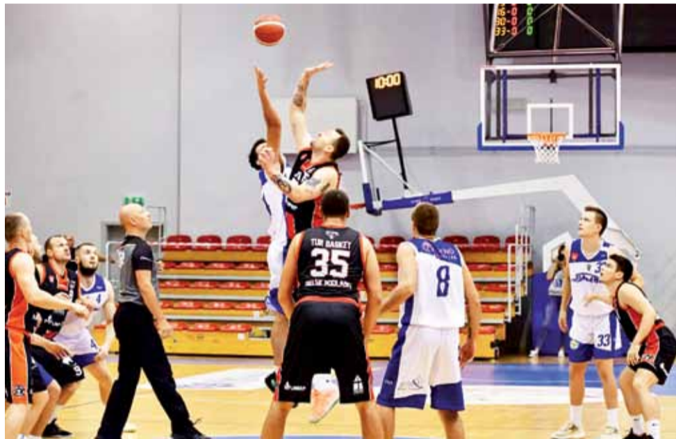
Koszykarska drużyna KS Kutno podejmowała w hali „Dziwiątki” ekipę KKS Tur Bielsk Podlaski. Niestety przeciwnik okazał się lepszy, kutnianie przegrali 75:81.