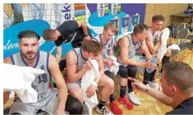
KS Księżak Łowicz potwierdził swoją siłę i już melduje się w górnej części tabeli Suzuki I ligi.