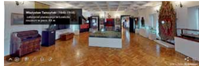
Sala na piętrze muzeum - wirtualnie.

Aby wirtualnie zwiedzić muzeum w Łowiczu, należy wejść na stronę internetową placówki muzeumlowicz.pl, a następnie w zakładkę „wirtualne zwiedzanie”. Można zobaczyć Kaplicę św. Boromeusza, Izbę Pamięci Żydów, wystawę historyczną, gabinet kolekcjonerski czy wystawę etnograficzną. Można także się udać do skansu w Maurzycach, gdzie do obejrzenia są m.in. chałupy ze Żłakowa Borowego, kościół św. Marcina czy kuźnia.