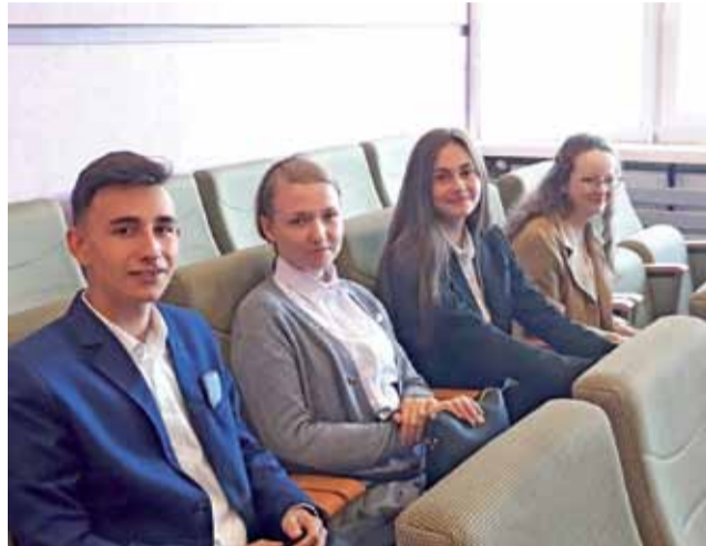
Reprezentanci II LO w konkursie wiedzy o Żołnierzach Wykłychych.