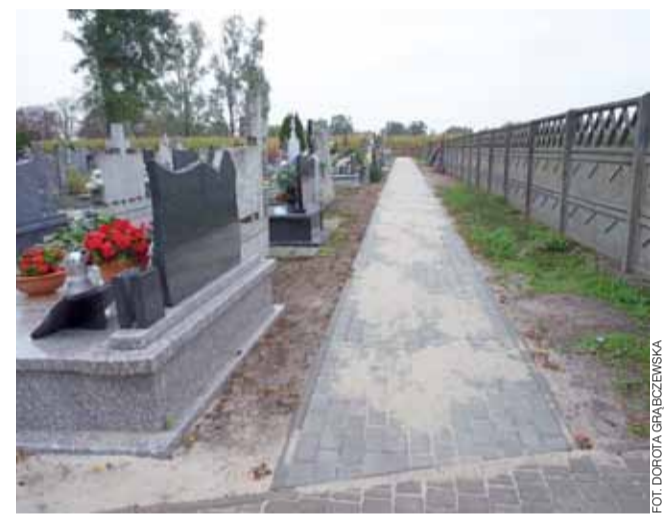
W tym roku zrobiono już 100 metrów cmentarnej alejki.