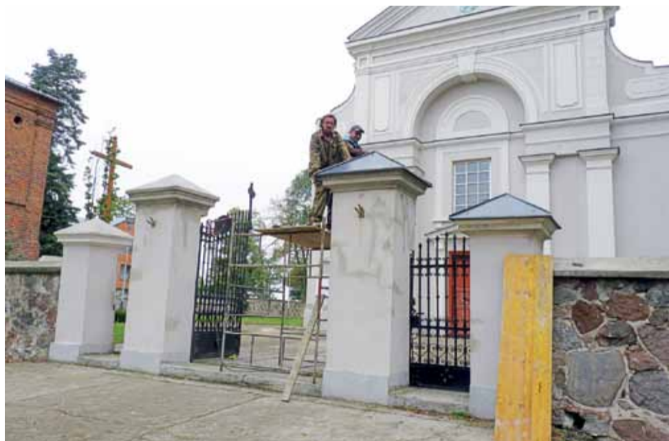
Przez kilka dni montowano metalowe daszki na cokołach słupów podtrzymujących bramę do kościoła w Śleszynie.

teką otwierają się nowe możliwości funkcjonowania. Teraz bibliotece przydałyby się nowe, większe pomieszczenie. Obecnie biblioteka znajduje się w budynku Urzędu Gminy Pacyna, co utrudnia mieszkańcom swobodne korzystanie z księgozbioru. Poza tym ciasnota również ogranicza możliwości funkcjonowania biblioteki. Włodarze gminy już wspominali o potrzebie przeniesienia biblioteki do innych, większych pomieszczeń. Oby swoje zamiary zrealizowali jak najszybciej. dag