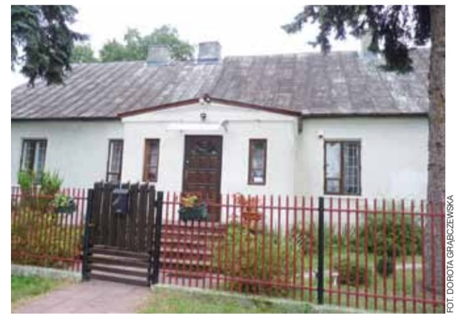
Plebania w Luszyńie świeci pustkami.

Ponieważ członkowie grupy nie wierzą w to, że Covid-19 jest poważnym zagrożeniem, wszelkie wprowadzane od marca restrykcje uważają za pogwałcenie art. 31 ust. 3 Konstytucji: „Ograniczenia w zakresie korzystania z konstytucyjnych wolności i praw mogą być ustanawiane tylko w ustawie i tylko wtedy, gdy są konieczne w demokratycznym państwie dla jego bezpieczeństwa lub porządku publicznego, bądź dla ochrony środowiska, zdrowia i moralności publicznej, albo wolności i praw innych osób. Ograniczenia te nie mogą naruszać istoty wolności i praw”. str. 10