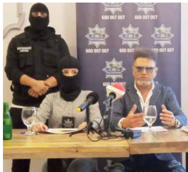
Na konferencji detektywowi Rutkowskiemu towarzyszyli pracownicy jego biura.

Zapytaliśmy dziekana dekanatu żychlińskiego, ks. Wiesława Frelka, o sytuację kadrową w Luszyńie. str. 2