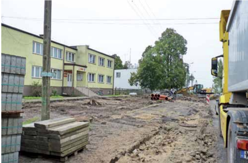
Tydzień temu teren przed Urzędem Gminy w Pacynie został wstępnie przygotowany pod planowany parking w ramach modernizacji odcinka drogi wojewódzkiej.

– Ułożyliśmy już ok. 50 proc. kanalizacji deszczowej. Póki co, drogą mogą jeszcze przejechać tylko osoby udające się do swoich posesji – mówi Grzegorz Golec, kierownik budowy. – Gdy zaczniemy budowę ronda, ruch będzie całkowicie wstrzymany. Będziemy się starać, aby utrudnienia zminimalizować. Potrze-