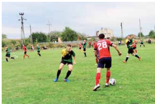
Piłkarze Olimpij Oporów przegrali 2:3 mecz na własnym boisku przeciwko Sierakowiance Sierakowice.

■ Następna, 9. kolejka Skierniewickiej Klasy B odbędzie się w nie-