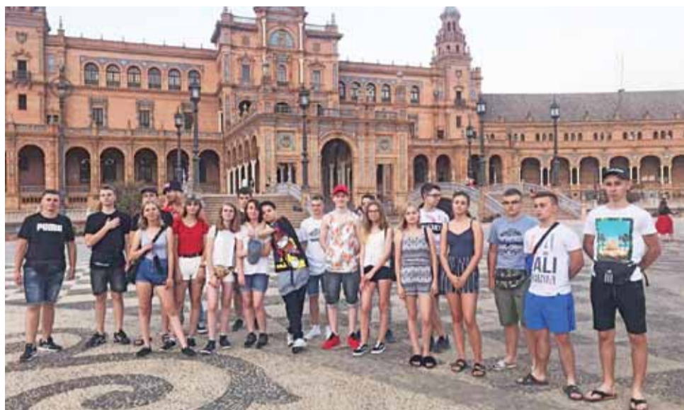
Po zajęciach praktycznych uczniowie z Zespołu Szkół w Żychlinie zwiedzali Sewillę.

W pensjonacie mieli zapewnione obiady i kolacje przygotowy-