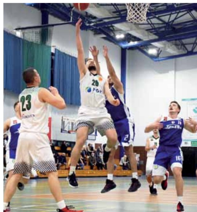
Koszykarze KS Kutno niestety przegrali wyjazdowe spotkanie 3. kolejki II ligi mężczyzn przeciwko UKS Trójka Żyrardów wynikiem 90:79.

■ Następna, 4. kolejka II Ligi Piłki Koszykowej Mężczyzn Grupa B odbędzie się w niedzielę, 18 października. Kutnowscy koszykarze KS podczas 4. kolejki ligi będą podejmować we własnej hali (SP Nr 9