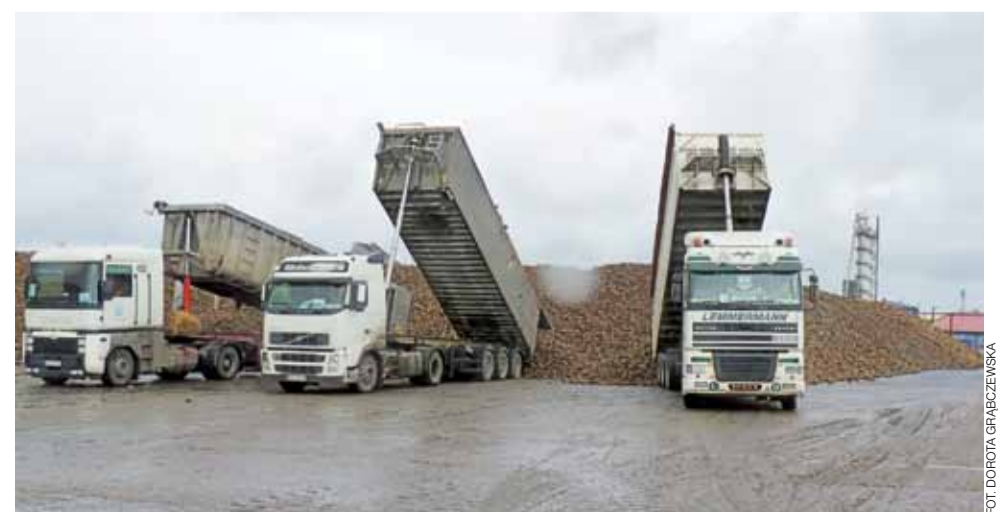
Na placu buraczanym zgromadzono surowca na 3 dni produkcji.

– Plon buraka też nie powala, tylko 55 ton z hektara, polaryzacja, czyli zawartość cukru w buraku też bardzo niska, 14,7 proc. – dodaje dyrektor. – Liczyliśmy, że październik będzie słoneczny i zawartość cukru wzrośnie. Niestety, jest deszczowo i pochmurnie. dag