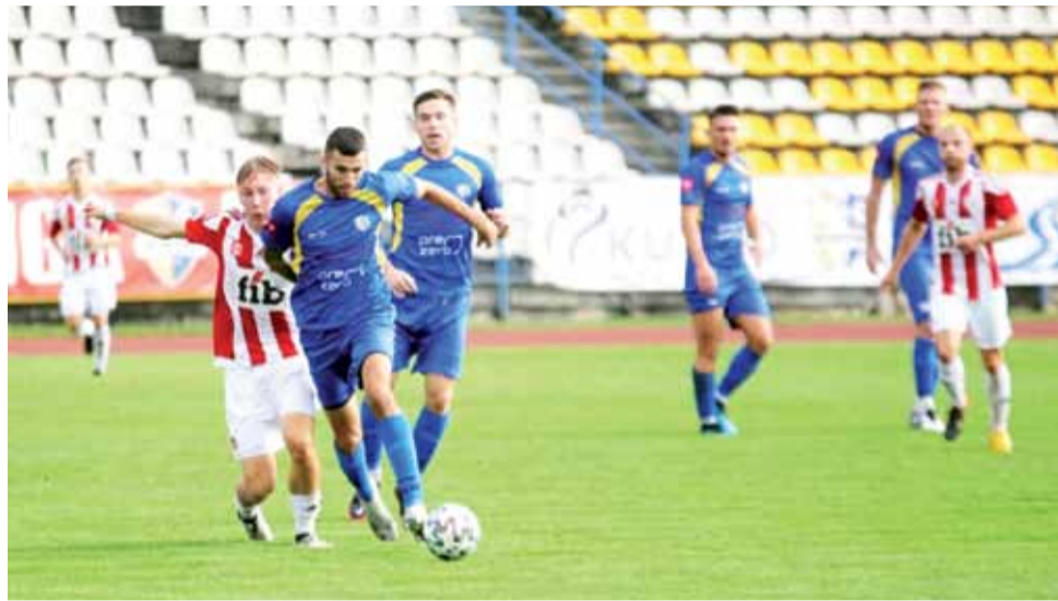
W meczu 10. kolejki III ligi zespół KS Kutno pokonał 3:2 lidera tabeli – Pogoń Grodzisk Mazowiecki, awansując w wyniku zwycięstwa na trzecie miejsce w rozgrywkach.

Po zmianie stron nie brakowało emocji i bramek, a wynik zmienił się jak w kalejdoskopie. Gospoda-