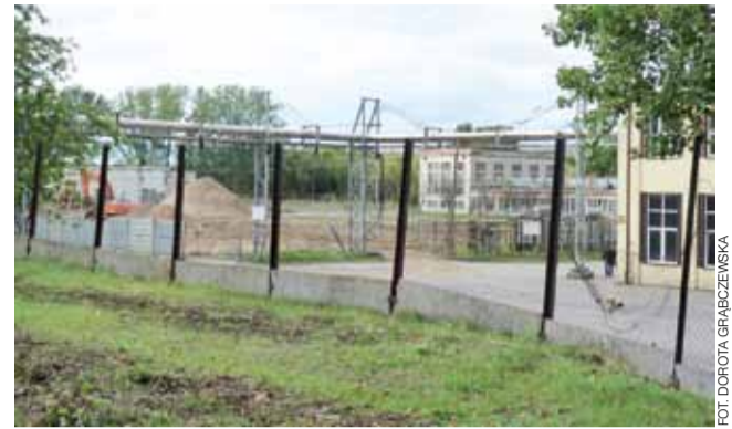
Rozpoczęła się budowa Centrum Rozwojowo-Badawczego Emitu , które ma być gotowe za rok.

Budynki będą posiadać typowe przeszklenia do 35 proc. Część