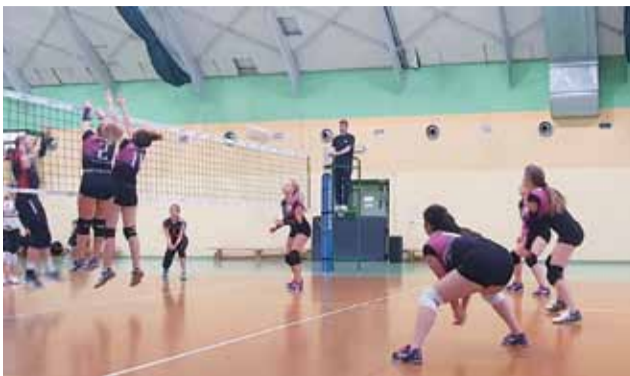
Juniorki Asika już grają w lidze wojewódzkiej.

go ŁKS, która w tamtym sezonie była finalistką Mistrzostw Polski Kadetek. Asik przegrał ten pojedynek 0:3, ale gra nie była zła.