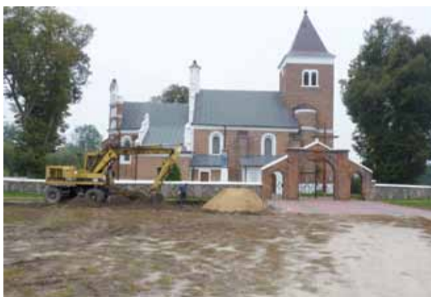
Parking przed kościołem w Lusznynie ma powstać do 30 października.

Teraz mieszkańcy do kościoła będą wędrować po brukowym parkingu, a nie po błocie. Najgorzej było zawsze wiosną i jesienią, gdy padają deszcze. dag