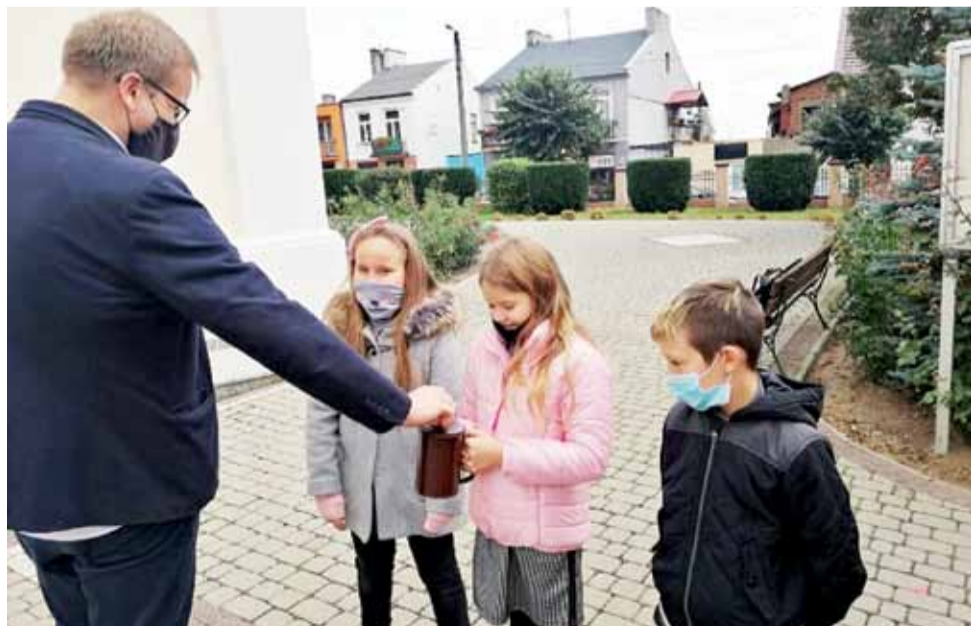
Na zdjęciu uczniowie SP nr 2 im. Jana Pawła II w Żychlinie podczas niedzielnej kwesty.

W tym roku podobnie jak i w poprzednich latach przeprowadzono zbiórkę, zbierając pieniądze do puszek po niedzielnych nabożeństwach. W tym roku udział w zbiórce wzięło ponad 20 dzieci i młodzieży z Zespołu Szkół nr 1 w Żychlinie, SP nr 2