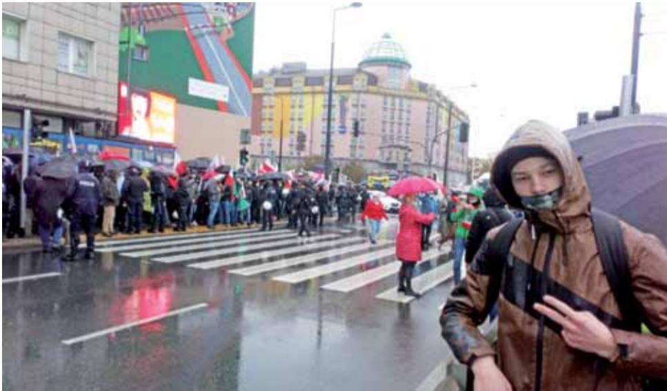
Protestujący rolnicy w Al. Jerozolimskich w Warszawie, w tle widoczny hotel Radisson Blu Sobieski.

Wiele osób przyjechało na protest z racami, syrenami i transparentami, na których najczęściej były wypisane hasła „Nie dla piątki Kaczyńskiego”, „Obronimy polską wieś”. Zdarzały się też transparenty na temat walki z ASF, które przywieźli ze sobą członkowie Związku Hodowców Trzody Chlewnej. Była sztuczna krowa prowadzona wózku, z napisem „Dla Morawieckiego”, kosy,