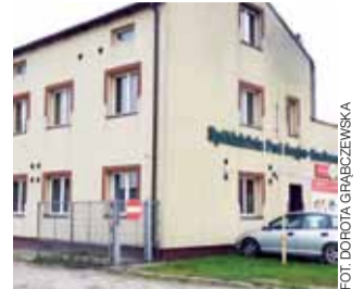
SKR Oporów, której prezes został odwołany z funkcji. Nieprawidłowości bada policja.

ni. Rok temu przeszedł na emeryturę, ale nadal pełnił funkcje prezesa na pół etatu. Przez wiele lat SKR w Oporowie miał powody do dumy, bowiem większość SKR w okolicy już dawno przestała funkcjonować. Tymczasem SKR w Oporowie przetrwał najtrudniejszy okres. Kilka lat temu SKR zakupił nowoczesne kombajny, miał kruszarkę do kamienia i ponad 103 ha gruntów. Wy-