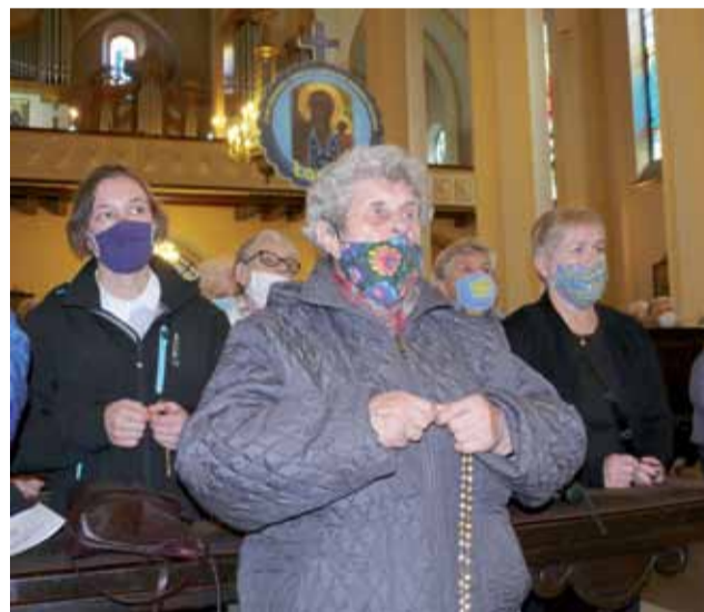
Jednym z elementów pielgrzymki Kół Żywego Różańca do Domaniewic była wspólna modlitwa różańcowa.