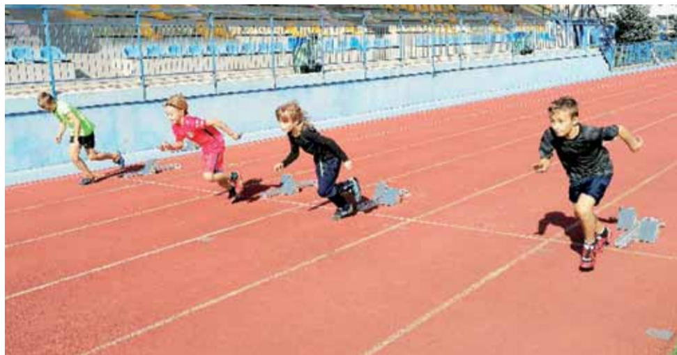
Reprezentacja uczniów Szkoły Podstawowej Nr 2 podczas Powiatowych Czwartków Lekkoatletycznych w Kutnie.