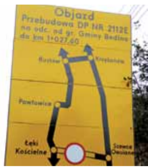
Droga z Szewc Owsianych do Łęk Kościelnych w stronę Młogoszyna nieprzejezdna do końca listopada.

Wykonawca zorganizował objazdy. Droga przez Łęki Ko-