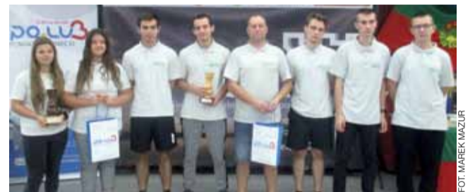
Występ dwóch drużyn Pałacu Nieborów w Kokotku był bardzo udany.