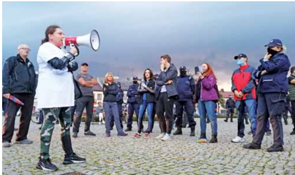
Około 50 osób wzięło udział w sobotę w proteście przeciwko restrykcjom narzuconym w związku z epidemią koronawirusa, zorganizowanym na Nowym Rynku w Łowiczu. Było głośno i gorąco.

Nowe rozporządzenie powieła większość przepisów z wcześniejszych regulacji tego typu, wydawanych przez Radę Ministrów. Ponownie wprowadzono obowiązek noszenia maseczek m.in. na ulicy, w sklepie, w komunikacji publicznej, w miejscach pracy, w kościele oraz na cmentarzu. Nie zmieniły się zasady noszenia maseczek przez uczniów – o tym decyduje dyrektor. Maseczek nie muszą mieć osoby uprawiające sport lub przebywające w le-