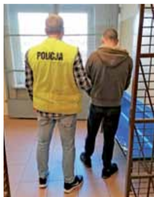
32-letni obywatel Mołdawii , który włamał się do motelu w Pleckiej Dąbrowie, został zatrzymany i aresztowany.