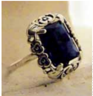
Taka biżuteria została skradziona. Za znalezienie choćby jednego przedmiotu wyznaczona jest nagroda 20 tys. zł.