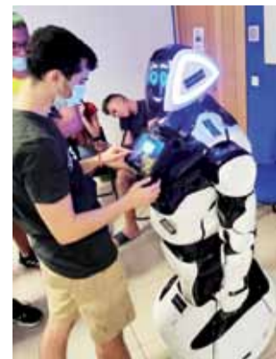
Uczniowie z ZS mieli też zajęcia z inteligentnymi robotami wielkości człowieka, które rozpoznawały twarze.

Oprócz praktyk soboty i niedziele były wolne, a uczniowie