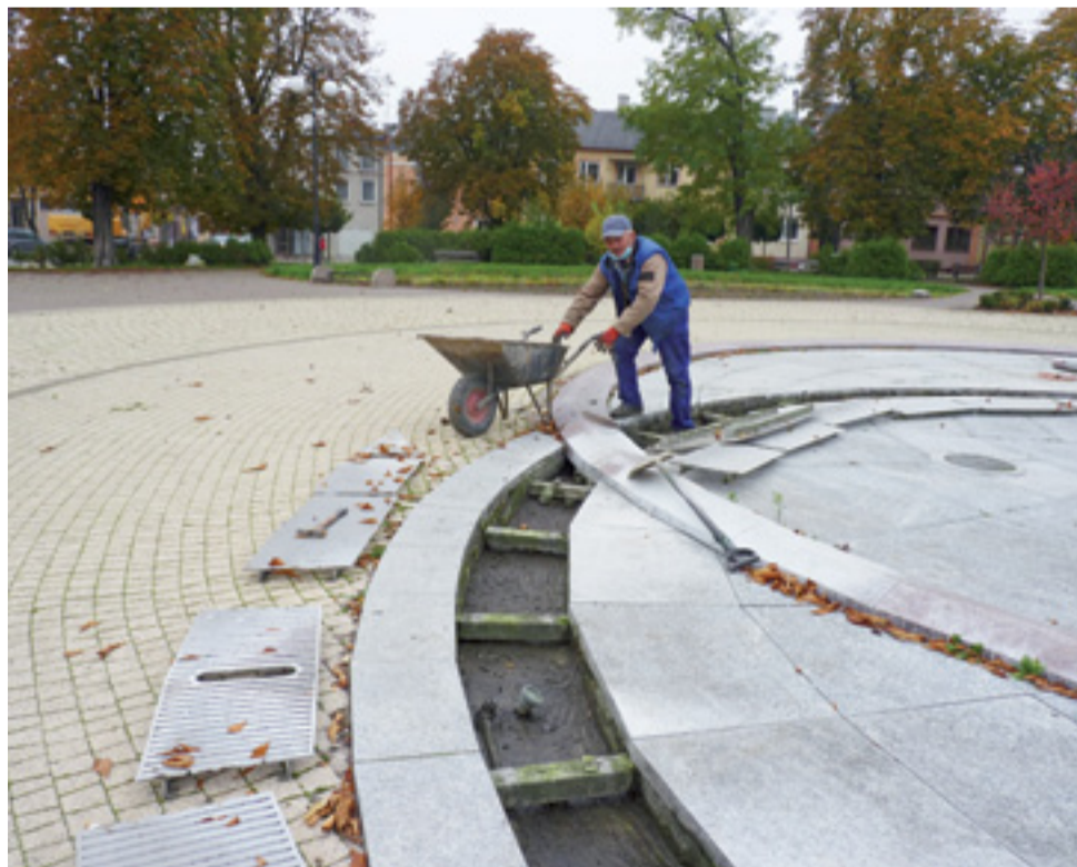
Pracownicy firmy Raf Det 27 października oczyszczali fontannę.

Teraz, gdy zdjęto metalowe kraty wokół fontanny, przyjrzelismy się jak wygląda stan techniczny fontanny. Nawet okiem laika widać, że samorządowców czeka spory wydatek. Koryto wokół fontanny, które odprowadza nadmiar wody, gdy fontanna działa, przeraża swoim wyglądem. Po latach użytkowania betonowe połączenia poszczególnych płyt zmurszały i odpadają przy jego czyszczeniu. Widać wyraźne szczeliny. Jak-