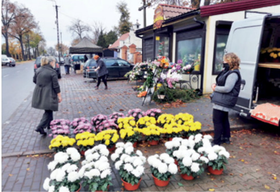
Część sprzedawców wróciła przed łowickie cmentarze dopiero we wtorek, gdy ponownie zostały one otwarte. Kwiatów i zniczy sprzedawano już jednak dużo mniej.

O dużych stratach mówił nam również mieszkaniec Zdun, który przygotował na 1 listopada około 550 chryzantem doniczkowych i 3000 kwiatów ciętych. Handel rozpoczął już na tydzień przed świętem, dzięki czemu sprzedał większość chryzantem – we wtorek miał około 150 doniczek. Dużo większy problem ma nato-