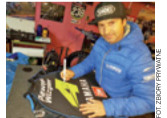
Każdy, kto dokona wpłaty, weźmie udział w losowaniu koszulki Mistrz Polski 2020 w motocrossie w klasie MX Masters.