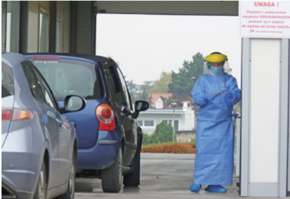
30 października Kutnowski Szpital Samorządowy został przekształcony na covidowy dla północnej strony województwa łódzkiego. Wcześniej był tam tylko punkt wymazowy.

II faza (od 4 do 8 dnia) utrata smaku i węchu, zmęczenie przy minimalnym wysiłku, ból w klatce piersiowej, ból w dolnej części