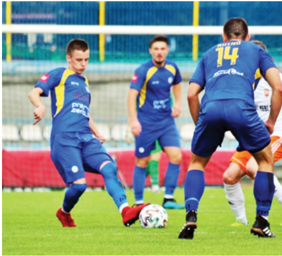
Niestety piłkarze KS Kutno przegrali mecz 13. kolejki trzecioligowej 1 grupy w starciu na wyjeździe z Legionovią Legionowo, wynikiem 2:1 dla gospodarzy.

W drugiej odsłonie gra obu drużyn była dość wyrównana. Remisowym rezultatem sprzed przerwy mogło się zakończyć sobotnie spotkanie, gdyby nie strzał gospodarzy oddany na koniec gry – w 89. minucie. Bramka ta przechyliła szalę zwycięstwa na stronę drużyny z Legionowa. Ostatecznie mecz zakończył się wynikiem 2:1 dla gospodarzy.