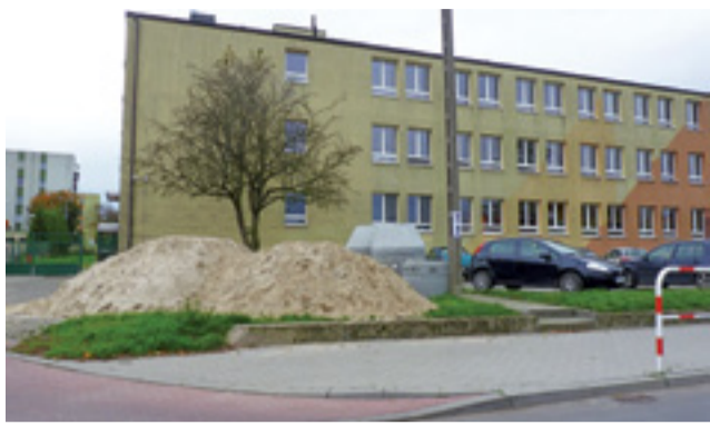
Wkrótce przy SP 2 będzie robione odwodnienie ściany frontowej. Materiał już jest gromadzony przez wykonawcę.