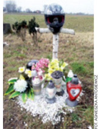
W miejscu, gdzie doszło do wypadku, stoi brzozywy krzyż, a na nim kask. Bliscy odwiedzają to miejsce, aby zapalić znicze.

Mecenas reprezentująca rodzinę ofiary, która w sprawie występuje jako strona pokrzywdzona, zgodziła się na powołanie poli-