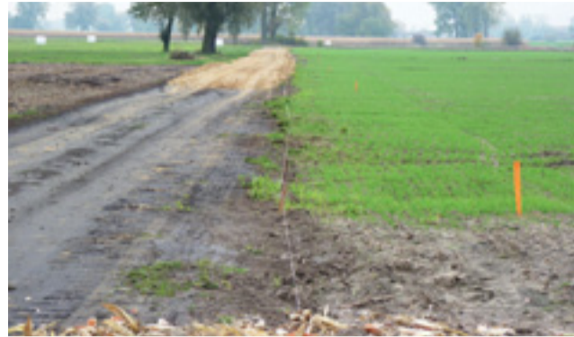
Zabite drewniane słupki wskazują, dokąd sięga pas drogowy. Rolnicy wrolali się w drogę ok. 2-2,5 metra.