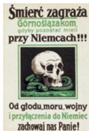
Pocztówka propagandowa z okresu plebiscytu na Górnym Śląsku.

Warszawa, 4 listopada 1920 [Kazimierz Świtalski, Diariusz 1919–1935, Warszawa 1992]