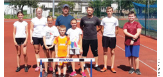
Lekkoatletyczna rodzina Jedynki jest bardzo silna i ma kilka talentowanych „perełek”.