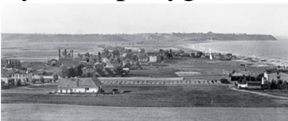
Gdynia, pocz. lat 20. Widok z Kamiennej Góry przed rozpoczęciem budowy portu gdyńskiego.

Wszczęto już kroki celem urządzenia portu w Gdyni, dostępnego dla okrętów średniej wielkości, który ma przynajmniej w części uniezależnić od Gdańska, względnie pozwoli gdańszczan trzymać w szachu. W związku z tym, Rada Mini-