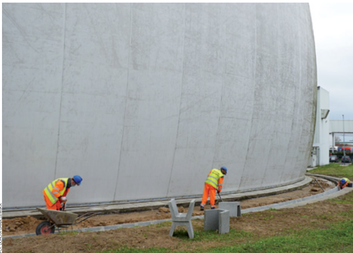
Wokół balonowego magazynu budowane jest nowe odwodnienie, dotychczasowe nie sprawdziło się.

Zatem obydwie informacje są tylko plotkami, które nie mają potwierdzenia w faktach. dag