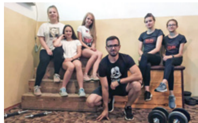
Ekipa UKS GOK Zduny w zimie nie będzie próżnować. Chętni do treningu są!