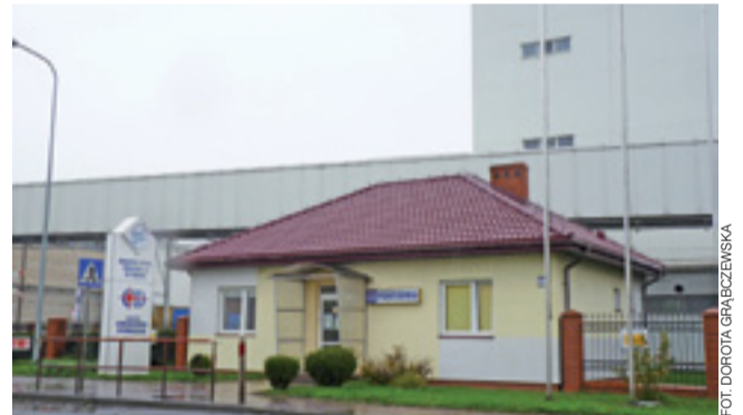
Dyrekcja Cukrowni w Dobrzelinie w razie potrzeby wykonuje swoje testy przez akredytowane laboratorium. Wszystko, by skrócić czas kwarantanny, by zminimalizować utrudnienia w organizacji pracy

Wykonywanie testów COVID ma też pozytywny wpływ na psychikę pracowników, którzy szybko uzyskują odpowiedź czy są zdrowi, czy zakażeni. W publicznej służbie zdrowia, która jest coraz bardziej niewydolna, żyłoby