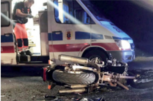
Pogotowie na miejscu wypadku przez około godzinę podejmowało działania, aby ustabilizować stan motocyklisty przed przewiezieniem do szpitala.

Piotr F. zgodził się odpowiadać tylko na pytania sądu oraz swoje- go obrońcy. Sędzia pytała go jak poznał, że nadjeżdża samochód,