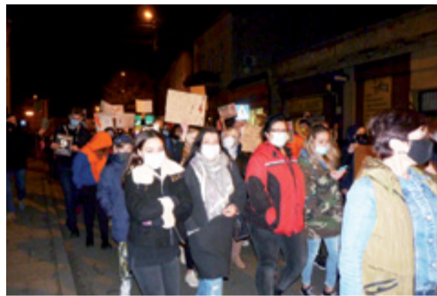
Pierwszego dnia protestu w Żychlinie na ulicę wyszło ok. 500 osób. Kolejnego dnia było już tylko ok. 100 osób.

Na wysokości zadania stanęli policjanci i strażacy z OSP Żychlina, którzy zabezpieczali protest. Oni czuwali nad bezpieczeń-