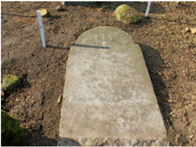
Macewy odnalezione na cmentarzu żydowskim w Bolimowie.