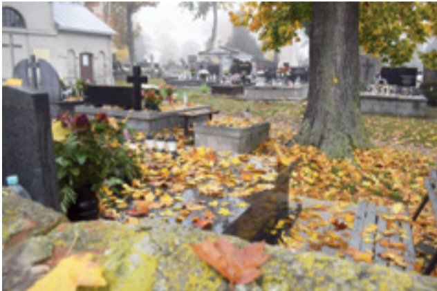
Pusty cmentarz katedralny w przededniu Wszystkich Świętych. Jeszcze rok temu trudno byłoby uwierzyć, że to możliwe.

– Jeśli to miało być dla bezpieczeństwa, to niech premier zobaczy co się tutaj teraz dzieje! – dodaje inny ze sprzedawców. – Nie można było tego ogłosić wcześniej, tak żeby każdy sobie ten tydzień rozplanował i by się ta frekwencja rozłożyła na poszczególne dni?