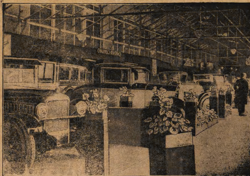
Pawilon firmy „Talbot“ na wystawie automobilowej w Londynie.

Organ piśmudczyków oświadcza, że rząd, pragnąc podnieść prestiż władzy wykonawczej, jest gotów wyciągnąć konsekwencje z ewentualnego sprzeciwu lewicy.