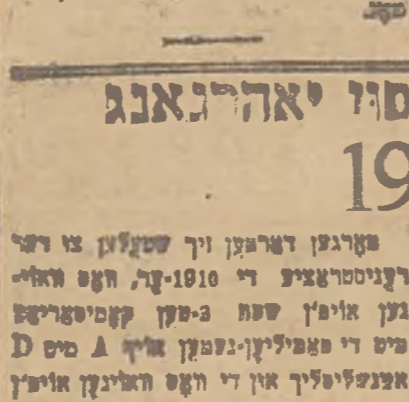
אויבער-ענין פאליטען-ענין פון די אנדושיעווער הרבנות פון אנדושיעווער, האט דער ענין אזי