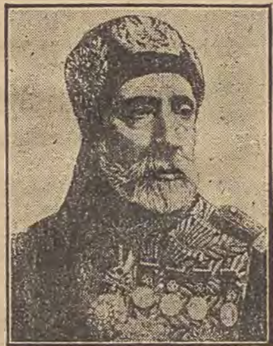
טויט פון בעי פון טוניס. טויט פון בעי פון טוניס, פראנצויזישע טוניס, איז געשטארבען אין פאריז אין אלטער פון 71 יאר.