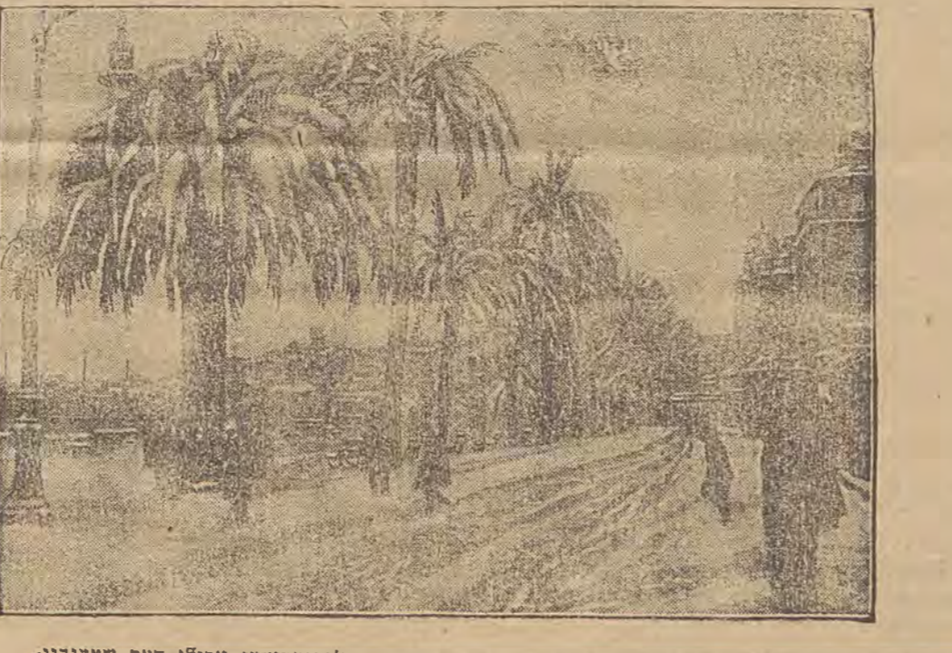
דער הילעריגער נרויזמער ווינטער האט נישט אויסגעמיטן אפילו דאס שטענדיג-וואיימע דרום-איראפא, דאס בילד שטעלט אונז פאר א וועלטלעכע לאנדשאפט; די פאלמען פון דער ווינטער ריזערע בעדעקט מיט שניי און אייז.