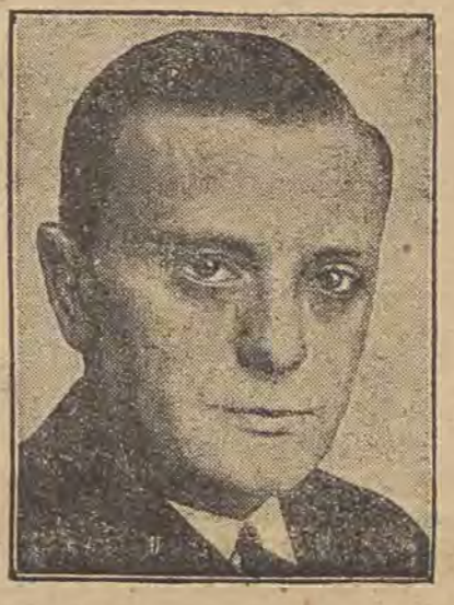
רעם אונטערזעצונדען ערפינדער דעם קינא-טעכניק... אפארטאט וואס גיט איהר אויף בילדער אויף א גרויסן שרעקלעך.