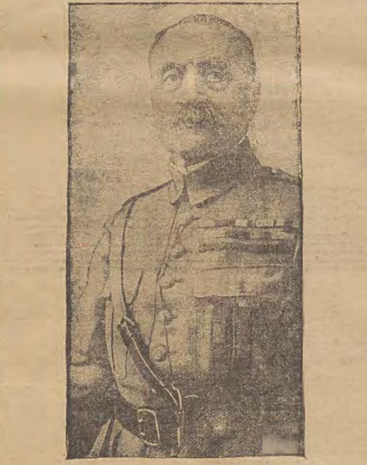
די לעצטע פאטאגראפיע פון מארשאל פאש.