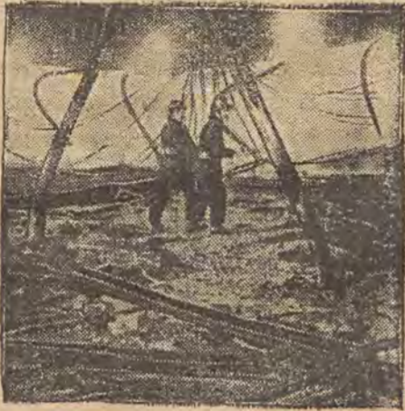
די רעטונגס-אקציע אויף דער דעק פון שיק.