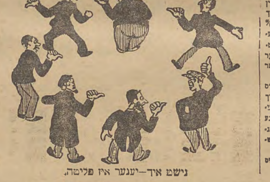
נישט איד-יענער איז פליטה.