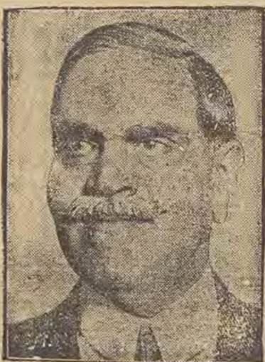
פירשט קאפורטהאלא אנבער פון רויכס-טע אינדישער הערשער בעזוכט איצט די הויפט-שטעט פון אייראפא.

אינדישער מאהארדזשא אויף זיין ריזע איבער אייראפא