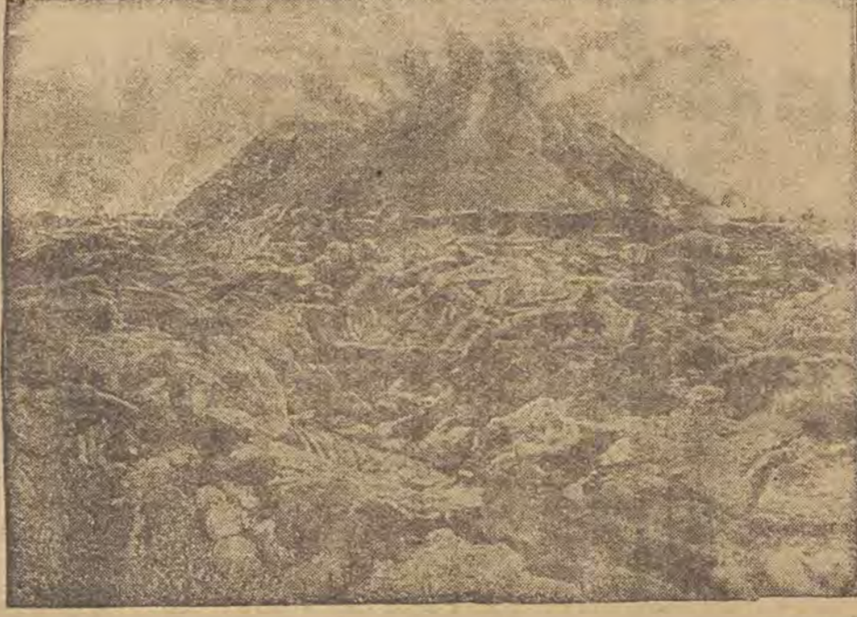
ווי מיר האָבן מיטגעטעלט, איז לעצטעס אין איטאַליען פּאַרנען און געווען ווען וועט האַט גורם געווען גרויסע הוצות. דאָס בילד שטעלט פּאַר דער פּער-שפּייטען באַרג בער און טעטיג.