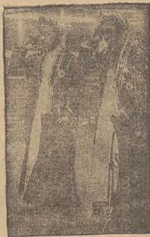
דער סולטאן פון זאניבאר (רעכטס) וועלט איצט אין לאנדאו, ער האט אויך געזען צו בעזוכען א ריזיגער אנדערע הויפט-שטעט אין איראקא.

ווען איהר געהט אריבער די נאם, חוסט מיט אפענע אויגען; איהר מענטש בלייבען אנאייביגער מאלישע, אדער גאר געפינען דעם מויט. היט זיך, מען זאל איהר נישט איבערמאדערע!