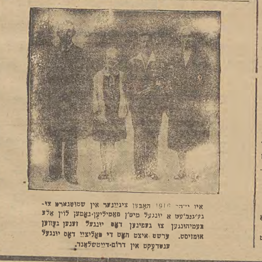
אין יידן 1914 האבען ציגענער אין שטוטגארט צו-געווען א גרויסע שטימונג, וועלכע האט געווען פאר די צענדליגע יאהר. ערשט איז האט די פאליציי דאס יונגעל ענדערט אין דרום-דייטשלאנד.

פארן (16) דין פארצויג פאר די פונדירט נישט מונסטעריום האט פונארעקטעט א צירקולאר, פארפאסט דער מיניסטער, פאר דעם פאמיליאריען מיניסטעריום, וועלכע עס וועט פון די פונדירט נישט