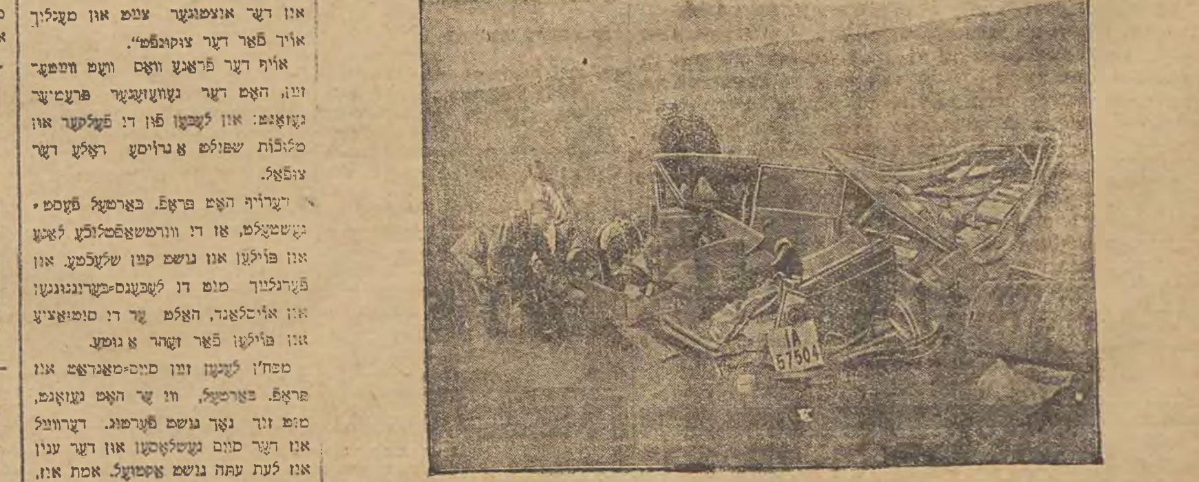
הינטער געליפן און א פרוואקטור אויף דער באה-לייניע אין מאסקווע בעת עס איז גאר אונגעקומען א צוג. עס איז פארגעקומען א קאטאסטראפע. 1 פאסאזשיר איז דער'הרגעט געווארען. 2 זענען על מי נט נוצל געווארען. אויף אונזער בילד זעט מען דעם צושטעטערטען זייטע