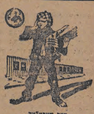
דער שאקאל "אפטימא" איז דער בעסטער.