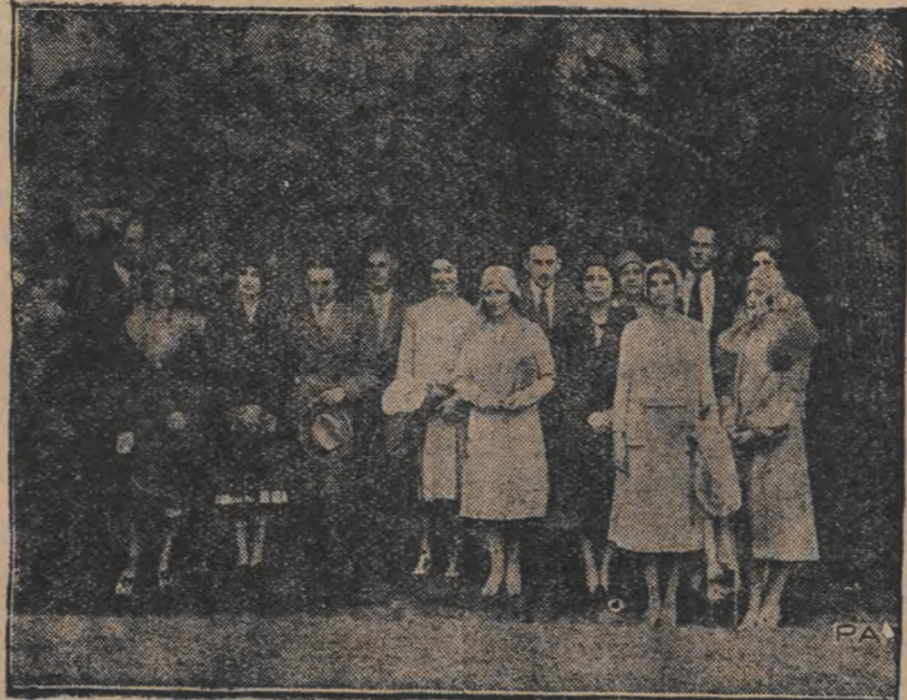
רייזענדיג איבער אייראָפּאָ, אין היינטיגע וואָך אָנגעקומען קיין וואַרשאַ אַנעסקוורטיע פון שוועדע אַמעריקאנער, צוהערערניס פון די דאָרטיגע הויכע לעהר-אַנשטאַלען