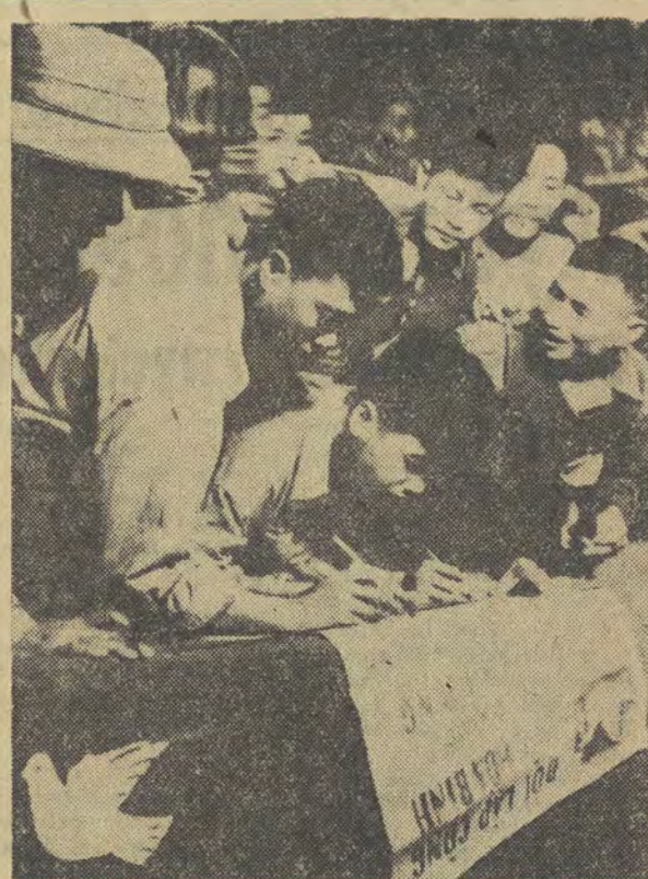
Młodzież wietnamska bierze czynny udział w bohater- skiej walce narodu wietnamskiego o wolność i niezależność. Młodzież ta nie zaprzestaje również walki o pokój. Wśród dziesięciu milionów podpisów złożonych przez Wietnamczyków pod ape- lem o zawarcie pak- tu pokoju między pięcioma mocarst- wami nie zabrakło podpisów młodzieży. Na zdjęciu: mło- dzież z Hoa-Binh składa swe podpisy pod apelem.