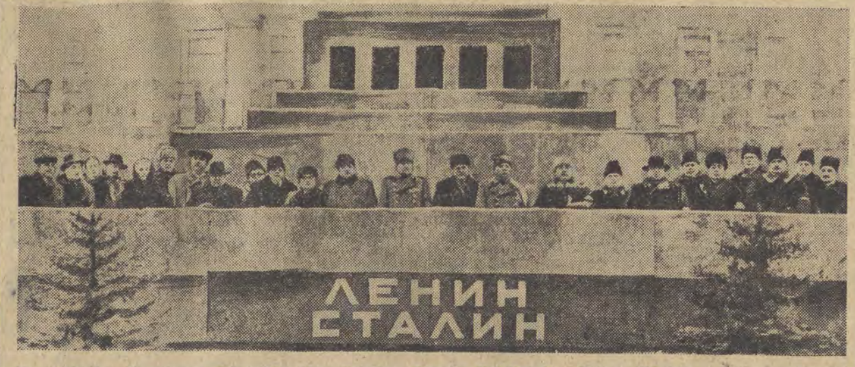
Na trybunie Mauzoleum: Gheorghiu-Dej, Bolesław Bierut, Pak-Den-Ai, Walter Ulbricht, Dolores Ibarruri, Otto Grotewohl, Wilko Czerwenkow, Matias Rakosi, Pietro Nenni, Palmiro Togliatti, Jacques Duclos, Klement Gottwald, N. A. Bulganin, W. M. Molotow, K. J. Woroszyłow, G. M. Malenkow, N. Szwernik, A. I. Mikołajew, Czou-En-laj, M. G. Pierwuchin, L. M. Kaganowicz, H. M.

Odpowiedzialne zadania, jakie stoją przed załogami zakładów przemysłu bawełnianego w roku bieżącym, muszą być w pełni i przez wszystkie zakłady realizowane. (w)