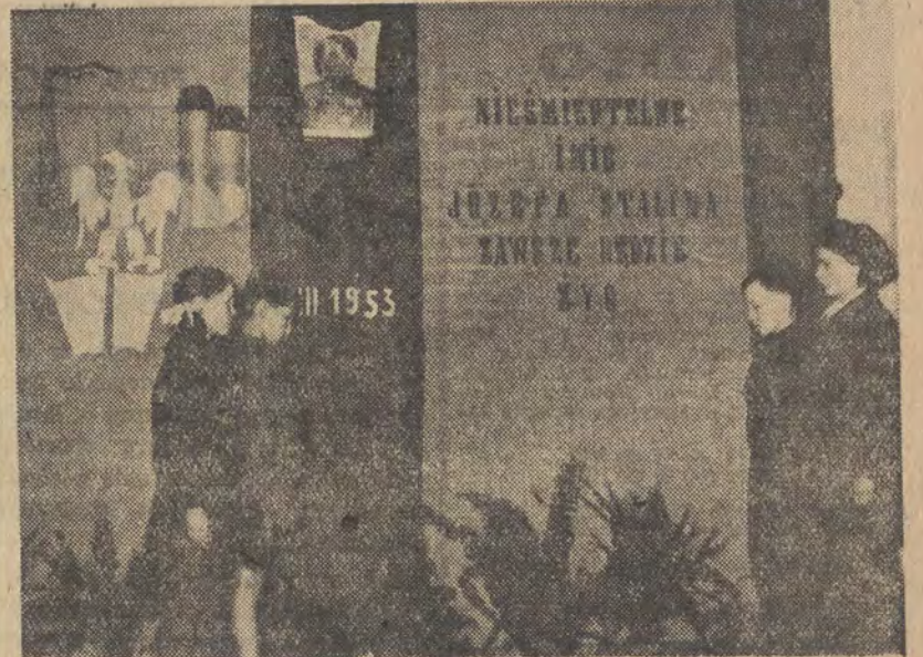
Na zdjęciu: warta honorowa zaciągnięta przed portretem J. W. Stalina przez uczniów szkoły TPD nr 13 w Warszawie.

We wszystkich szkołach łódzkich trwają obecnie przygotowania do zagospodarowania szkolnych działek doświadczalnych. Szkoły, które dotychczas swych działek nie posiadały, mają je otrzymać. Chodzi bowiem o to, aby młodzież mogła samodzielnie, na drodze praktycznego eksperymentowania, zapoznawać się z nauką agrobiologii. Wydział oświaty wraz z Woj. Ośrodkiem Doskonalenia Kadr Oświatowych przydzieli szkołom również odpowiednie ilości nawozów sztucznych i nasion. (z)