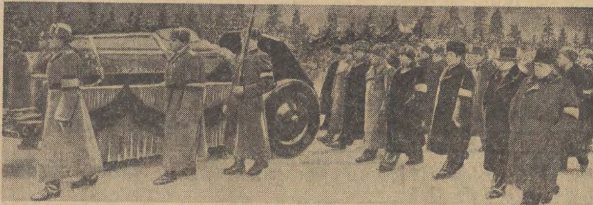
MOSKWA. — Pogrzeb przewodniczącego Rady Ministrów ZSRR i sekretarza Komitetu Centralnego Komunistycznej Partii Związku Radzieckiego, Gen. W. Stalina. Na zdjęciu: żałobny kondukt na Placu Czerwonym