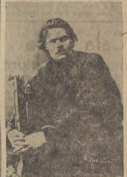
Jedna z dawniejszych fotografii Gorkiego.

W pamiętnym dla Rosji roku 1905 napisał Lenin: „Trzeba, aby w okresie rewolucji kierownicy partii rewolucyjnych szerzej i śmiało postawili zadania, żeby ich hasła szły zawsze na przedzie samorzutnego działania mas, aby były dla nich drogowskazem, pokazywały w całej wielkości i piękności nasz demokratyczny i socjalistyczny ideał, pokazywały najbliższą i najprostszą drogę do pełnego, bezwarunkowego i zdecydowanego zwycięstwa”.