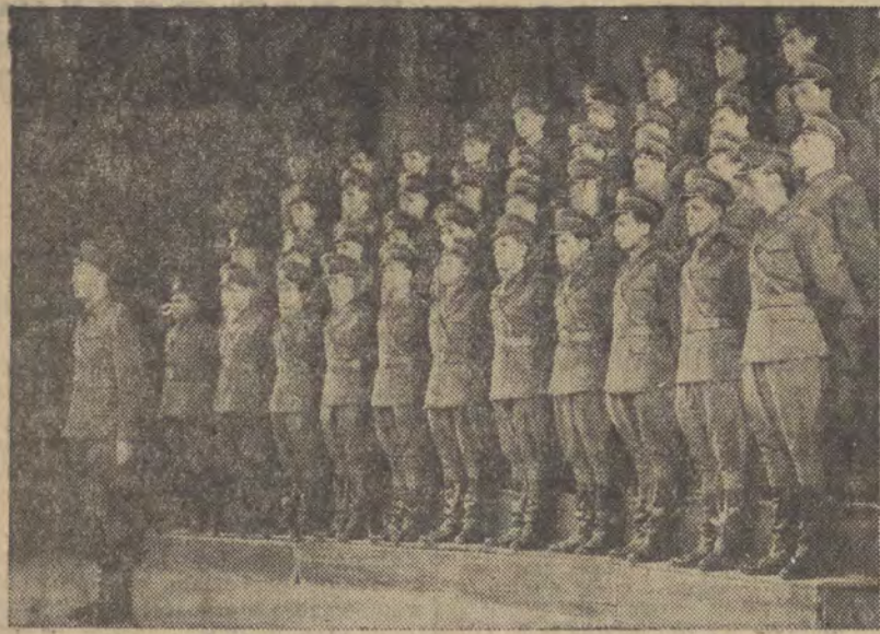
Chór zespołu śpiewa