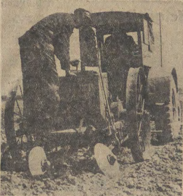
Sadzenie ziemniaków przy pomocy radzieckiej sádzarki ciągnikowej.

stają również załogi PGR woj. łódzkiego współpracując o szybkie wykonanie zadań produkcyjnych