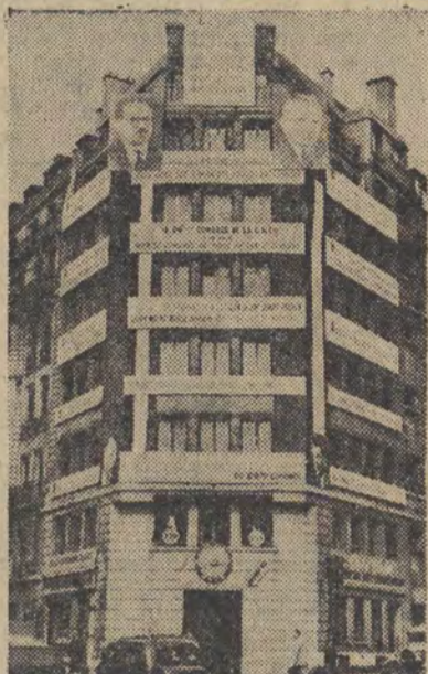
W Paryżu trwają przygotowania do 29 Kongresu Generalnej Konfederacji Pracy (CGT), który ma się odbyć w dniach 7 — 12 czerwca.

W naszych czasach, gdy głód prostego człowieka coraz donośniej rozbrzmiewa w świecie, gdy ten prosty człowiek coraz bardziej ujmuje w swe dłonie losy ludzkości, rola kobiety staje się jednym z podstawowych czynników ogólnoludzkiej walki o pokój i lepsze jutro świata.