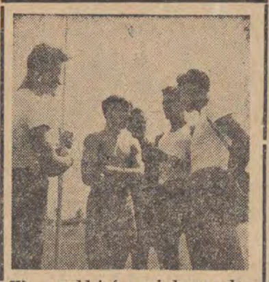
W przeddzień międzynarodowych spotkań sportowych młodzieży różnych narodów przeprowadzała treningi na Stadionie im. 23 Sierpnia w Bukareszcie.

Pierwszego sekretarza zaproszono do prezydium. Schylił się do ucha Budnikowi i długo coś tłumaczył wskazując wzrokiem Mydlarza.