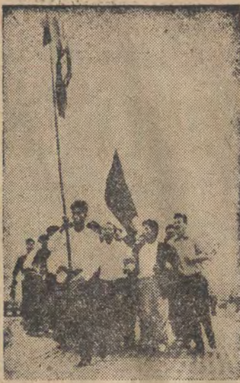
W odpowiedzi na założenie przez Amerykanów ponad 600 baz wojskowych, budowę ogromnej ilości obiektów wojskowych i zajmowanie rozległych terenów na poligon — ludność Japonii zorganizowała akcję protestacyjną. Na zdjęciu: fragment demonstracji robotników przed obozem wojsk amerykańskich w Uchinada.

Conant spotkał się ze zdecydowaną odprawą BERLIN. — Berlińska prasa demokratyczna opublikowała 6 bm. komunikat agencji ADN, który stwierdza: Jak wynika z oświadczeń kompetentnych kół, amerykański wysoki komisarz p. Conant w odpowiedzi na żądanie Niemieckiej Republiki Demokratycznej zwolnienia bezprawnie skonfiskowanych dolarowych kont, oświadczył, że rząd USA gotów jest sprzedać artykuły żywnościowe za te sumy. Jednakże wysoki komisarz Conant pozwala sobie na łączenie sprawy zwolnienia tych kont z określonymi warunkami. Konfiskata kont była bezprawna, wobec czego rząd NRD domaga się bezwarunkowego zwolnienia tych sum. Ani rząd USA, ani też wysoki komisarz nie ma prawa mieszać się w sprawę sprzedaży żywności w Niemieckiej Republice Demokratycznej. NRD nie jest kolonią i nie znajduje się w sytuacji stref zachodnich, w których ostatnie słowo w dziedzinie określania polityki ekonomicznej należy do zagranicznych imperialistów. Jeśli amerykański wysoki komisarz rzeczywiście chce troszczyć się o dobro ludności NRD, jak pragnie to zademonstrować — powinien on sprzeciwić się wszelkim prowokacjom, wymierzonym z zachodniego Berlina czy też Niemiec zachodnich przeciwko budownictwu pokojowemu w NRD.