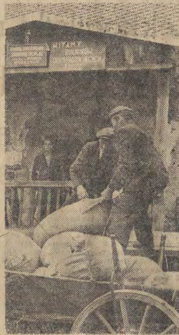
Dzięki dużej opiece i pomocy udzielanej przez Gminny Komitet PZPR w Janowie (pow. częstochowski) w tegorocznej kampanii żniwno-omiotowej, chłopcy okolicznych gromad przedterminowo wywiązują się ze swych obowiązków dostaw wobec państwa.

Ze wszystkich krańców ZSRR napływają w dalszym ciągu wypowiedzi ludzi radzieckich o uchwałach V sesji Rady Najwyższej ZSRR.