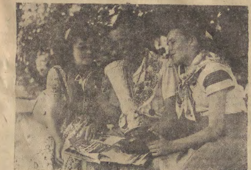
Radosne dni Festiwalu stały się okazją do wzajemnego zbliżenia młodzieży i umocnienia serdecznych więzów przyjaźni pomiędzy delegatami różnych narodów.