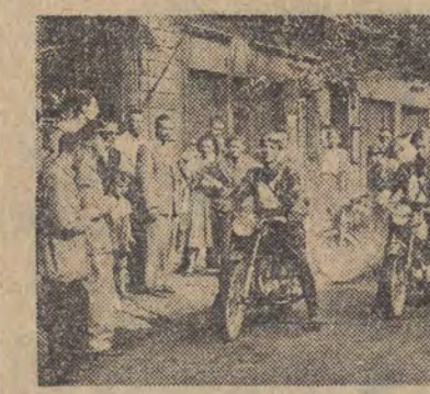
Start do nocno-dziennego raidu motorowego zorganizowanego przez Zarząd Łódzki LPŻ.

W dniu 15 i 16 bm. odbył się dwudniowy raid motocyklowy nocno-dzienny, patrolowo-meldunkowy zorganizowany przez sekcję motorową Łódzkiego Klubu Ligi Przyjaciół Żołnierza w ramach obchodu tego-