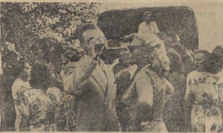
W święta panował upał. Nic więc dziwnego, że „ruchome bufety” MHD i PSS w parku na Zdrowiu nie narzekały na brak klientów...