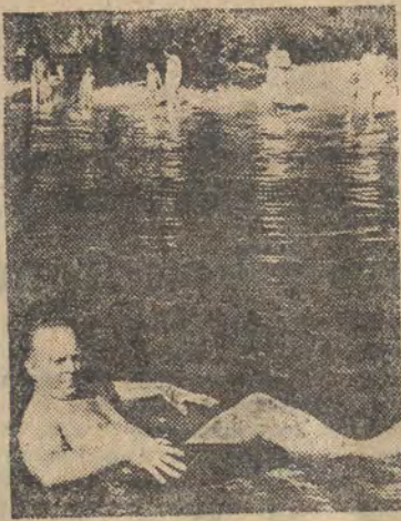
Nawet i na oponie samochodowej można się uczyć pływać...