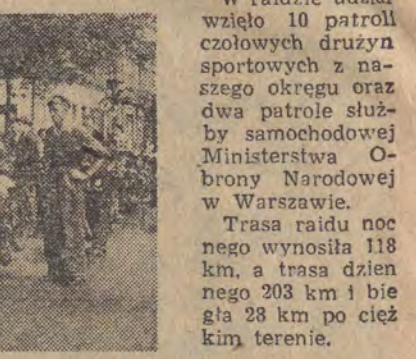
Start do nocno-dziennego raidu motorowego zorganizowanego przez Zarząd Łódzki LPŻ.

W dniu 15 i 16 bm. odbył się dwudniowy raid motocyklowy nocno-dzienny, patrolowo-meldunkowy zorganizowany przez sekcję motorową Łódzkiego Klubu Ligi Przyjaciół Żołnierza w ramach obchodu tego-