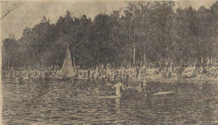
Ach, jak przyjemnie kołysać się wśród fał... w Parku 1 Maja w Rudzie Pabianickiej...