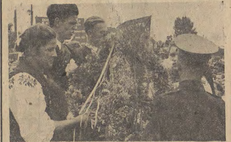
Delegacja chłopska z Walewic wręcza wieniec przedstawicielom wojska

3 Centralny Rząd Ludowy Chińskiej Republiki Ludowej uważa, że propozycja dotycząca uczestników konferen-