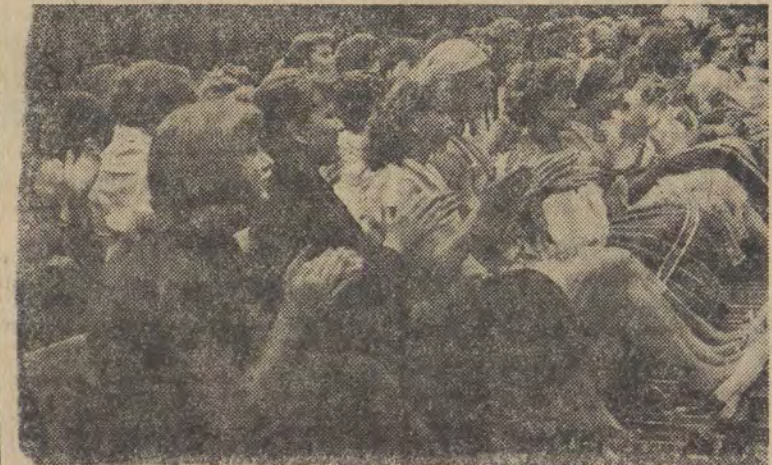
Po pięciodniowym pobycie w Ojczyźnie młodzież z Polonii Francuskiej i Belgijskiej wraca już do swych rodzin. W niedzielę, 23 bm., w obozie kolonijnym pod Łodzią, odbyła się uroczystość, na której przedstawiciele społeczeństwa łódzkiego żegnali serdecznie odjeżdżającą młodzież.