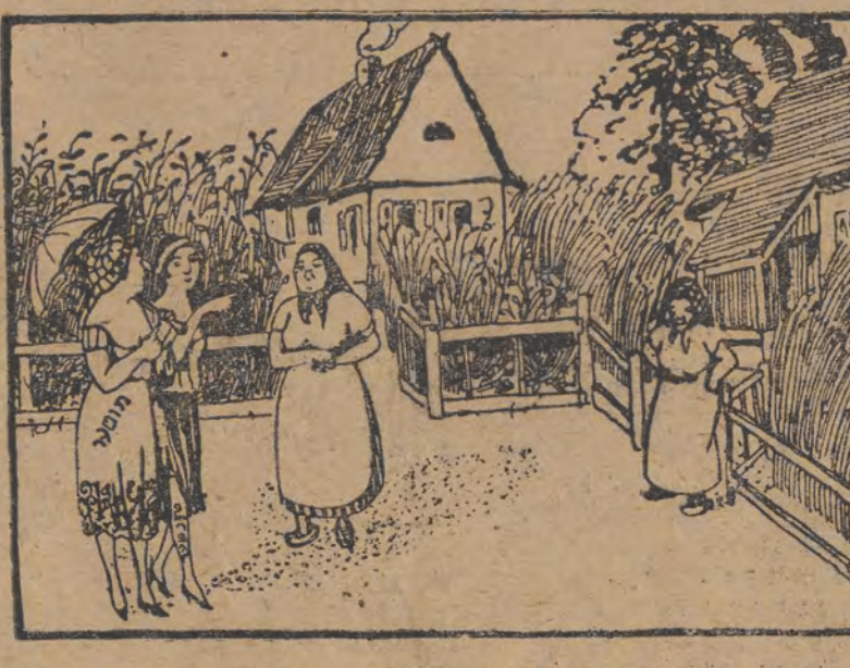
ס'אכטער: מיר געפעלט אט א די לייטנסקע-ס'איז דא הייכער קארן... מ'ט ע ר: און מיר געפעלט יענע לייטנסקע-ס'ווען דא געדיכטע קוואקעס