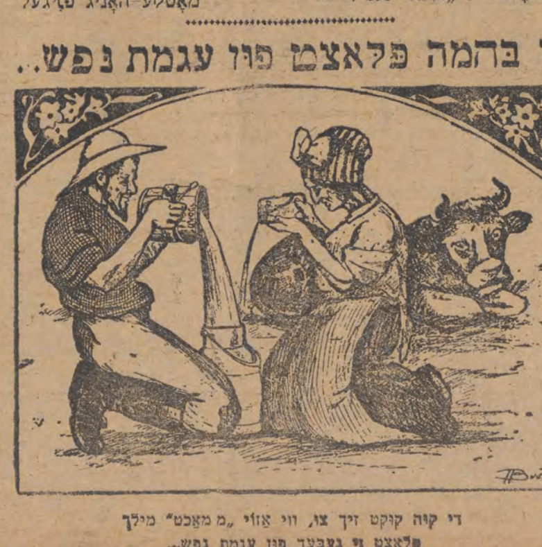
די קיה קוקט זיך צו, ווי אזוי, מ'מאכט מילך פלאצט זי בעצטן פון עגמת נפש.