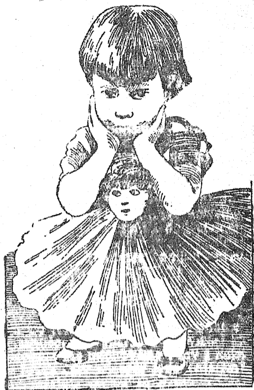
Mała Peggy jest najmłodszą gwiazdą kinową, liczy bowiem dopiero 8 i pół roku życia. Zawarła ona nie- dawno za pośrednictwem swych rodziców kontrakt z towarzystwem „The Principal Pictures Corporation“, na mocy którego pobierać będzie 1,500.000 do- larów przy rocznie.