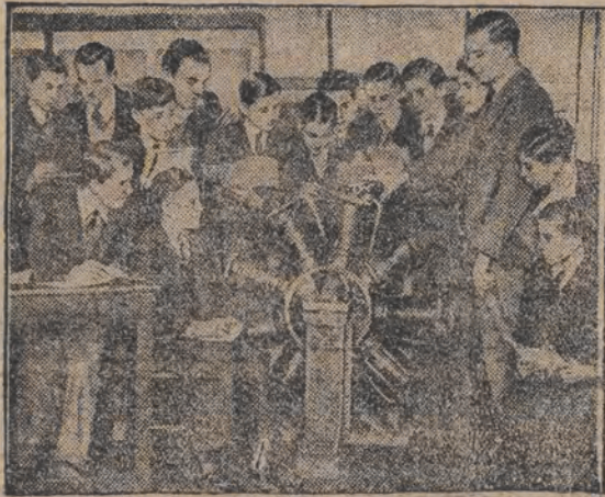
לופט-פליהעריי אלס שול-לימיד אין ענגלישען מיטל-שולען האט מען איינגעפירט...