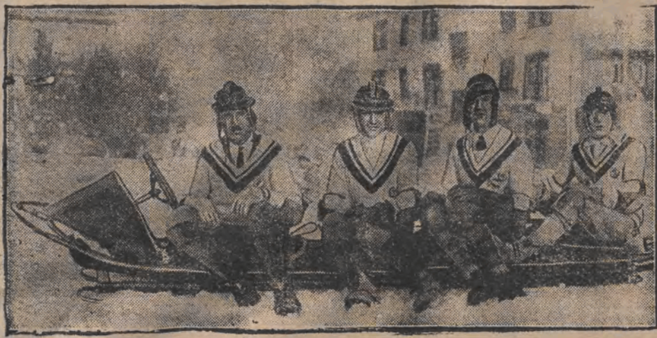
די פראמאגליקע דייטשע מאנטאט אין לעק פלזסיר.