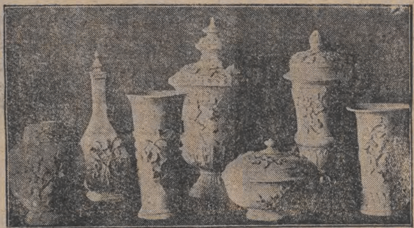
ס'איז געווארען 250 יאהר, וויט עס געבוירען געווארען דער ערפינדער פון בעריהטען מייסער-פארשעלאן, דאס זענען די ערשטע פ-רעפלאן-געגענטשאנדען, וואס זענען דאן געווארען אויסגעארבייט אין דרווען.

וואונדערבארע פארשעלאן פון 250 יאהר צוריק