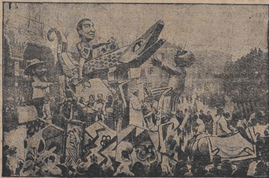
ווי די מיליאנערן און סתם גברים טון גאר דער וועלט פערבונגען דעם היינטיגן קארנאוואל אין ניצע.