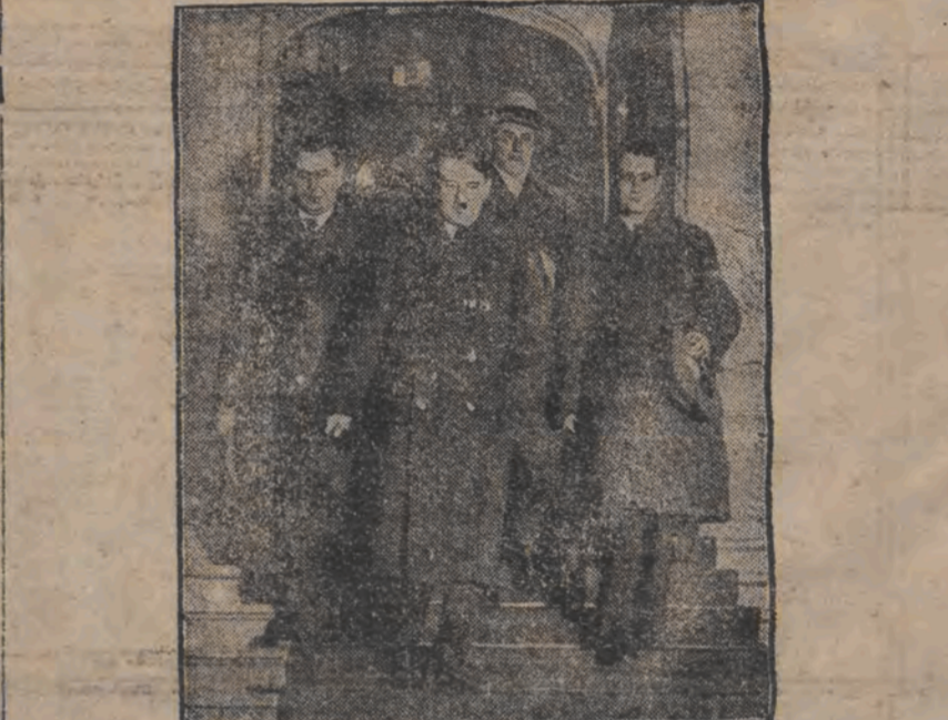
היטלער וועלכער איז דורך דער בריטיש-אמעריקאנישער רעגירונג בעשימט געווארן אלס בעאמטער פון איהר געזונדשאפט אין צעריכן, האט שוין אפגעגעבן אלס בעאמטער. דע וועג פון איהם, ווי ער פארלאזט די געזונדשאפט.