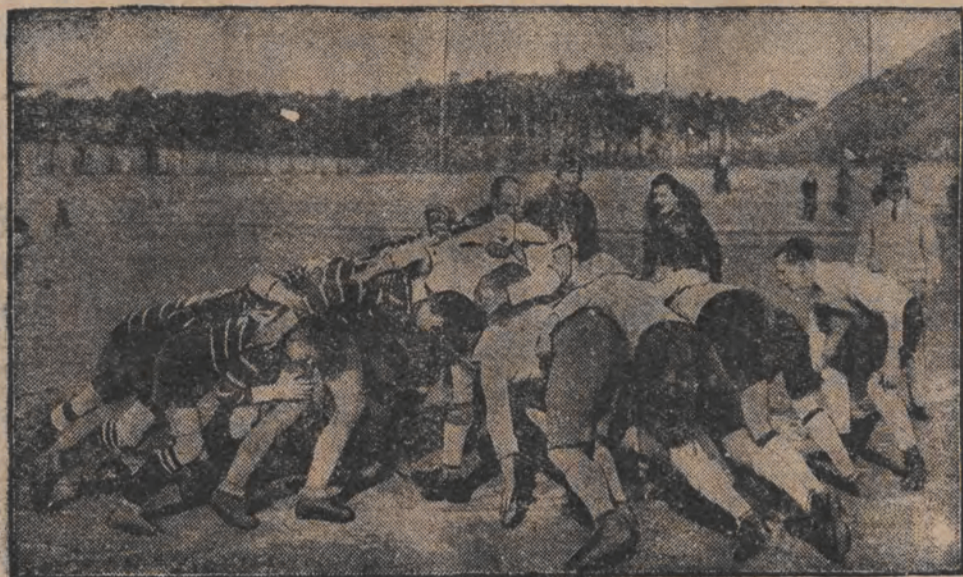
איינצלישע מאנשאפט האט אין בערלין דורכגעפירט אן אינטערעסאנטען ריזיגן-מעשע; דאס שפיל אין עהנליך צום סופאקל, מען מעג אבער דעם באלעם ווארפען אויך מיט דער האנד און בכלל אָנזענדען יעדע געוואלט געזען געגענער.