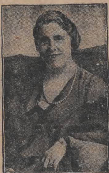
בעריהמטט אמעריקאני-נער זינגערין איז גע-וואָרען 50 יאהר אַלט. זי טרעט איצט אויף מיט גרויסער אַלגאָר אין בערלין.

בעריהמטער פליהער בערטראם פליהט קיין כינא