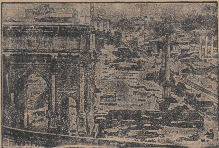
א שטארקער עגיל-נום האט זי ריזיגען פון איטאליען איינגעהילט אין א ווינט-קלייד. אין פאדערי-גרונד, דער „פארום ראָטאָנאָם“, דער עלטסטער פלאץ אין רוים.