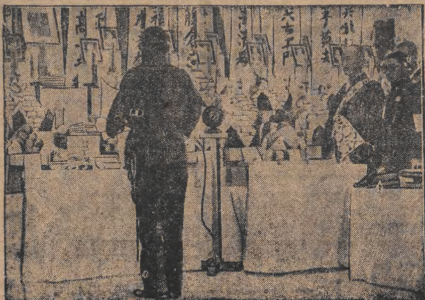
טויט-פרידן אין פאקאן, די געפאלענע ביי פאקאן; דער יאנגערער קינד-מיטגליד פון דער פאמיליע פון די מולטער הינד

אזוי נרויעט 'אפאן נאך די מלחמה-געפאלענע. דער מיניסטער פון האנדל, דאקטאר פארט, וועט דערפאר אנטפערן אויף די פראגען פון די סענאט.