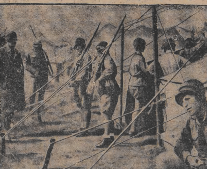
א פרויען-לאגער פאר מיליט. ציגרייטונג אין פוילען

דער ערשטער פוסבאל-מעשש איז גע- מעשש פון הוי-ארווען קענאן און פאר- נעמישן עווישן, פוסבאל, אין, וויז- טען 4:0.