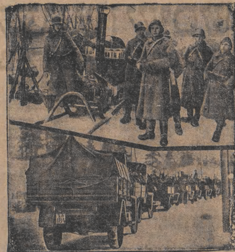
אויבער: רעווינגס-מיליטער פאר העליונספארק, ווערטענדיג אויף די לאפא-אויפשטאנד; אונטער: א טראנספארט רעווינגס-מיליטער אויפן וועג צו דער הויפט-סטאט.

די פראגע פון די לאגעריע איז א שווערע, אבער ניט האפונגסלאז. דער מיניסטער פון האנדל, דאקטאר פארט, וועט דערפאר אנטפערן אויף די פראגען פון די סענאט. דער מיניסטער פון האנדל, דאקטאר פארט, וועט דערפאר אנטפערן אויף די פראגען פון די סענאט.