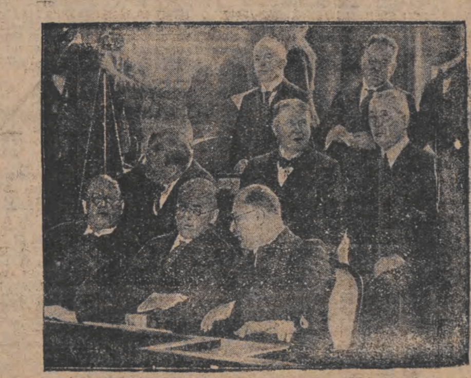
אין דער רעגירונג-קאנפערענץ פון לינקס: מיניסטער ד"ר קווענער, קאנצלער ד"ר גריי, היינ, אייבער-בירגער פייסער ד"ר פילדער און צויר