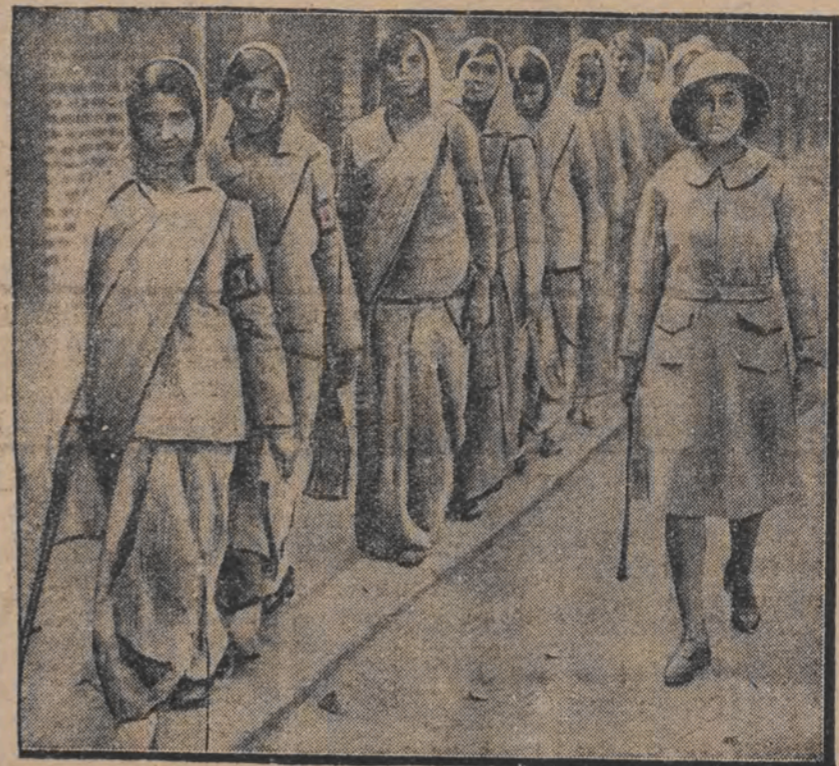
פרייען-פאליציאנטען אין אינדיען

זענען בייאפגענט מיט גומי-שטעקעס און ווערן אָנגעהירט דורך אנאמערקאנערין.