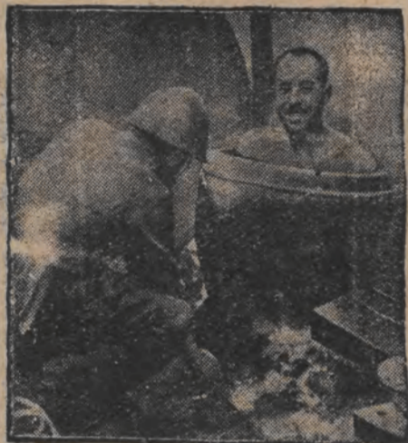
די יענע אויף דער מוח.

זענען בייאפגענט מיט גומי-שטעקעס און ווערן אָנגעהירט דורך אנאמערקאנערין.