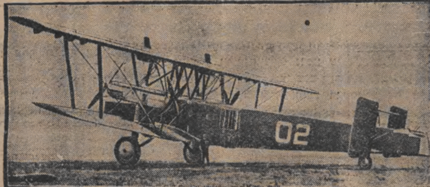
ריזיגער ענגלישער באמבען-אעראפלאן

א יאפאנישער אפיציר מאכט זיך א וואנט אויף א כינעזישן פראנט אין א קעסל, בעווארימט אויף אש.