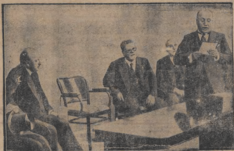
מוסאליני ביי דער געטהע-פיייערונג אין רוים

אין געקומען קיין איראק צו ציען קענען אונז מיט די געזאנגען פון איהר פאלק.