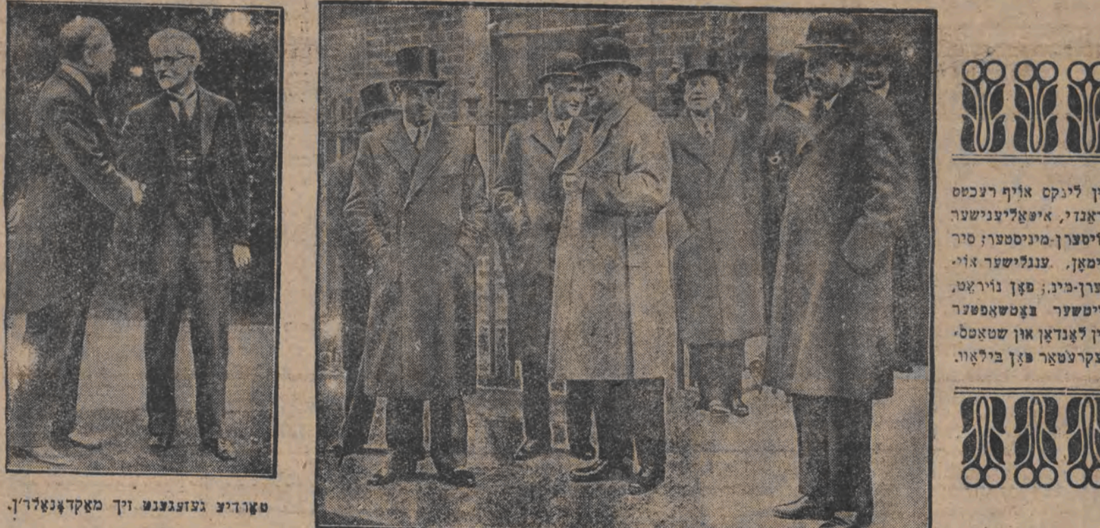
טאָדענע געזעלשאַפט זיך מאַקדאָנאַרין.