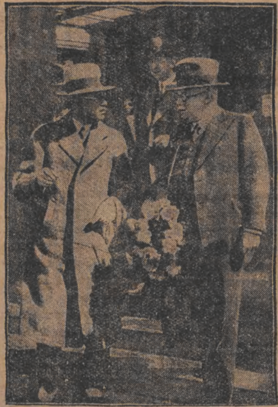
ד'ר לוסערס אנקומען קיין באזעל

דריי וואלקאנען פערשיטען מיט שטיינער און גליהענדען אש שטח פון 700 קילאמעטער איז ארגענטיגא, טשילי און אורוגוואי גאנצע פראווינצען פערגיפטעט פון וואלקאז-רויך; פאדערן גאז-מאסקעס