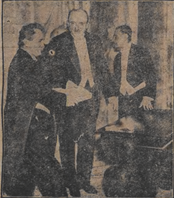
איטאליען שטענען דיינמלאנד א טייער געטעה פון... די כהנה ווערט איבערגעגעבען דעם דייטשען...