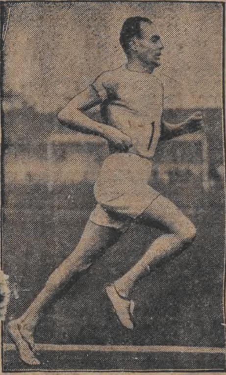
דאס לויף-וואנדער-גירל... אויף לעטסטעס דיסקוואליפיקאציעס געווארען...