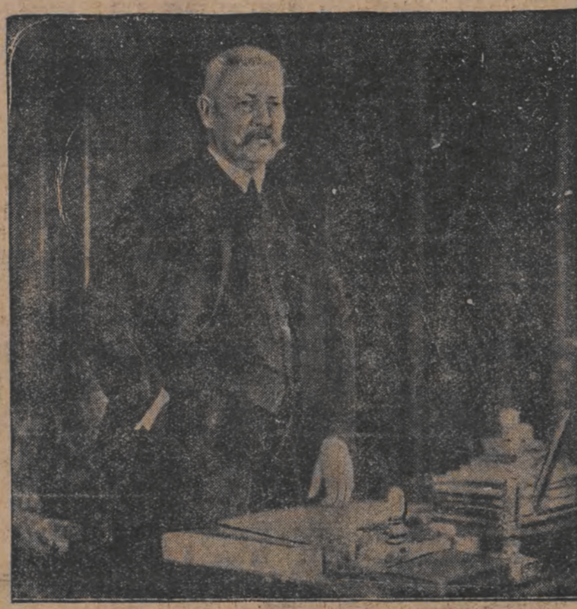
הינדעבורגס נייטעטע אויטאמאמע און זיין ארבייטס-צימער.