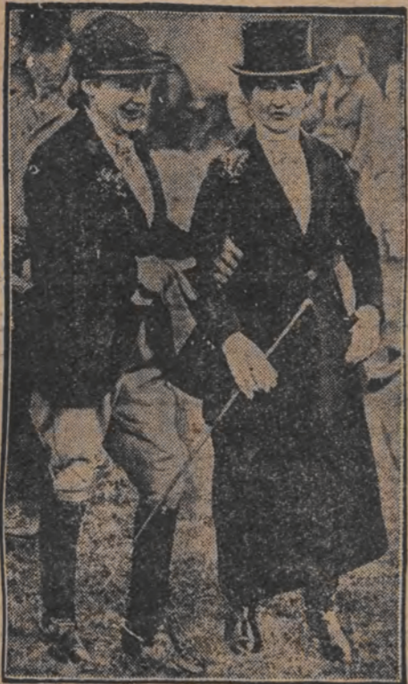
צוויי דורות אין דער מאדע... א לעטצע אויפגאבע פון די פערד-געיענען...