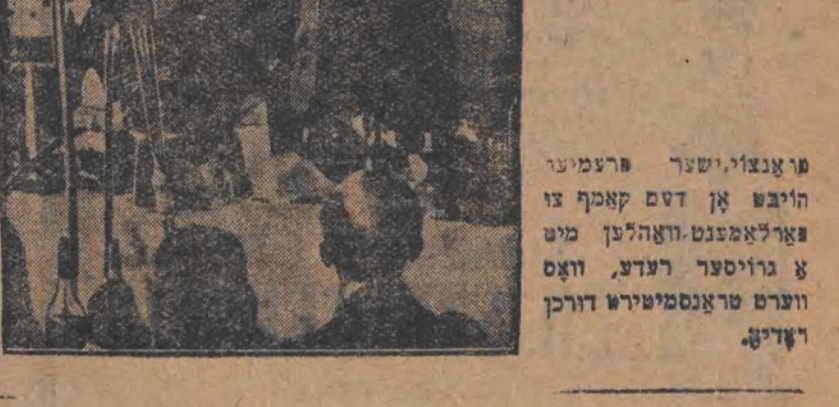
סארדיע עפענט וואהל-האמפ

פערטעמערע-בעריכט דעט פערעמענט- ליכט דערען איז יוני פראם. בראדעזקי צופירדען פון זיי קאנפערענץ מיט הויך-טאמילאר ירושלים 12 אפריל (ספ) דער | און הנגם אגענעראלען פון לאנדאן. קענען עס און פאמיל שטעט האבען די ווי ענטפערן דעם אש אפילו און פאמיל ווערען. האט געפונען זיך 1300 קילאמעטער מער פון געהענדיקע וואלקאז, פאמיל א געהענדיקע שמועס-הענען.