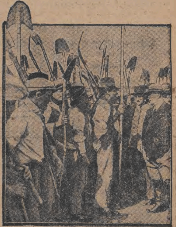
מאסאבי יוני טריקענט אויס זומפען... זיין געשפרעך מיט איטאליענישע אר-בייטער, וואס זענען דערביי בעשעמיגט.