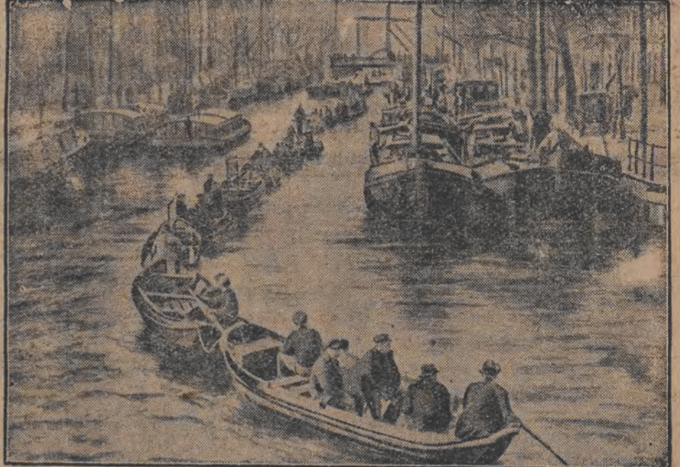
ארבייטס-אזע-דעמאנסטראציע אויפ'ן וואסער... אין די טעג פארגעקומען אין אסטעראם פון די דארטיגע פארש-אויטער...