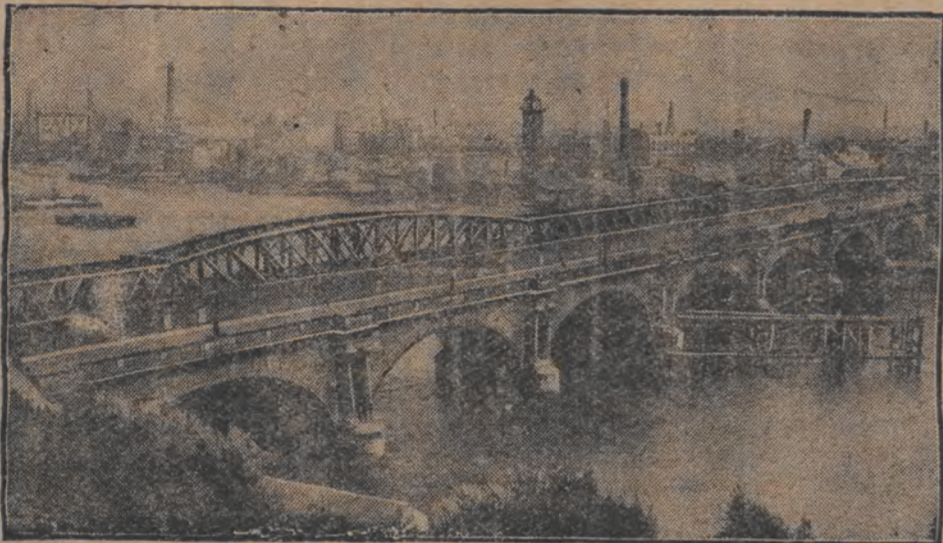
וואַטערלאַק-באַריק פֿון לאַנדן פֿערשױנערט

די הויפט-שאַס פֿון דער קינגזשער פֿראַנצויזישן קאַנגינג, איז איצט דער גיל פֿון יאַפּאַנישן פֿל פֿל.