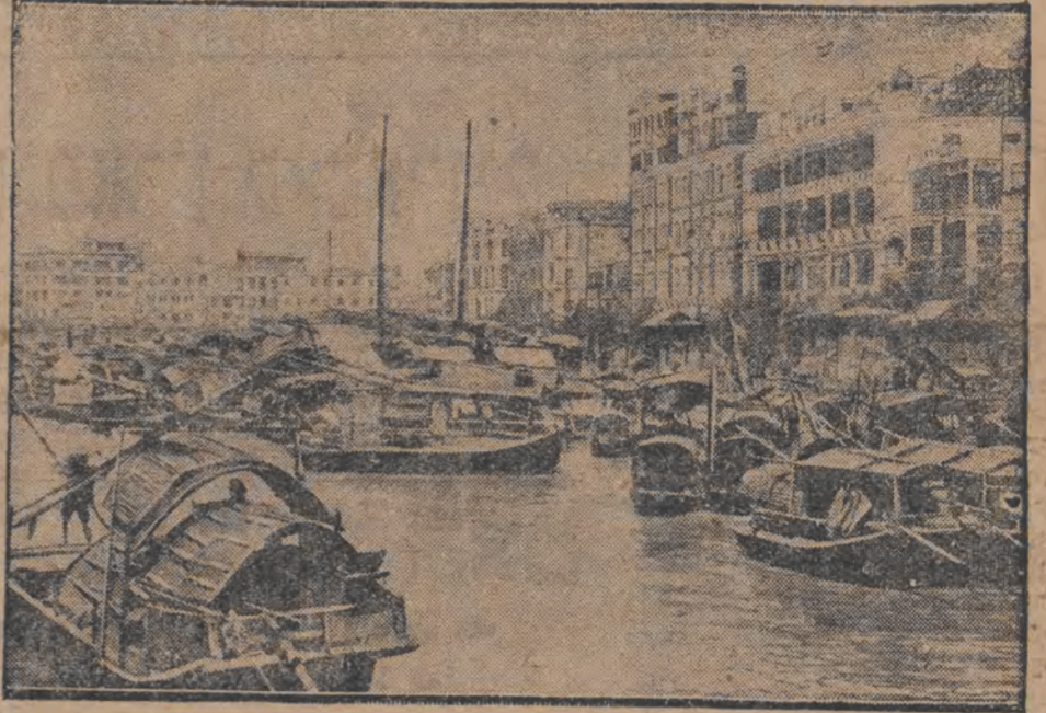
דער פארט אין קאנטאן,

די הויפט-שאַס פֿון דער קינגזשער פֿראַנצויזישן קאַנגינג, איז איצט דער גיל פֿון יאַפּאַנישן פֿל פֿל.