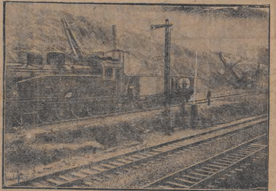
אַ פאַרג ווערט צוגומען

דער וואַנער-באַרג בײַ פֿילדזשוי אײַך דער ליניע כעמניך-דרעווען, וואָס האָט גענומען בעדאַהען די אײַגענשאַפֿט, ווערט איצט צוגומען.