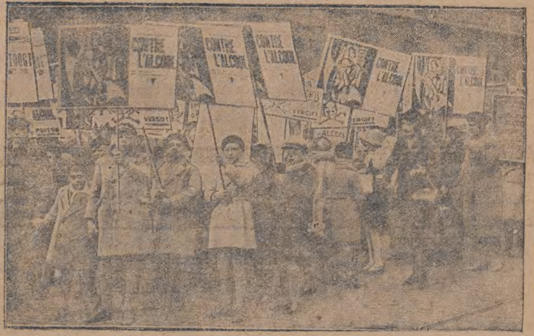
אין בויסעל איז פארגעקומען אַאינפאָרמאָנט דעמאָנסטראַציע געגען אלסיהאל. אין דער דעמאָנסטראַציע האָבען זיך בטייליגט טויזענדער קינדער.

ערוואַרשער האַמוניאַציע-מיטעל אין פּערלין