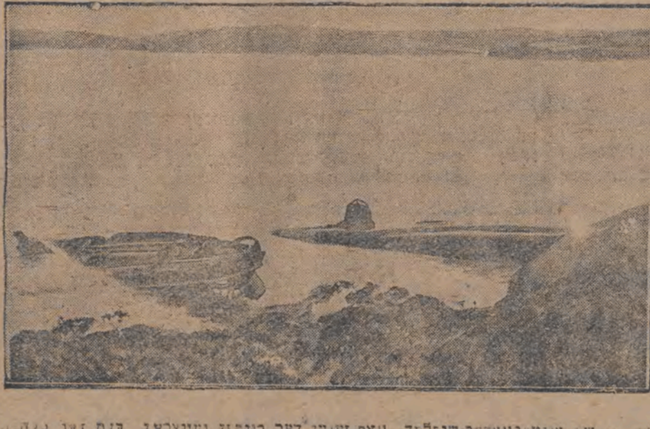
די שטאַט אונטער-וואַסער-שיפּ, וואָס זענען דער-רוינען געוואָרען ביי דער מלחמה פון דער וועלט-מלחמה, זענען די צענדליגער, זענען נאָך דער מלחמה אַרויסגעשליסען געוואָרען פון ים אויפן ברעג, וואָס זיי געפינען זיך בייזן היינטיגען טאָג.