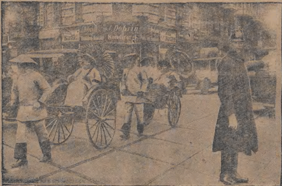
אין די לעצטע נייעס האָט מען געזען געפיהרט געוואָרען דורך קלייט, די 5 אינאָרבעט נאָר פאַר אַ פּילם-יאַר פּאַנאָמע ווערן געפיהרט געוואָרען דורך קלייט, די 5 אינאָרבעט נאָר פאַר אַ פּילם-יאַר פּאַנאָמע

ערוואַרשער האַמוניאַציע-מיטעל אין פּערלין