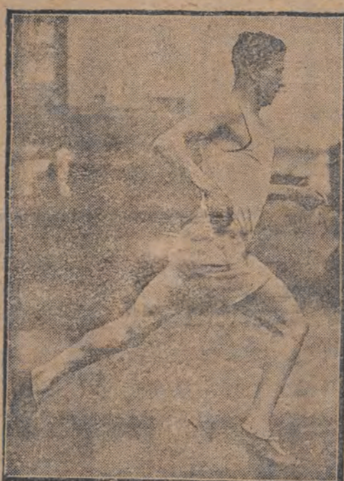
ער האָט שוין גענומען דעם טיטל אייניגע מאל.