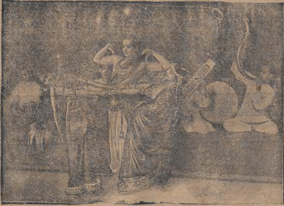
אין בולוי קרעס איזט אויף אַאינדישע כרופע פון טעמפל-טענצער. די טענצער ווערן בעגלייט פון 56 פרושידענע מוזיק-אינסטרומענטן.