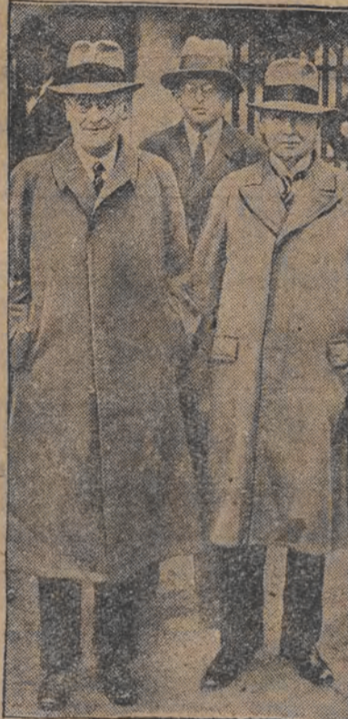
פריינע און גרענער האבען קאמפליקעציע וועגן דער איינע- כע איינעבאנען לאנג און דייטשלאנד

די ביידע קאמפליקעציע איינעבאנען האבען א קאמפליקעציע סעאנאלע פרי- האלטען פרייהאלטען און פאר דער דייטשע פרייהאלטען פון איינע, ענגלאנד וועט זיין ביכילע צו ברענגען מילי- טעריע און קריג-מאטעריעלן קיין תימה און פון דארט און שטעלסטען וועג טראנספארטירן זיי מיט דער באנדאך