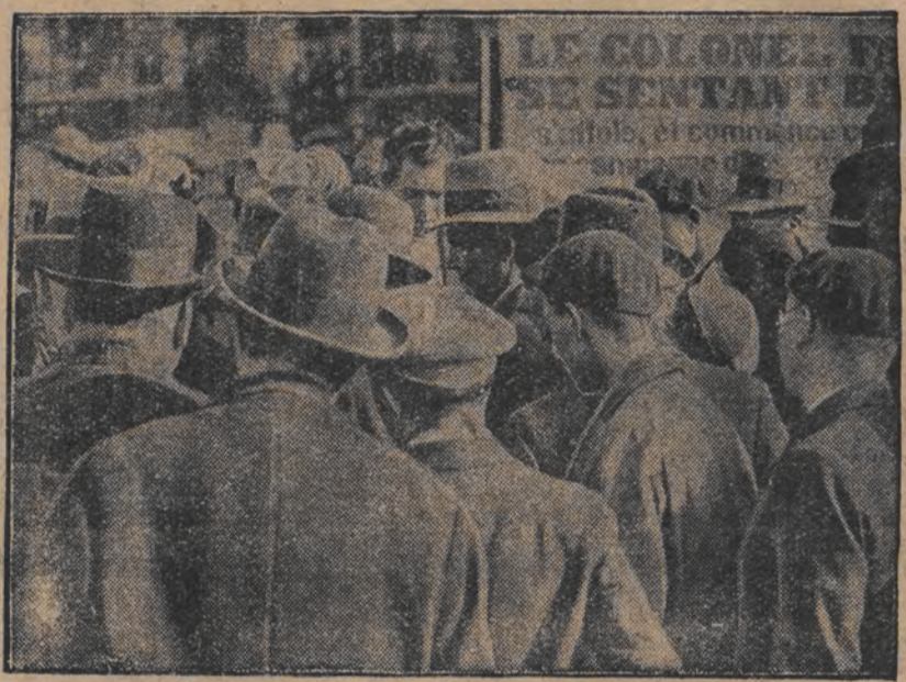
וואהל-פארעם אין דעם פראנקורייד פאר די וואהלען פאר די וואהלען...