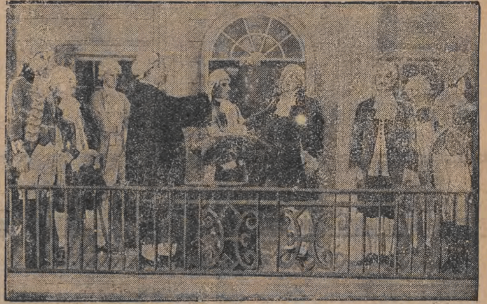
די שבעה פון זשארוש האשינגטאן

אין צוזאמענהאנג מיט דעם 200-יאהריגען געבורט-טאג פון גרויסן אמעריקאנער נאציאנאלען העלד זשארוש האשינגטאן, האט מען אין דער דייטשער קאלאניע אין צעלין פארגעשטעלט דעם מאמענט ווען וואשינגטאן האט אפגעגעבען די שבעה אלס אמעריקאנער פרעזידענט.