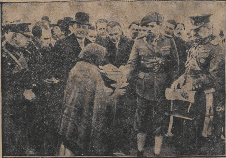
רומענישער קעניג קארל אין די פערפלייצטע געגענדען דער רומענישער קעניג קארל אין געפארטן אין די געגענדען, וואס זענען לעצטענס פערפלייצט געווארען, כדי זיי צו בעקענען פערזענליך מיט דער רעזונאבילע אקציע, אונזער בילד שטעלט פאר זיי דער קעניג טיילט נדבות דער געזאמלער צום 100 יאר טאג.