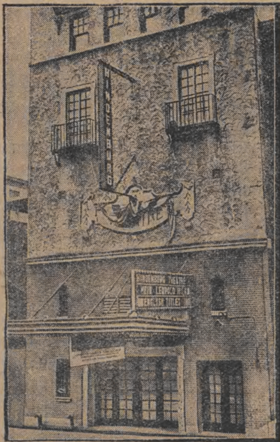
א הינדענבורג קינא אין ניו-יארק און ניו יארק אין נעפענס געווארן א קינא א.ב. הינדענבורג