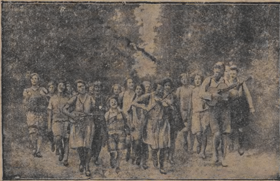
אנ'אר גינעלער אופן פון זאמלען געלט די זייטשע יונגער זאמלעט אויף אזא אופן געלד פאר די ארומע קינדער, וואס דארפן פאררען אויף ווערן קאלאניעס.

אין צוזאמענהאנג מיט דעם 200-יאהריגען געבורט-טאג פון גרויסן אמעריקאנער נאציאנאלען העלד זשארוש האשינגטאן, האט מען אין דער דייטשער קאלאניע אין צעלין פארגעשטעלט דעם מאמענט ווען וואשינגטאן האט אפגעגעבען די שבעה אלס אמעריקאנער פרעזידענט.