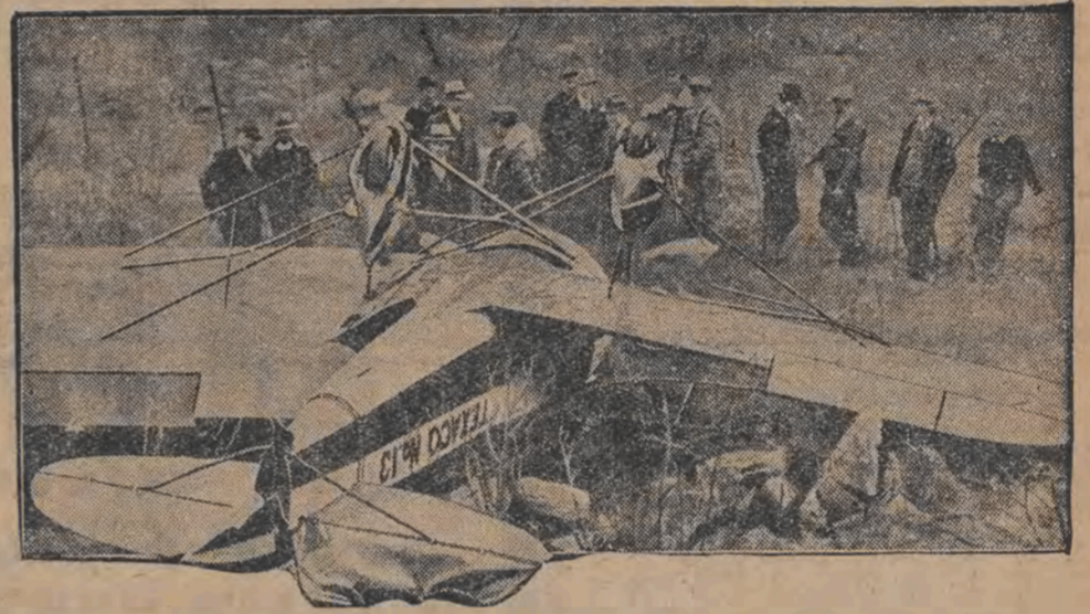
די פאסאזשיר-שיף „איראפא“ האט אנ'אייגענעם אעראפלאן דער פאסאזשיר-דאמער „איראפא“ האט איצט בעקומען זיין אייגענעם אעראפלאן. די ערשטע פאסאזשיר-שיף, וואס האט אנ'אעראפלאן אין ניווען דער „ברעמען“.