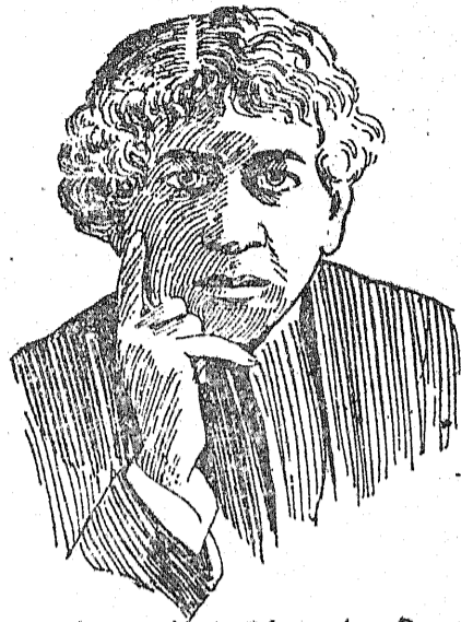
Jagadish Chandra Bose

Sir Jagadish Chandra Bose, najsłynniejszy fizjolog hinduski, założyciel „Bose Institute” przybył do Europy, aby wygłosić serię odczytów o swoich najnowszych wynalazkach. Bawił on niedawno w Pradze, skąd udał się na kurację do Karlsbadu. Następnie słynny fizjolog wyjeżdża z odczytami do Anglii.