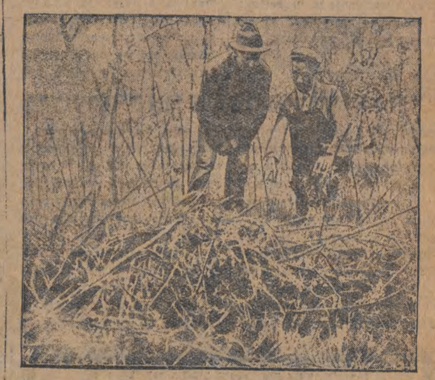
אויף דעם ארט, וואס לינד טיך האט גע-האט מען געפ'ינען זיין טויט לינד.

ב' ער ל' י' 23 מאי (י"א). מארגען (היינט) דינסטאג אונטער וועט די בעריהמטער זשורנאליסט אלבערט לאנד א דיספוט וועגען אנטיסעמיטיזם. עס וועלען רעפערירען: לודוויק האלבער און נאמען פון צענטראל-פון די דייטשע יודען און דער טעאָרעטיקער פון די אנטיסעמיטיזם, דער רעדאק-טאר פון דער 'פאלקס-שטימע', ווילהעלם שאַפּעל.