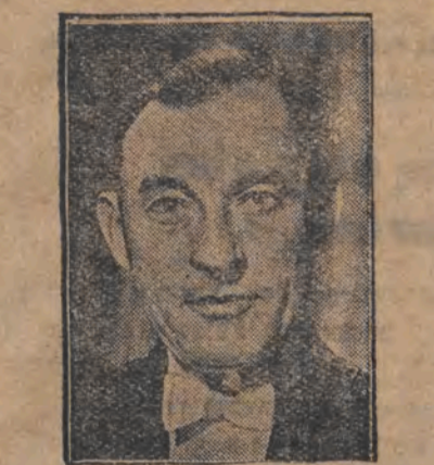
דער ניו יורק אויבור פירגומייס שער דושיס וואקער הערט בעשולדיגט אין קארופטיע.

סענאט. ערקלערונגען פון די צע-מארשאלעך דיר פאליאקעווישט בערעקען א טיילארט זי.