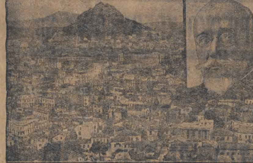
די פאליטישע לאגע אין גריכענלאנד. היינצטיק איז וואס די יודען זענען געווען פארשפרייט אין גריכענלאנד, און די יודען זענען געווען פארשפרייט אין גריכענלאנד.