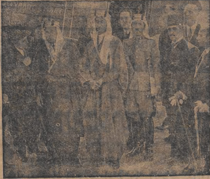
נעכטען אין געקומען קיי ווארשא דער צווייטער ווען פון קעניג פון הער זשאס, עמיר פייזאל, וועלכער איז גלייכצייטיג דער אויסערן-מיניסטער אין זיין פאטער'ס מדינה.

ווארשא, 23 מאי (שולעס). היינט א גאנצען טאג האט די בודזשעט-אפטיילונג ביים פינאנץ-מיניסטעריום אדורכגעפיהרט אויסרעכענונגען וויפיל עס וועט אויסמאכען די רעדוקציע פון די בעאמטען-פענסיעס פון 1 יוני ד.ה. אין די אונטער-שעה'ן האט מען דעם פינאנץ-מיניסטער רעפערירט, אז די דאזיגע אפשאצונגען וועלען אויסמאכען 80 מיליאן זל. אין גישט ווי מ'האט פריהער געמיינט 110 מיליאן זל.