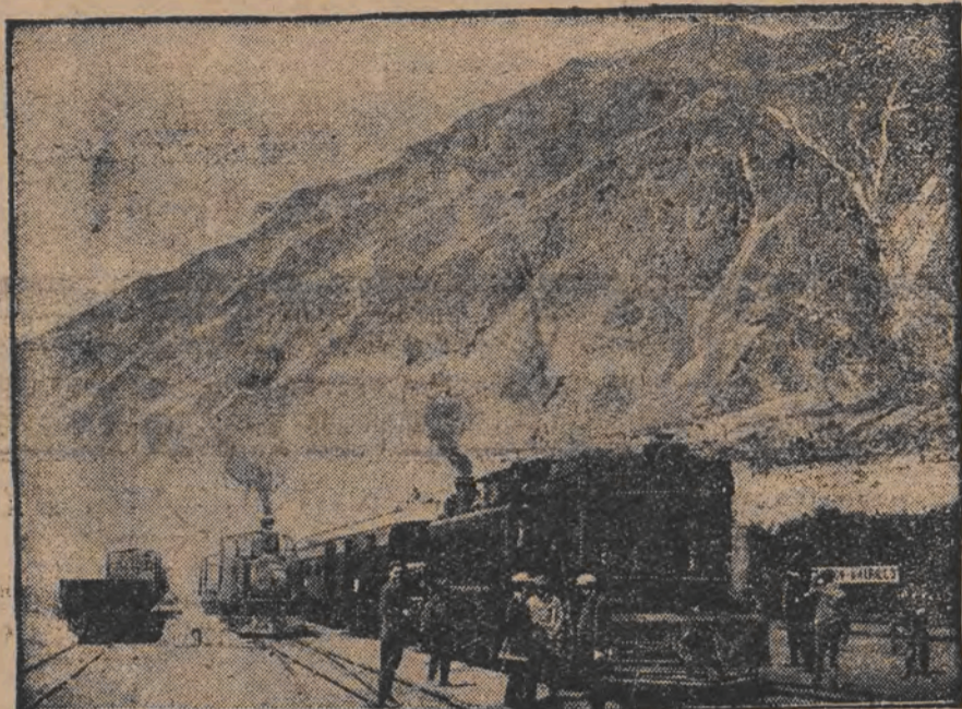
ביים בויען די נייע באהן-ליניע פון טשילי קיין ארגענטינע, האט זיך איינגעבראכען א טונעל אונטער העלען 42 אריינער זענען געווארען לעבעדיג בענגאנען.

איינברוד פון טונעל ביים בויען א נייע באהן-ליניע