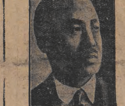
דער יאפאנישער הויפט-קאמאנדיר

די סטארקסט גרופע און פון קאנגרעס איז זאלען בלויז.