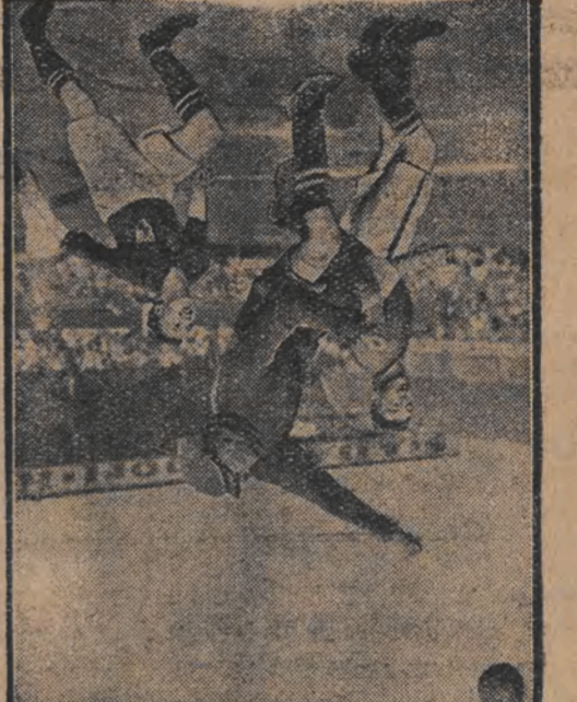
סע סאציאלעלער מאמענט אויף אנ'אינטערנאצי. פוסבאל - מעשע גרויסע ענגלישען לייג-מייסטער טוערען און דער דייטשער בונדעס-מאנשאפט, יעדען יום האט ער זיך 2:2.