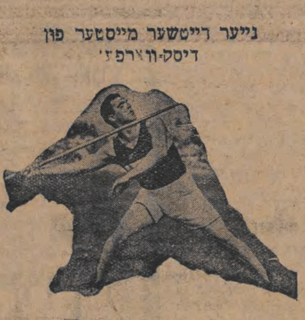
נייער דייטשער מייסטער פון דיסק-ווארפן. דער לייפציגער ווימאן האט געשלאגען דעם וועלט-רעקארד אין דיסק-ווארפן, ער האט געווארפען 69.54 מעטער.