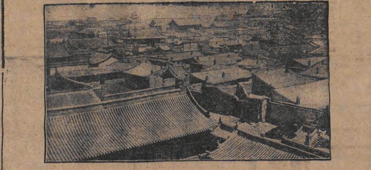
כארבי - די נייע אפעראציע-באזע פון די יאפאנער.

צי וועט יאפאן אנהויבען א נייע מלחמה מיט רוסלאנד?