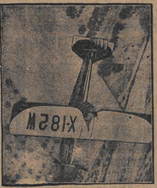
אנ'ארפלא, וואס קערעוועט זיך אליין. דעם אראפלאן האט ערפינדען דער אמערי-קאנער קארנעליוס.

צייכענט, אז ער גיט זיך אונטער. דער קאמף טראגט גארנילאו האט זיך געפונען אלס איבערשפיער, שמידט-וועסטערגארד האט שוין און דער 5. מינוט בעזונט פארטינאן. היינט קעמפטן: קאואן - קראווי (דעצ), טראג-בירקענבערג, שמידט וועסטערגארד-קאלקא און אלוויערע-בארקווינקא (דעצ).