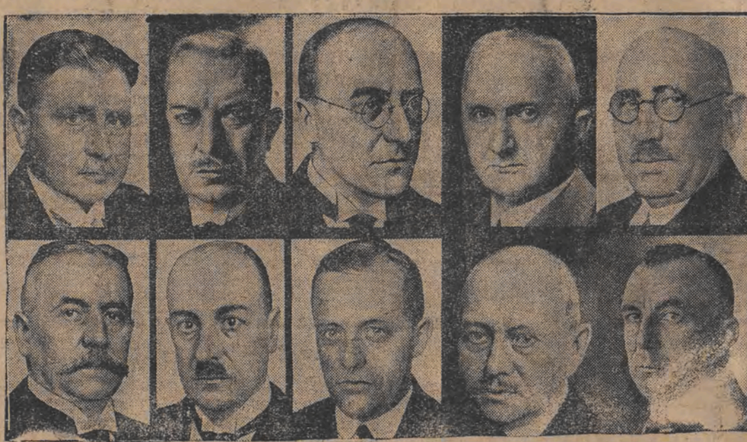
אויבן פון לינקס: אינערן אין רייכסוועהר-מיניסטער גענ. גרענער; זיטריך (פינאנץ-מיניסטער) ד"ר בריינג'ס; רייכס-קאנצלער און אויסערן-מיניסטער; ד"ר יאפל (יוסטין-מיניסטער); ד"ר שטענהאואלד (ארבייטס-מיניסטער); אויסנזען, פון לינקס: שילע (רעגירונג) און פאנאוויטש-שאפט; סרנדעלענבורג (וויסנשאפט-מיניסטער); סרעוויראנט (באזון-מיניסטער); ד"ר שטענעל (זאסט); שלאגע-שניינגען (מיניסטער פון און פארטעל).

בריינג'ס קאבינעט, וואס האט זיך אנגעגעבען אין דימיסיע