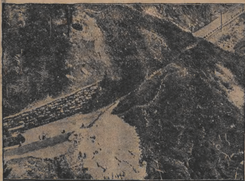
א שניי-לאוינע פער שיט א שאסע

אויפן שאסע צווישן פאס און פערליטען איז אגעפאלען א שניי אויף 10 מעטער הויך און אומגעליך געמאכט דעם פערקעהר.