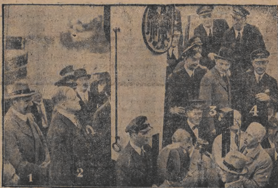
פיערליכע בעגריסונג פאר די פליהער פון „דא א“

כרעוויקאנס, ביז-איצטיגער דייטשער פערקעהרס-מיניסטער, בעגריסט די פליהער.