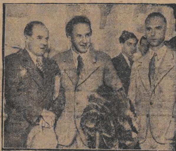
א פילם-עקספערדיציע קיין גרענלאנד