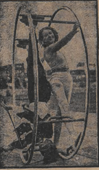
נייער מין ספארט ווערט איצט געטריבען אין בערלין אויף דער זומער-אויסטעלונג...