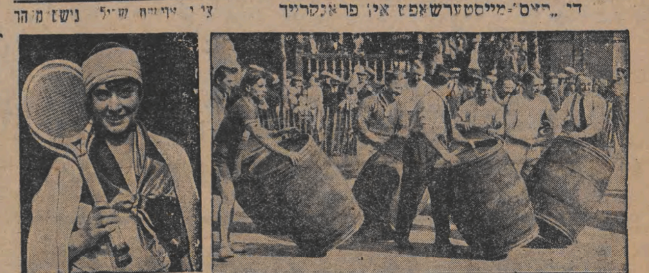
די דייטשע מעניס-מייסטערין אויסעם האט זיך צוליב איהר געזונט-צושטאנד צוריקגעצויגען פון שפילן.