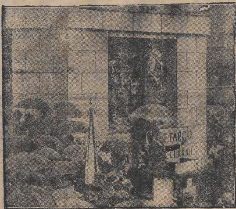
צוליב דעם 50-יגריגן עקזיסטענץ פון גא-הארד-טונעל אין שווייצערלעך איז געשטעלט געווארן א דענק-מאל לכבוד דעם בויער פון טונעל איראלא.