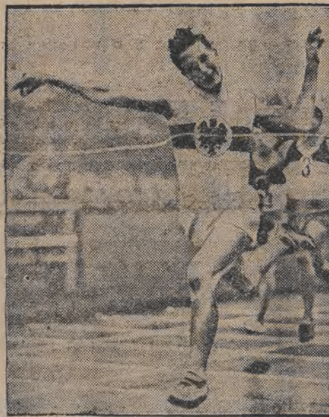
דער דייטשער מייסטער יאנאש האט געשלאגען א נייעם וועלט-רעקארד אין לויפן אויף 100 מעטער דורכמאכנדיג דעם דאזיגען שטח אין 10.3 סעקונדען.