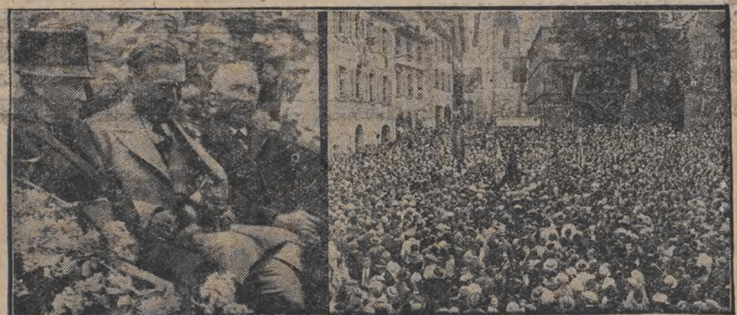
נאך 12 יאהר געפאנגענשאפט אהיימ-עקומען.