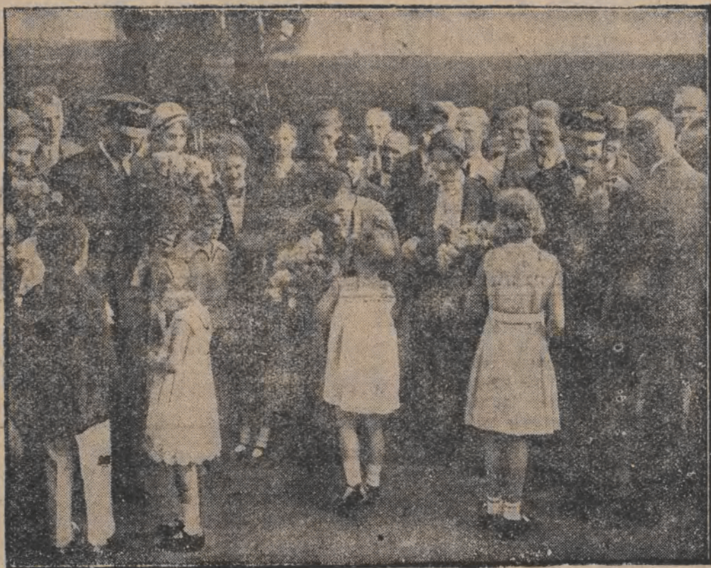
דיי דייטש: לייג-ר-קאשיאנען האבן ארויסגעמאכט אין דער קאמפ-קלאמנט-פארק.