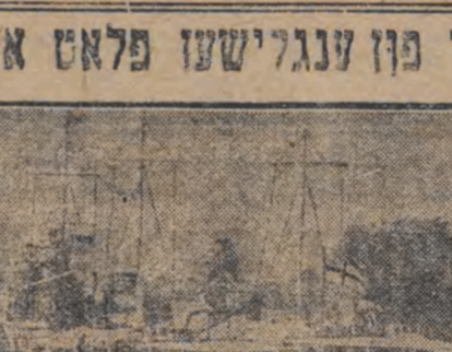
א ציטונג פון דער ענגלישער ארימאליסט וואס בעשעפוט פון מנהרע קריגס-שיפן, אויך א בעזוך אין דענציגער פאָרט

דער בעזוך פון ענגלישען פלאט אין דאנציג זענען געווען געוואלדיג געווען צו פארענדיגן די הימל-עריסטישע דעוואטאמט.